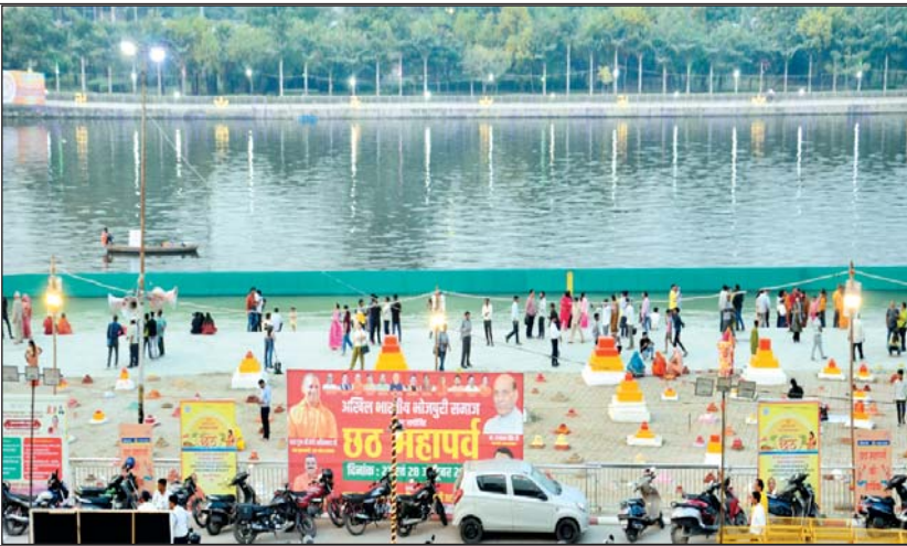
छठ महापर्व के लिए सजा गोमती तट