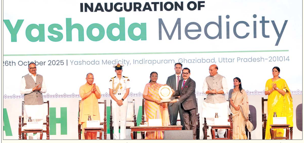
गाजियाबाद (उप्र)। रक्षा मंत्री राजनाथ सिंह ने रविवार को कहा कि स्वस्थ भारत ही विकसित भारत की आधारशिला है। यहां

राष्ट्रपति द्रौपदी मुर्मू द्वारा यशोदा मेडिसिटी के उद्घाटन के अवसर पर आयोजित समारोह को संबोधित करते हुए राजनाथ सिंह ने कहा, हम उस भारत की ओर बढ़ रहे हैं जिसका सपना हमारे पूर्वजों ने देखा था, जो शक्तिशाली और ...शेष पृष्ठ 10 पर