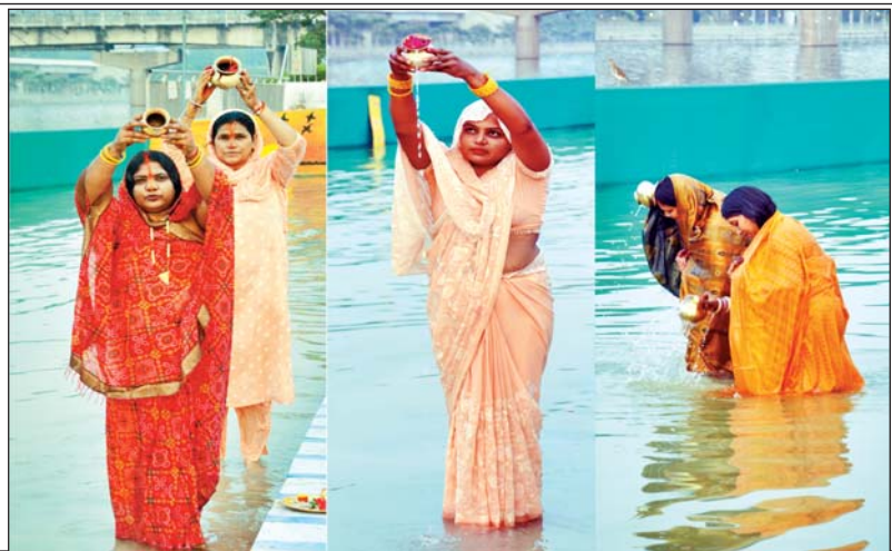
गोमती तट पर पूजा-अर्चना करती महिलाएं