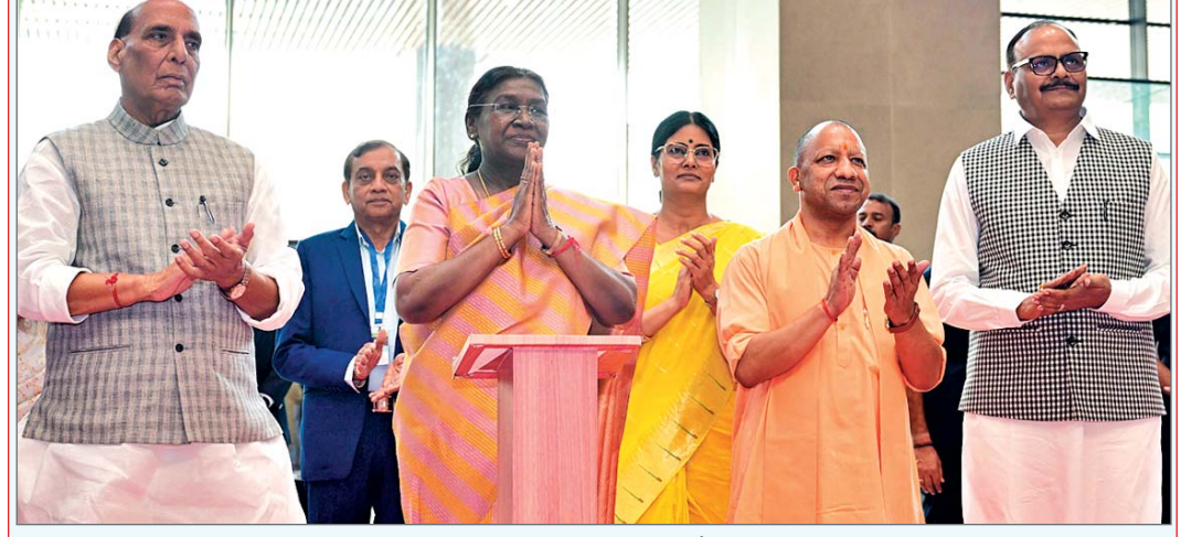
गाजियाबाद। मुख्यमंत्री योगी आदित्यनाथ ने रविवार को कहा कि अब राज्य के लोगों को इलाज के लिए दिल्ली में नहीं भटकना पड़ेगा।

गाजियाबाद में रविवार को राष्ट्रपति द्रौपदी मुर्मू द्वारा एक निजी अस्पताल के लोकार्पण किए जाने के बाद आयोजित समारोह को संबोधित करते हुए योगी ने कहा कि उत्तर प्रदेश अब स्वास्थ्य सेवाओं के क्षेत्र में नयी उंचाइयों को छू रहा है। स्वास्थ्य क्षेत्र ...शेष पृष्ठ 10 पर