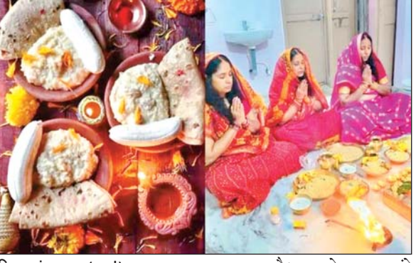
जिला संवाददाता (VOL)

माना जाता है। खरना के साथ 36 घंटे का निर्जला व्रत शुरू हो गया है जो 28 अक्टूबर को उगते सूर्य को अर्घ्य देकर व्रत का समापन किया जाएगा। छठ व्रत का आरंभ 25 अक्टूबर से हो चुका है। सोमवार को डूबते हुए सूर्य को अर्घ्य दिया जाएगा और प्रसाद को सुरक्षित अपने घर पर रखा जाएगा उसके बाद दूसरे दिन उगते सूर्य को अर्घ्य देकर व्रत का समापन होगा उसके बाद व्रत में महिलाएं प्रसाद खाकर व्रत का पारण करेंगी। छठ व्रत करने वाली महिलाएं अपने परिवार की सुख समृद्धि और संतान की लंबी आयु के लिए व्रत करती है।