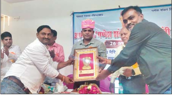
जिला संवाददाता (VOL)