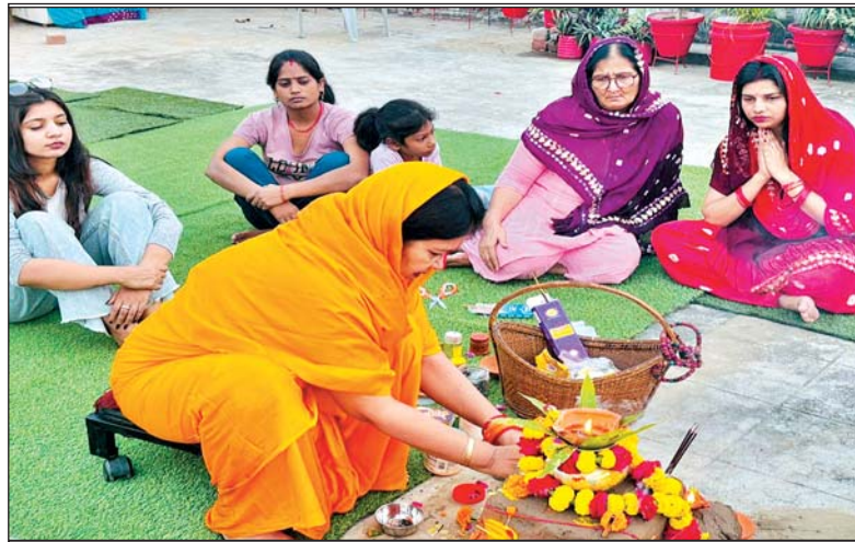
छठ महापर्व में खरना की पूजा करती व्रती महिला