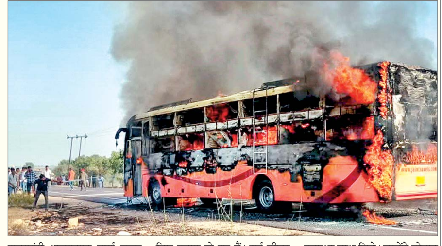
मुख्यमंत्री भजनलाल शर्मा दुख जताते हुए कहा है कि लोगों को जल्द स्वास्थ्य लाभ मिले। उन्होंने सोशल मीडिया प्लेटफॉर्म एक्स पर लिखा कि जैसलमेर से ...शेष पृष्ठ 10 पर

एजेंसी जयपुर। जैसलमेर से जोधपुर जा रही एक निजी बस मंगलवार दोपहर अचानक भीषण आग की चपेट में आ गई। हादसे में तीन बच्चों और चार महिलाओं समेत करीब 16 यात्री झुलस गए। घायलों को नजदीकी अस्पताल में भर्ती कराया गया है, जबकि गंभीर रूप से झुलसे यात्रियों को जोधपुर रेफर किया गया है। जानकारी के मुताबिक, इस हादसे में प्रथम दृष्टया करीब 10 से 12 लोगों के जिंदा जल जाने की आशंका है। जैसलमेर हादसे पर सीएम भजनलाल ने दुख जताया है। मुख्यमंत्री भजनलाल शर्मा ने कलेक्टर एसपी से फोन पर बात करके पीड़ितों को हर संभव मदद के निर्देश दिए हैं।