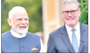
ब्रिटिश प्रधानमंत्री स्टार्मर की भारत यात्रा से दोनों देशों के बीच निवेश और व्यापार में सहयोग के नये रास्ते बनेंगे।

यह समय भारत और ब्रिटेन दोनों के लिए नये रास्ते तलाशने और आगे बढ़ने का है। भारत अपनी आर्थिक प्रगति को आगे बढ़ाने के लिए अनेक चुनौतियों का सामना कर रहा है। अमरीकी टैरिफ न इसे और जटिल बना दिया है। दूसरी तरफ ब्रेजिकट के बाद ब्रिटेन के सामने भी उभरती अर्थव्यवस्थाओं के बीच अपना कारोबारी विस्तार करना जरूरी है। ऐसे में अगर ब्रिटेन और भारत के बीच 'मुक्त व्यापार समझौता' लागू होता है, तो दोनों देशों की अर्थव्यवस्थाओं को व्यापक लाभ होगा। ब्रिटेन के प्रधानमंत्री कियर स्टार्मर की हालिया भारत यात्रा का उद्देश्य भी दोनों देशों के बीच आपसी रिश्तों में आई गर्मजोशी को आगे बढ़ाना था। इससे पहले गत जुलाई में दोनों देशों के बीच व्यापक आर्थिक एवं व्यापार समझौते (सीडीए) पर हस्ताक्षर हुए थे। स्टार्मर के साथ यूके के कारोबारियों का अब तक का सबसे बड़ा प्रतिनिधिमंडल भारत आया था। ब्रिटिश सरकार ने यह स्पष्ट किया है कि इस यात्रा के दौरान भारतीय कंपनियों द्वारा ब्रिटेन की अर्थव्यवस्था में करीब 1.3 अरब पाउंड के निवेश का वादा किया गया है। इसमें टीवीएस मोटर्स द्वारा इंग्लैंड के उत्तरी हिस्से में विनिर्माण सुविधाओं के विस्तार की योजना भी शामिल है। टीवीएस मोटर ने 2020 में ब्रिटिश कंपनी नॉर्टन मोटरसाइकल का अधिग्रहण किया था। इस बीच भारत को उम्मीद है कि नई संयुक्त परियोजनाओं की बदौलत उसे उन्नत नवाचार तक पहुंच बनाने में मदद मिलेगी। व्यापार सौदा भी भारतीय कंपनियों के लिए नए बाजार खोल सकता है। इसमें कूटे बाजार भी शामिल हैं।