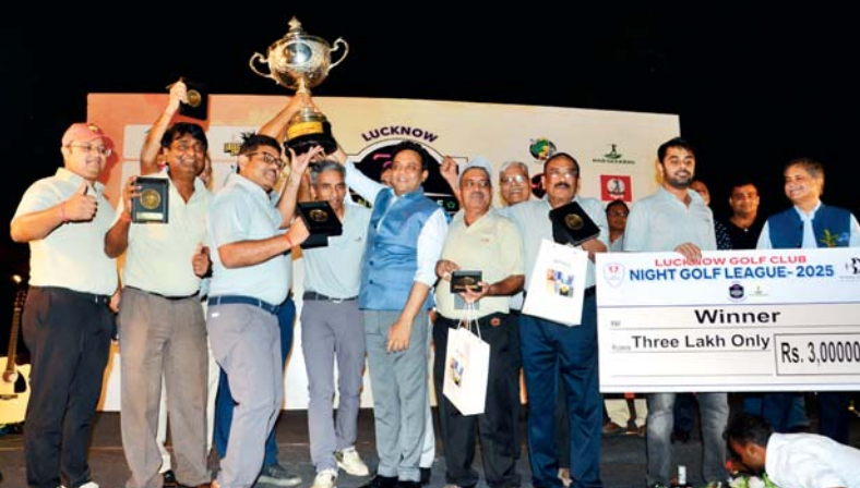
चैम्पियन पार सीकर्स की टीम

आज का मौसम अधिकतम : 32.06 डिग्री न्यूनतम : 26.04 डिग्री भीतर पढ़ें उत्तर प्रदेश बना भारत का उभरता आईटी हब: सीएम (पृष्ठ-02) पीएम ने लखनऊ की महिला से समझी खेती की बारीकी (पृष्ठ-02) ओएनजीसी के पास अपने मूल्यांकन से एक-तिहाई संपत्ति (पृष्ठ-10) पर्यटन क्षेत्र के सालाना 25 प्रतिशत की दर से बढ़ने का अनुमान (पृष्ठ-10) महंगाई के आंकड़े से तय होगी शोहर बाजार की दिशा (पृष्ठ-10)