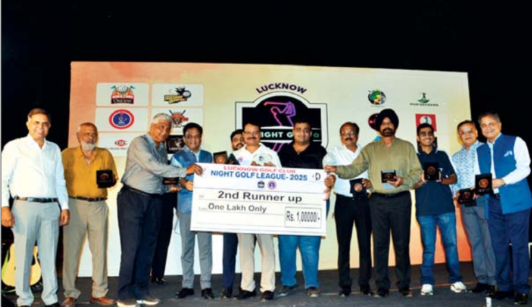
सेकेंड रनर-अप बीबीडी रेंजर्स की टीम