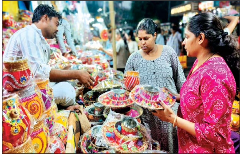
करवाचौथ के लिए खरीदारी करती महिलाएं