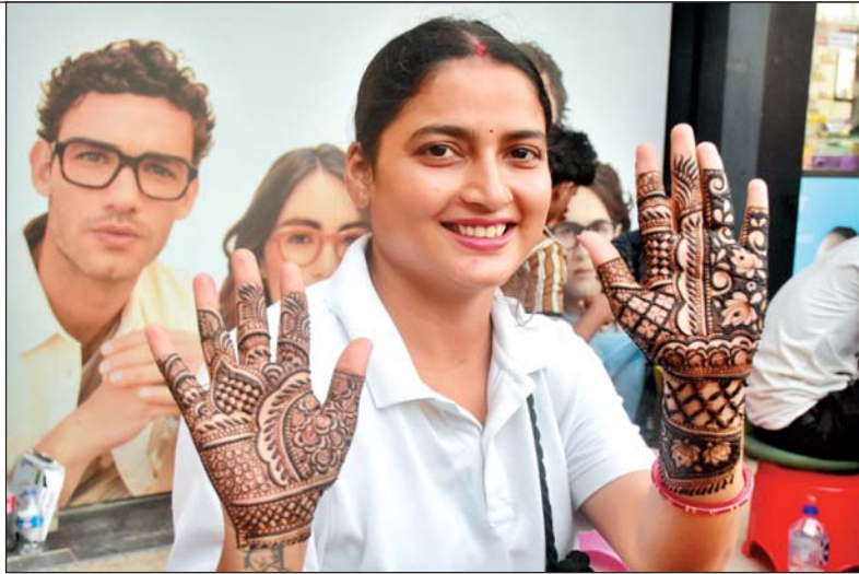
व्रत से पहले मेहदी लगवाती महिला