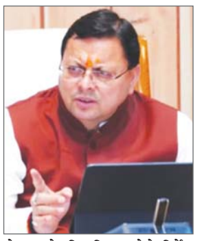
मोबाइल ऐप विकसित करने के निर्देश दिए गए हैं। यह ऐप उत्तराखंड में आने वाले बाहरी लोगों का केंद्रीकृत डिजिटल डेटाबेस तैयार करेगा, जिसमें उनकी पहचान, पता, कार्यक्षेत्र और पृष्ठभूमि संबंधी जानकारी सुरक्षित रूप से दर्ज होगी। मुख्यमंत्री धामी ने कहा कि देवभूमि की सांस्कृतिक अस्मिता

देहरादून। उत्तराखंड में तेजी से बदलते डेमोग्राफिक प्रोफाइल ने सरकार की चिंता बढ़ा दी है। बाहरी राज्यों से आकर यहां बसने वाले लोगों के सत्यापन में लापरवाही और फर्जी दस्तावेजों के जरिए सरकारी लाभ लेने की बहती घटनाओं को देखते हुए मुख्यमंत्री पुष्कर सिंह धामी के निर्देश पर गृह विभाग ने इस दिशा में सख्त कार्रवाई की तैयारी शुरू कर दी है। मुख्यमंत्री के निर्देश पर एकीकृत डेटाबेस अपडेट रखने के लिए विशेष मोबाइल ऐप तैयार किया जा रहा है। राज्य सरकार अब सत्यापन प्रक्रिया को पूरी तरह डिजिटल और पारदर्शी प्रणाली में बदलने जा रही है। इसके लिए गृह विभाग को एक विशेष