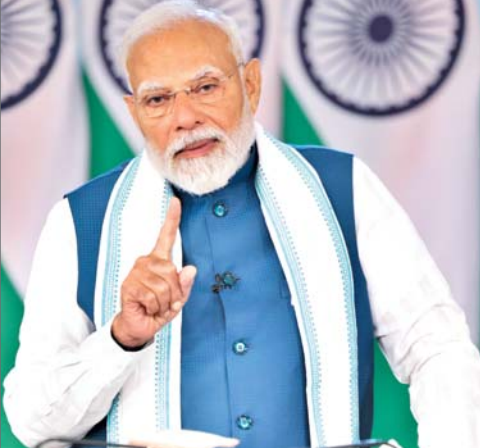
रूप से ग्रस्त भारत अब दुनिया की सबसे बड़ी स्वास्थ्य सेवा और सामाजिक सुरक्षा योजनाओं का देश है। उन्होंने कहा कि भारतीय किसान नवाचार कर रहे हैं और यह सुनिश्चित कर रहे हैं कि राष्ट्र

एजेंसी नयी दिल्ली। प्रधानमंत्री नरेन्द्र मोदी ने मंगलवार को सरकार के मुखिया के रूप में अपने 25वें वर्ष की शुरुआत करते हुए कहा कि लोगों के जीवन में सुधार लाना और इस महान राष्ट्र की प्रगति में योगदान देना उनका निरंतर प्रयास रहा है। मोदी ने एक्स पर सिलसिलेवार पोस्ट कर कहा कि उन्होंने 2001 में आज ही के दिन पहली बार गुजरात के मुख्यमंत्री के रूप में शपथ ली थी। उन्होंने उन बदलवों पर जोर दिया जो पहले उनके गृह राज्य में और फिर उनके कार्यकाल में पूरे देश में आए। उन्होंने कहा अपने साथी भारतीयों के निरंतर आशीर्वाद से मैं सरकार के मुखिया के रूप में अपनी सेवा के 25वें वर्ष में प्रवेश कर रहा हूँ। भारत की जनता के प्रति मैं आभार व्यक्त करता हूँ। उन्होंने कहा इन सभी वर्षों के दौरान मेरा निरंतर प्रयास रहा है कि हम अपने लोगों के जीवन को बेहतर बनाएं तथा इस महान राष्ट्र की प्रगति में योगदान दें, जिससे हम सभी का पालन-पोषण किया है। मोदी ने कहा कि संयुक्त प्रगतिशील गठबंधन (संप्रग) सरकार के दौरान भ्रष्टाचार, भाई-भतीजावाद और नीतिगत पक्षाघात के सबसे बुरे