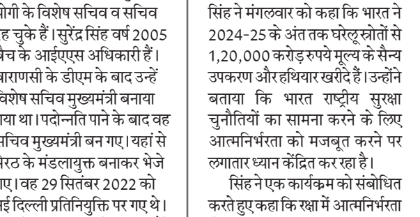
सुरक्षा पूरे राष्ट्र की सामूहिक जिम्मेदारी है और रक्षा क्षेत्र को मजबूत करना केवल एक संस्थान या सरकार का कर्तव्य नहीं है, बल्कि सभी भारतीयों का साझा संपत्कल्प है। रक्षा मंत्री ने इस अवसर पर राज्यों और केंद्र शासित

आत्मनिर्भरता को मजबूत करने पर लगातार ध्यान : राजनाथ सिंह