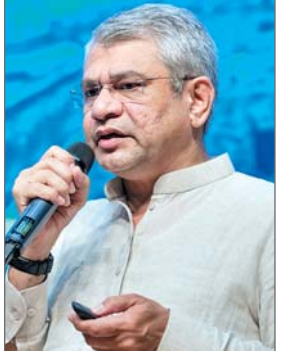
नयी दिल्ली। प्रधानमंत्री नरेन्द्र मोदी की अध्यक्षता में मंगलवार को आर्थिक मामलों की मंत्रिमंडलीय समिति ने करीब 24,634 करोड़ रुपये की लागत वाली चार मल्टी-ट्रैकिंग रेलवे परियोजनाओं को मंजूरी दी। एक आधिकारिक बयान में यह जानकारी दी गयी। बयान के मुताबिक, महाराष्ट्र, मध्य प्रदेश, गुजरात और छत्तीसगढ़ के 18 जिलों से गुजरने वाली इन चार परियोजनाओं से भारतीय रेलवे के मौजूदा नेटवर्क में लगभग 894 किलोमीटर की वृद्धि होगी। इससे लोगों, माल और सेवा की आवाजाही और सुलभ होगी। बयान के मुताबिक, मंत्रिमंडल ने जिन परियोजनाओं को हरी झंडी दी है, ...शेष पृष्ठ 10 पर

लखनऊ। मुख्यमंत्री योगी आदित्यनाथ ने मंगलवार को पूर्व विधायक स्वर्गीय डी.पी. बोरा की 85वीं जयंती के अवसर पर मिशन शक्ति 5.0 के अंतर्गत मातृशक्ति वंदन और 15 सेवा शक्ति केंद्रों (सिलाई प्रशिक्षण केंद्र) का शुभारंभ किया। इसी दौरान उन्होंने स्व. डी.पी. बोरा की प्रतिमा का चर्चुअल अनावरण किया और समाज के विभिन्न क्षेत्रों में विशिष्ट योगदान देने वाली मातृशक्तियों का सम्मान भी किया। सीएम योगी ने नारी सशक्तीकरण और सामाजिक समरसता पर जोर देते हुए स्वर्गीय डी.पी. बोरा के संघर्षों और समाज सेवा के प्रति उनके समर्पण को याद किया। कार्यक्रम को संबोधित करते हुए मुख्यमंत्री ने कहा कि यह महर्षि वाल्मीकि और परम कृष्ण भक्त मीराबाई की जयंती का दिन भी है। उन्होंने कहा कि आज का दिन उत्तर प्रदेश के लिए विशेष महत्व रखता ...शेष पृष्ठ 10 पर