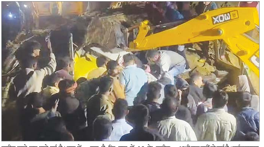
करीब साढ़े छह बजे हुई है। बस में मरोतन बरटी, घुमारवां और बीच के स्टेशनों के लोग सवार थे। बताया जा