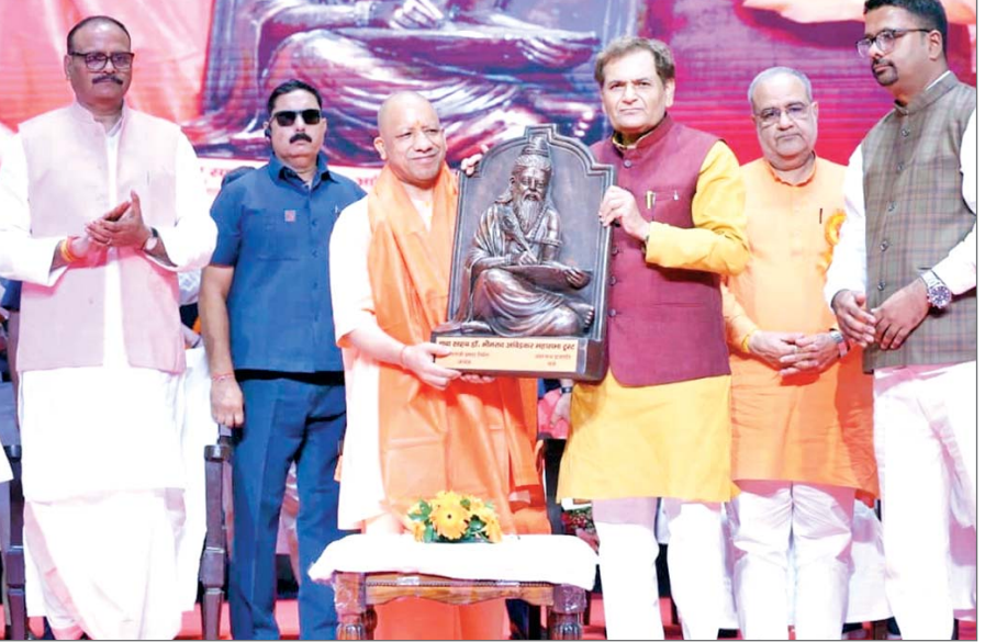
लोककल्याण व मानव कल्याण का मार्ग प्रशस्त करने और नई कृति की रचना के लिए उन्होंने हजारों वर्ष पहले देवर्षि नारद से प्रश्न किया कि चरित्र से युक्त कौन ऐसा व्यक्ति है, जिसके बारे में मैं कुछ लिख सकूँ, क्योंकि महर्षि वाल्मीकि जानते थे कि चरित्र से युक्त व्यक्ति ही लोककल्याण व राष्ट्र

विशेष संवाददाता लखनऊ। मुख्यमंत्री योगी आदित्यनाथ ने वाल्मीकि समाज के लोगों से कहा कि आपकी सुरक्षा समाज की सुरक्षा है। आपका सम्मान भगवान वाल्मीकि की विरासत का सम्मान है। सीएम ने इस दौरान उन्हें खुशखबरी भी दी और कहा कि अभी बड़ा कार्य करने जा रहे हैं। सफाई, सविदा कर्मचारी को अब आउटसोर्सिंग कंपनी नहीं, बल्कि सरकार का कॉरपोरेशन सीधे अकाउंट में पैसा देगा। स्वच्छता कर्मियों को पांच लाख रुपये का स्वास्थ्य बीमा का कवर भी देगा। जब अकाउंट में कॉरपोरेशन से पैसा आएगा तो यह व्यवस्था करेंगे कि दुर्भाग्य से किसी सफाई कर्मचारी के साथ घटना-दुर्घटना हुई या वह आपदा की छत में आ गया तो बैंक से बात करेंगे कि बैंक के माध्यम से 35-40 लाख रुपये देने की व्यवस्था की जानी चाहिए। यूपी के 80 हजार होमगार्ड को यह कवर दे दिया गया है। अब सफाई कर्मचारियों को इस व्यवस्था से जोड़ने जा रहे हैं। सीएम योगी मंगलवार को इंदिरा गांधी प्रतिष्ठान में बाबा साहेब डॉ. भीमराव आंबेडकर महासभा ट्रस्ट के तत्वावधान में आयोजित महर्षि वाल्मीकि प्रकट दिवस समारोह में शामिल हुए। सीएम ने भगवान वाल्मीकि की जयंती पर प्रदेशवासियों को बधाई दी। कार्यक्रम में लघु फिल्म भी दिखाई गई।