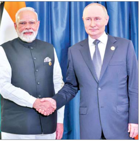
प्रधानमंत्री नरेन्द्र मोदी व राष्ट्रपति व्लादिमीर पुतिन (फाइल फोटो) किया जाए। उन्होंने कहा (भारत) कभी किसी को स्वयं को अपमानित नहीं करने देगा। मैं प्रधानमंत्री मोदी को जानता हूँ, वह भी

एजेंसी मास्को। रूस के राष्ट्रपति व्लादिमीर पुतिन ने भारत द्वारा भारी मात्रा में रूसी कच्चे तेल का आयात किए जाने के कारण पैदा हुए व्यापार असंतुलन को कम करने के लिए नयी दिल्ली से अधिक कृषि उत्पाद और दवाइयों खरीदने सहित विभिन्न उपाय करने के आदेश दिए हैं। पुतिन ने बुधस्तिवार को वलदाई पूर्ण सत्र में यह भी कहा कि वह दिसंबर की शुरुआत में होने वाली भारत की अपनी यात्रा और मेरे मित्र एवं हमारे विश्वसनीय साथी प्रधानमंत्री (नरेन्द्र) मोदी से मुलाकात को लेकर उत्साहित हैं। पुतिन दिसंबर की शुरुआत में एक वार्षिक शिखर सम्मेलन के लिए भारत की यात्रा करेंगे। उन्होंने भारत की राष्ट्रवादी सरकार की सराहना करते हुए प्रधानमंत्री मोदी को एक संतुलित, बुद्धिमान और राष्ट्रहितैषी नेता बताया। पुतिन ने कहा कि वह उनके साथ भरोसेमंद बातचीत में सहज महसूस करते हैं। आरटी न्यूज चैनल की रिपोर्ट के अनुसार, रूस के प्रमुख साझेदारों पर उच्च शुल्क और प्रतिबंध लगाने की अमेरिकी धमकी के बारे में सवाल किए जाने पर पुतिन ने कहा कि भारतीय लोग यह बर्दाश्त नहीं करेंगे कि उनके देश को उनके राष्ट्रीय हितों एवं प्राथमिकताओं के विपरीत कोई निर्णय लेने के लिए मजबूर