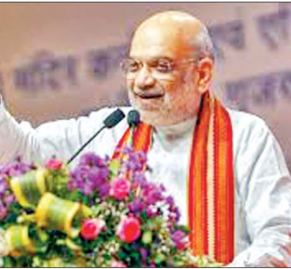
बाधा। उन्होंने कहा कि इससे लोगों, वस्तुओं और सेवाओं के परिवहन में वृद्धि होगी और असम के तेज आर्थिक विकास के लिए मोदी जी के दृष्टिकोण

कैबिनेट ने महंगाई भत्ता और महंगाई राहत में तीन प्रतिशत अतिरिक्त बढ़ोतरी को मंजूरी दी है। एक जुलाई 2025 से लागू होने वाले इस फैसले से करीब 49.19 लाख केंद्रीय कर्मचारी और 68.72 लाख पेंशनर्स लाभान्वित होंगे। शाह ने एक अन्य पोस्ट में कहा, असम के हमारे बहनों और भाइयों को 6,957 करोड़ रुपये की लागत से कल्याण-नुमालीगढ़ राजमार्ग के चार लेन के निर्माण को मंजूरी मिलने पर