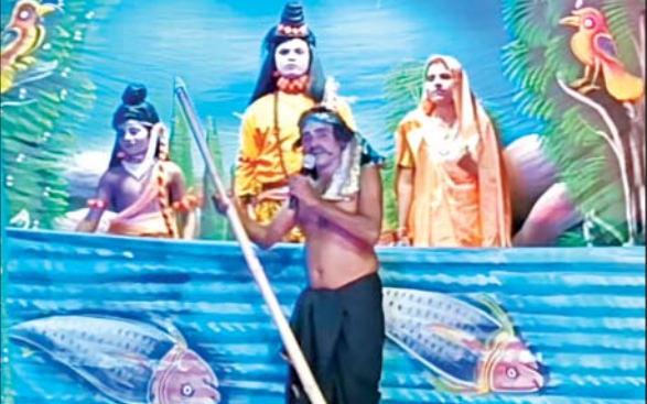
महोबा। पुराने रामलीला मैदान में श्री रामलीला न्यास महोबा एवं