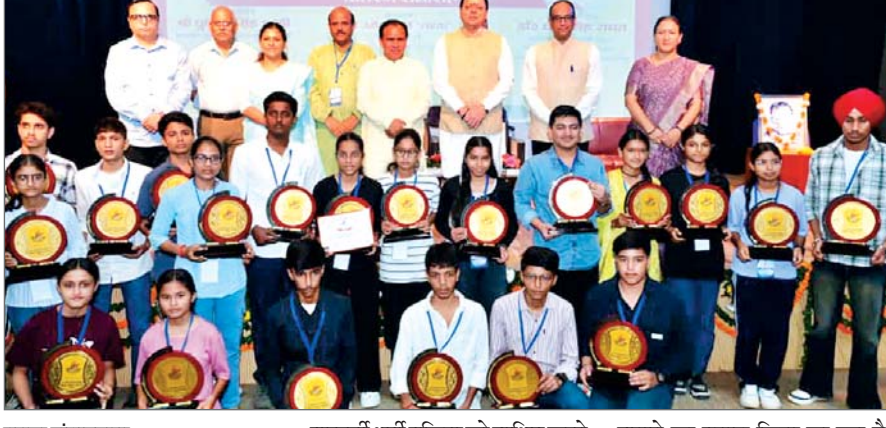
प्रमुख संवाददाता देहरादून। मुख्यमंत्री पुष्कर सिंह धामी ने पेपर लीक प्रकरण पर कड़ा रुख अपनाते हुए कहा कि राज्य की पारदर्शी भर्ती प्रक्रिया को बाधित करने के लिए सुनियोजित साजिश रची जा रही है। उन्होंने आरोप लगाया कि कुछ लोग युवाओं को सफलता से असहज हैं इसलिए अराजकता का माहौल बनाने का प्रयास किया जा रहा है। सीएम धामी ने नानुरखेड़ा स्थित एससीआईआरटी सभागार में आयोजित पंडित दीनदयाल उपाध्याय शैक्षिक उत्कृष्टता पुरस्कार ...शेष पृष्ठ 14 पर

एक शिकायत के आधार पर पूरे राज्य में भ्रम फैलाने का प्रयास : सीएम