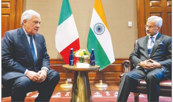
में अधिसंख्यक हैं। बुधवार को संयुक्त राष्ट्र महासभा सत्र के दौरान ऑब्जर्वर रिसर्च फाउंडेशन (ओआरएफ) द्वारा आयोजित कार्यक्रम एट द हार्ट ऑफ डेवलपमेंट एंड ट्रेड एंड टेक्नोलॉजी को संबोधित करते हुए विदेश मंत्री एस. जायशंकर ने एक ऐसे वैश्विक कार्यबल के निर्माण का आह्वान किया जो अधिक स्वीकार्य, समकालीन और कुशल हो जिसे फिर एक विकेन्द्रित, वैश्विक कार्यस्थल में स्थापित किया जा सके। उन्होंने कहा उस वैश्विक कार्यबल को कहाँ रखा जाए और उसकी तैनाती ...शेष पृष्ठ 14 पर

शानकाल में कर की लूट मची थी। उन्होंने कहा नये जीएसटी सुधारों से गरीब, नव मध्यम वर्ग, मध्यम वर्ग सब की बचत हुई है लेकिन इसके बावजूद रामलीला पर रोक संबंधी झूठ फैलाने का आदेश पलटा नयी दिल्ली। उच्चतम न्यायालय ने उत्तर प्रदेश के फिरोजाबाद जिले में स्कूल के मैदान में रामलीला उत्सव के आयोजन पर रोक संबंधी झूठहावाद उच्च न्यायालय के आदेश पर बृहस्पतिवार को रोक लगा दी। न्यायमूर्ति सूर्यकांत, न्यायमूर्ति उज्जल भुइयां और न्यायमूर्ति एन. कोटिश्वर सिंह की पीठ ने इस शर्त पर उत्सव जारी रखने की अनुमति दी कि इससे छात्रों को कोई असुविधा न हो। पीठ ने उच्च न्यायालय के आदेश के उस पैराग्राफ पर रोक लगाते हुए कहा, वैसे तो हम स्कूल के मैदान में धार्मिक उत्सव के आयोजन की अनुमति नहीं देते हैं, लेकिन यह रामलीला पिछले 100 वर्षों से चली आ रही है और इस वर्ष उत्सव 14 सितंबर से शुरू हुआ है। पीठ ने श्री नगर ...शेष पृष्ठ 14 पर