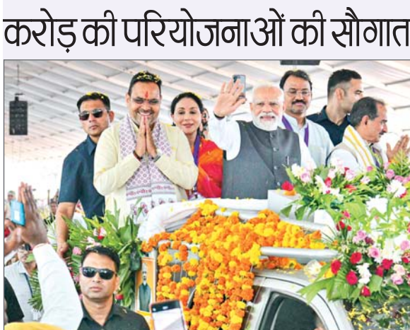
बांसावाड़ा। प्रधानमंत्री नरेन्द्र मोदी ने बृहस्पतिवार को राजस्थान के बांसावाड़ा में केंद्र एवं राज्य सरकार की 1,22,100 करोड़ रुपये से अधिक की लागत वाली कई विकास परियोजनाओं का शिलान्यास एवं उद्घाटन ...शेष पृष्ठ 14 पर

पीएम ने राजस्थान को 1.22 लाख करोड़ की परियोजनाओं की सौगात