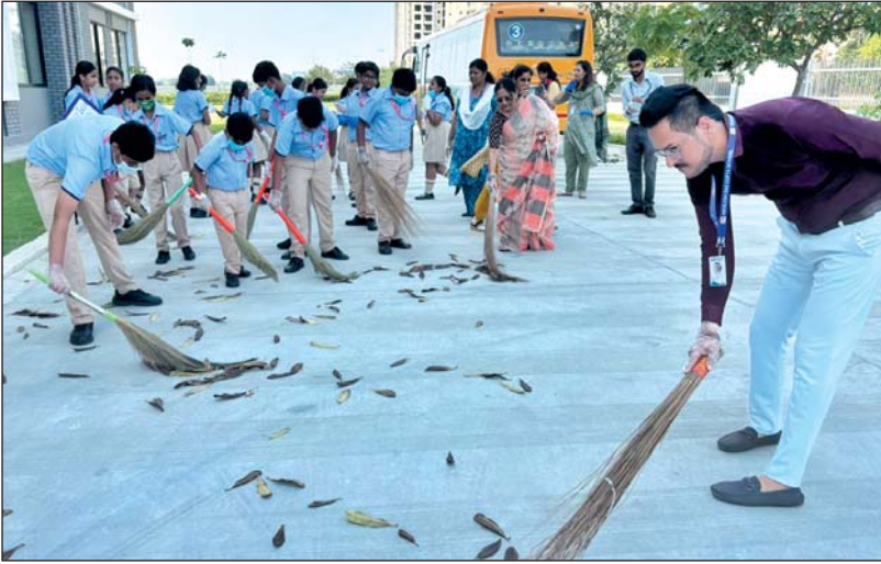
विशेष संवाददाता (vol) लखनऊ। अखिलेश दास गुप्ता विद्यालय में आज एक दिन, एक

घंटा, एक साथ अभियान के तहत राष्ट्रव्यापी विशेष स्वच्छता कार्यक्रम स्वच्छता ही सेवा 2025 का आयोजन किया गया।