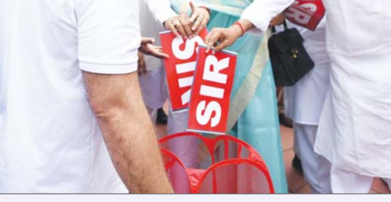
पीठ ने कहा बिहार एसआईआर में हमारा फैसला पूरे भारत में एसआईआर के लिए लागू होगा। इसने स्पष्ट किया कि वह निर्वाचन आयोग को देश भर में मतदाता सूची में संशोधन के लिए इसी तरह की प्रक्रिया करने से नहीं रोक

हालांकि कुछ प्रावधानों में कुछ संरक्षण की जरूरत है। पीठ ने स्पष्ट किया कि उसके निर्देश प्रथम दृष्टया और अंतिम प्रकृति के हैं और वे वास्तविकताओं या सरकार को अंतिम सुनवाई के स्तर पर