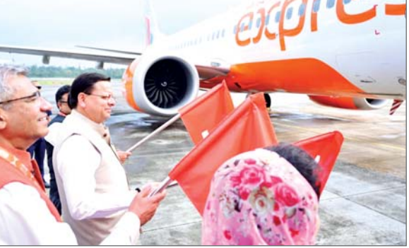
एक महत्वपूर्ण उपलब्धि है। बेंगलुरु से बेहतर कनेक्टिविटी से उत्तराखंड में पर्यटन, व्यापार और निवेश के अवसरों को काफी बढ़ावा मिलेगा। साथ ही भारत के सबसे गतिशील शहरों में से एक के साथ छात्रों, पेशेवरों और उद्यमियों के लिए संबंध भी मजबूत

इस अवसर पर मुख्यमंत्री पुष्कर सिंह धामी ने कहा कि देहरादून से एयर इंडिया एक्सप्रेस सेवाओं की शुरुआत हमारे राज्य में नागरिक उड्डयन के लिए