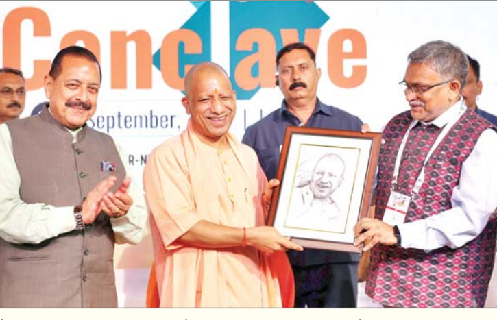
वैज्ञानिकों के विचारों को पंख दे रही है। सरकार हर योग्य स्टार्टअप के साथ खड़ी है। हम प्रयोगशाला से उद्योग तक युवाओं का साथ दे रहे हैं। मुख्यमंत्री ने कहा कि हर शोध उत्पाद बने, हर

लखनऊ। मुख्यमंत्री योगी आदित्यनाथ ने सोमवार को राजधानी लखनऊ में आयोजित सीएसआईआर स्टार्टअप कॉन्क्लेव के समापन समारोह में हिस्सा लिया। इस अवसर पर उन्होंने प्रदर्शनी में विभिन्न स्टार्टअप उत्पादों का अवलोकन किया और अपने संबोधन में उत्तर प्रदेश की उपलब्धियों और भविष्य की दिशा को सबके सामने रखा। मुख्यमंत्री ने कहा कि उत्तर प्रदेश ने बीते साढ़े आठ वर्षों में सुरक्षा का उत्कृष्ट वातावरण दिया है। फियरलेस बिजनेस का केंद्र उत्तर प्रदेश बन चुका है। ईज ऑफ डूइंग बिजनेस में भी यूपी आज अग्रणी है। अब टूट ऑफ डूइंग बिजनेस यूपी की नई पहचान है। व्यवसाय के लिए सुरक्षा, सुगमता और मजबूत इको सिस्टम जरूरी है और यह तीनों आज उत्तर प्रदेश में मौजूद हैं। उन्होंने कहा कि प्रदेश सरकार केवल नीतियां नहीं बना रही, बल्कि युवाओं, उद्यमियों और