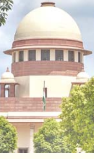
रिपोर्ट के आधार पर गैर-वक्फ नहीं माना जा सकता

केंद्रीय वक्फ परिषद में 20 में से चार से अधिक गैर-मुस्लिम सदस्य नहीं होने चाहिए, और राज्य वक्फ बोर्डों में 11 में से तीन से अधिक गैर-मुस्लिम सदस्य नहीं होने चाहिए। प्रधान न्यायाधीश ने