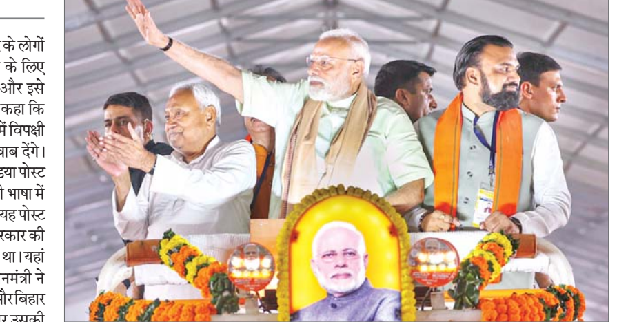
(राजद) और कांग्रेस पर उनके शासनकाल में कथित कुशासन के लिए निशाना साधा। प्रधानमंत्री नरेन्द्र मोदी ने बिहार के पूरुणिया जिले में लगभग 36,000 करोड़ रुपये की कई विकास परियोजनाओं की सोमवार को शुरुआत की। प्रधानमंत्री ने पूरुणिया हवाई अड्डे पर नवनिर्मित टर्मिनल ... शेष पृष्ठ 14 पर

पूरुणिया। प्रधानमंत्री नरेन्द्र मोदी ने बिहार के लोगों को तुलना कथित तौर पर बीड़ी से करने के लिए सोमवार को कांग्रेस की आलोचना की और इसे बिहारियों का अपमान कर दिया। उन्होंने कहा कि राज्य के लोग आगामी विधानसभा चुनावों में विपक्षी गठबंधन इंडिया के घटकों को करारा जवाब देंगे। कांग्रेस की केरल इकाई के एक सोशल मीडिया पोस्ट ने विवाद खड़ा कर दिया था, क्योंकि इसकी भाषा में बिहार को बीड़ी से जोड़ा गया था। हालांकि यह पोस्ट बाद में हटा दिया गया था। यह पोस्ट केंद्र सरकार की तंबाकू उत्पादों पर जीएसटी नीति पर लक्षित था। यहां एक जनसभा को संबोधित करते हुए प्रधानमंत्री ने दावा किया कांग्रेस नेता कहते हैं कि बीड़ी और बिहार का नाम बी से शुरू होता है। यह राज्य और उसकी जनता का सरासर अपमान है। वे आने वाले दिनों में कांग्रेस और उसके गठबंधन सहयोगियों को करारा जवाब देंगे। मोदी ने बिहार में राष्ट्रीय जनता दल