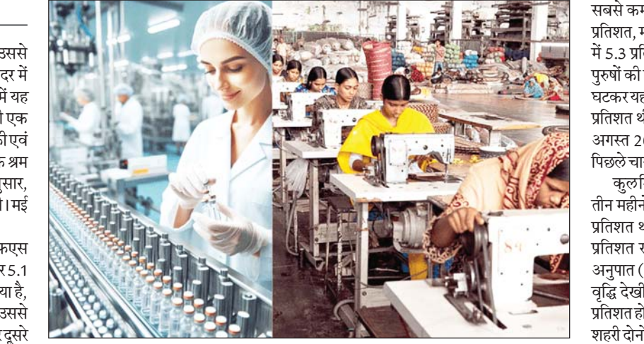
एकत्र किए गए नवीनतम आंकड़ों के अनुसार, अगस्त में 15 वर्ष और उससे अधिक आयु के व्यक्तियों के लिए बेरोजगारी दर 5.1 प्रतिशत रही। पुरुषों की बेरोजगारी दर अगस्त में पांच महीनों में

नयी दिल्ली। देश में 15 वर्ष और उससे अधिक आयु के व्यक्तियों की बेरोजगारी दर में लगातार दूसरे महीने कमी आई है। अगस्त में यह घटकर 5.1 प्रतिशत रही। सोमवार को जारी एक सरकारी सर्वेक्षण में यह कहा गया। सांख्यिकी एवं कार्यक्रम कार्यान्वयन मंत्रालय के आवधिक श्रम बल सर्वेक्षण (पीएलएफएस) के अनुसार, जुलाई में बेरोजगारी दर 5.2 प्रतिशत रही थी। मई और जून दोनों में यह 5.6 प्रतिशत थी।