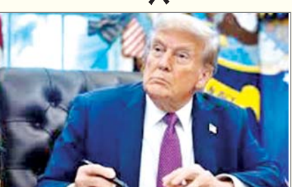
वीडियो जारी किए थे जिसे वे जिम्मेदार मानते हैं। किर्क को उस समय गोली मारी गई जब वह ओरेंग स्थित यूट वैली विश्वविद्यालय के एक प्रांगण में एकत्रित भीड़ को संबोधित कर रहे थे। अधिकारियों ने बताया कि 7,000 से अधिक सुराग और सूचनाएं प्राप्त हुई हैं। अधिकारियों ने अभी तक सार्वजनिक रूप से संदिग्ध का नाम नहीं बताया है और न ही इस हत्या के पीछे का कोई कारण बताया है। किर्क द्वारा सामाजिक मुद्दों पर भाषण देते समय दिनदहाड़े किए गए इस हमले के भयावह वीडियो सोशल मीडिया पर वायरल हुए हैं। वीडियो में किर्क, जिन्होंने युवा रिपब्लिकन मतदाताओं को एकजुट करने में अहम भूमिका निभाई थी, एक हाथ में माइक्रोफोन लेकर बोलते हुए दिखाई दे रहे हैं।

ओरेंग (अमेरिका)। अमेरिका के राष्ट्रपति डोनाल्ड ट्रंप ने शुक्रवार को कहा कि चार्ली किर्क हत्याकांड में संदिग्ध व्यक्ति को पकड़ लिया गया है। ट्रंप ने शुक्रवार सुबह फॉक्स न्यूज चैनल पर प्रसारित एक साक्षात्कार के दौरान घोषणा करते हुए कहा, अति यकीन के साथ, हमने उसे पकड़ लिया है। ट्रंप ने कहा कि एक मंत्री, जो कानून प्रवर्तन से जुड़े हैं, ने संदिग्ध को अधिकारियों के हवाले कर दिया है। ट्रंप ने कहा, उसके एक बेहद करीबी व्यक्ति ने कहा, यह वही है। किर्क की बुधवार को केवल एक गोली मारकर हत्या कर दी गई, जिसके बारे में पुलिस ने कहा कि यह एक लक्षित हमला था और यूट के गवर्नर ने इसे राजनीतिक हत्या बताया। किर्क गैर-लाभकारी राजनीतिक संगठन टर्नम पॉइंट यूएसए के सह-संस्थापक थे और ट्रंप के करीबी सहयोगी थे। अधिकारियों ने घटनास्थल के पास से एक उच्च-शक्ति वाली राइफल बरामद की थी और कहा था कि गोलीबारी के बाद शूटर छत से कूदकर जंगल की ओर भाग गया। गोलीबारी के समय किर्क यूट वैली विश्वविद्यालय में टर्नम पॉइंट द्वारा आयोजित एक परिचर्चा में बोल रहे थे। उन्हें स्थानीय अस्पताल ले जाया गया जहां कुछ घंटों बाद उन्हें मृत घोषित कर दिया गया। संघीय जांचकर्ताओं और राज्य के अधिकारियों ने बृहस्पतिवार को उस व्यक्ति की तस्वीरें और