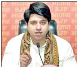
कायंकारी राष्ट्रीय अध्यक्ष और राज्यसभा सांसद संजय झा ने एआई-जनरेटेड वीडियो पर तीखी प्रतिक्रिया दी है। उन्होंने एक्स पर लिखा कि इस तरह का वीडियो साझा करना बेहद नीच हरकत है। उनके अनुसार, कांग्रेस ने यह साफ कर दिया है कि दरभंगा में मंच से प्रधानमंत्री की मां को गाली देना कोई गलती नहीं, बल्कि सोची-समझी रणनीति थी। यह सिर्फ एक मां का नहीं, बल्कि हर मां और महिला का अपमान है।

पटना। प्रधानमंत्री नरेन्द्र मोदी की दिवंगत मां से जुड़ा एक एआई-जनरेटेड वीडियो बिहार कांग्रेस इकाई द्वारा सोशल मीडिया एक्स पर साझा किए जाने को लेकर भाजपा ने कड़ी आपत्ति जताई है। भाजपा प्रवक्ता शहजाद पूनावाली ने कहा कि कांग्रेस ने घटिया राजनीति की सारी सीमाएं लंघन की हैं। उन्होंने आरोप लगाया कि कांग्रेस न सिर्फ इस वीडियो का बचाव कर रही है बल्कि प्रधानमंत्री की मां और मातृशक्ति का अपमान करना उसकी आदत बन गई है। भाजपा ने कहा कि यह पार्टी गांधीवादी की बजाय गालीवादी बन गई है और महिला एवं मातृ शक्ति का अपमान कांग्रेस की पहचान है। वरिष्ठ भाजपा नेता अनुराग ठाकुर ने भी कांग्रेस और राजद पर हमला बोला। उन्होंने कहा कि किसी की दिवंगत मां का मजाक उड़ाना राजनीति की गिरावट का उदाहरण है। ठाकुर ने कहा कि बिहार की जनता इस अपमान को कभी बर्दाश्त नहीं करेगी और