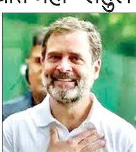
सांसद ने इस आशांत पूर्वोत्तर राज्य के उनके दौर को ज्यादा महत्व नहीं देने की कोशिश की। गांधी ने कहा, मणिपुर लंबे समय से संकट से जूझ रहा है और प्रधानमंत्री ने अब वहां जाने का फैसला किया है। इसलिए यह कोई बड़ी बात नहीं है। आज भारत में प्रमुख मुद्दा चोट चोरी है। मोदी 13 सितंबर को मणिपुर का दौरा करेंगे और चुराचंदपुर तथा राज्य की राजधानी इंफाल में आंतरिक रूप से विस्थापित लोगों से बातचीत करेंगे।

जूनागढ़। कांग्रेस नेता राहुल गांधी ने शुक्रवार को कहा कि मणिपुर लंबे समय से संकट से जूझ रहा है और प्रधानमंत्री नरेन्द्र मोदी का इस हिंसाग्रस्त राज्य का अब दौरा करना कोई बड़ी बात नहीं है। उन्होंने जोर देकर कहा कि चोट चोरी फिलहाल देश के सामने सबसे प्रमुख मुद्दा बना हुआ है। गुजरात के जूनागढ़ जिले में केशोद हवाई अड्डे के बाहर पत्रकारों से बात करते हुए लोकसभा में नेता प्रतिपक्ष राहुल गांधी ने दावा किया कि हर जगह लोग चोट चोर के नारे लगा रहे हैं। हवाई अड्डे पर दोपहर में उतरने के बाद गांधी जूनागढ़ शहर पहुंचे, जहां उनका गुजरात कांग्रेस की जिला और नगर इकाइयों के अध्यक्षों को संबोधित करने और वरिष्ठ नेताओं के साथ बातचीत करने का कार्यक्रम है। जब पत्रकारों ने प्रधानमंत्री मोदी की मणिपुर यात्रा पर गांधी की प्रतिक्रिया जाननी चाही, तो कांग्रेस