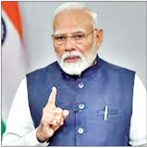
आंतरिक रूप से विस्थापित लोगों से बातचीत करेंगे तथा दो रैलियों को संबोधित करेंगे। दोपहर करीब 12.15 बजे चूड़ाचंदपुर पहुंचने पर वह सबसे पहले जिले के आंतरिक रूप से विस्थापित कुछ व्यक्तियों (आईडीपी) से बातचीत करेंगे। वह राज्य भर में शुरू की जाने वाली