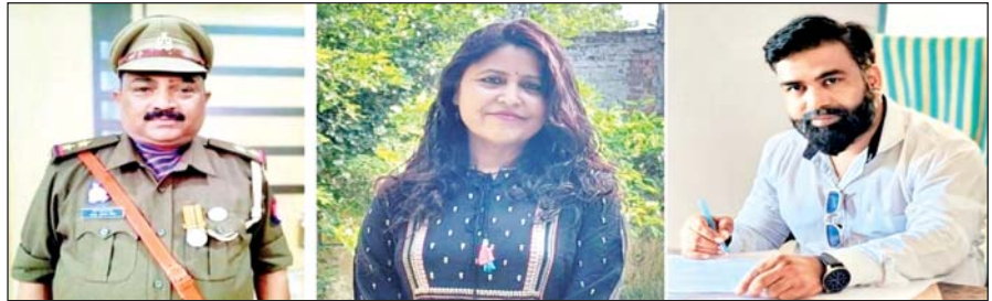
जिला संवाददाता (VOL)

उन्नाव। नव अंशिका फाउंडेशन के छठवें स्थापना दिवस के अवसर पर सीजन-2 गोल्डन गाला अवार्ड 2025 का आयोजन लखनऊ के विराज खंड स्थित होटल क्लासिक्स कलेक्शन में किया जा रहा है। इस समारोह में विभिन्न क्षेत्रों में उल्लेखनीय कार्य के लिए संस्था द्वारा गोल्डन गाला अवार्ड एवं नव अंशिका प्राइड अवार्ड दिया जाएगा।