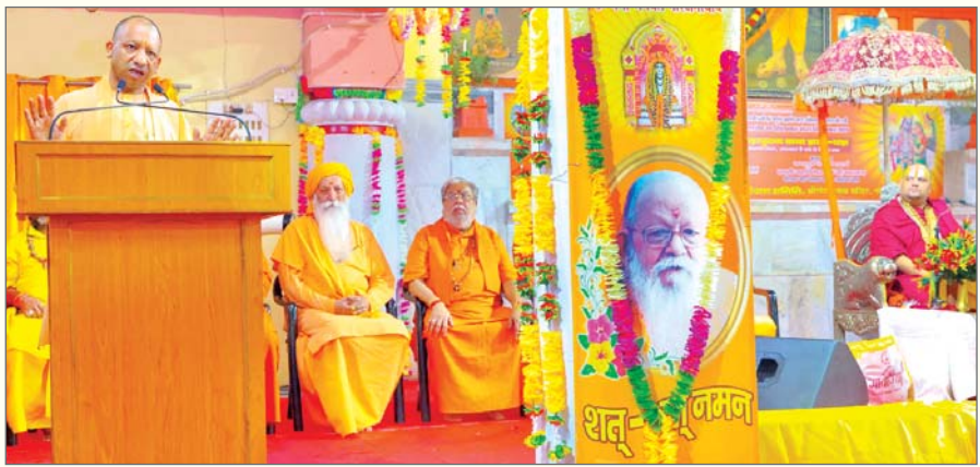
भारतीयता संदिग्ध है। मुख्यमंत्री ने गोरेखनाथ मंदिर परिसर में महंत दिग्विजयनाथ की 56वीं और महंत अवेद्यनाथ की 11वीं पुण्यतिथि के अवसर पर आयोजित श्रद्धांजलि समारोह को सम्बोधित करते हुए कहा आज ऐसा कौन भारतीय होगा जिसे अयोध्या में श्रीराम जन्मभूमि पर भव्य मंदिर देखकर गर्व न होता हो। कोई ऐसा होगा तो उसका भारतीय होने पर ही संदेह होगा। उन्होंने कहा कि महंत दिग्विजयनाथ जी ने गुलामी के प्रतीकों का हटाने का संकल्प लिया था। अयोध्या में गुलामी की निशानी ढांचे को हटकर भव्य श्रीराम मंदिर बनाना

जिला संवाददाता गोरेखपुर। मुख्यमंत्री योगी आदित्यनाथ ने बुधवार को कहा कि विकसित भारत के केवल राजनीतिक संकल्प नहीं है बल्कि यह भारत और भारतीयता का मंत्र है। वसुधैव कुटुम्बकम की दृष्टि से कभी भारत ने दुनिया को अपनी ताकत का एहसास कराया था। कोई आपस में लड़ें, न यह भारत की परंपरा है। ऐसा फिर से हो, इसके लिए विकसित और आत्मनिर्भर भारत की आवश्यकता है। इसलिए, हर भारतीय को विकसित भारत के संकल्प से जुड़ना होगा। जब संकल्प अंतःकरण से होता है तो वह अवश्य पूरा होता है। उन्होंने कहा कि अयोध्या में भव्य श्री राम मंदिर को देखकर गर्व महसूस नहीं करने वाले भारतवासी की