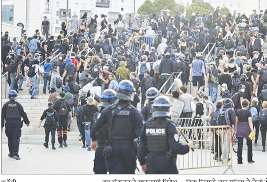
पेरिस। फ्रांस में प्रधानमंत्री फ्रांस्वा बायरू की सरकार गिरने के एक दिन बाद राजधानी पेरिस और अन्य स्थानों पर प्रदर्शनकारियों ने सड़कें अवरुद्ध कर दीं, आगजनी की और पुलिस ने उन पर आंसू गैस के गोले दागे। गुह मंत्रालय ने राष्ट्रव्यापी विरोध प्रदर्शन के शुरुआती घंटों में लगभग 250 लोगों की गिरफ्तारी की घोषणा की। विरोध प्रदर्शन हालांकि ऑनलाइन शुरू हुआ था, लेकिन बाद में यह तीव्र होता गया और 80,000 पुलिसकर्मियों को तैनाती को चुनौती देते हुए प्रदर्शनकारियों ने अवरोधकों को तोड़ दिया जिसके बाद पुलिस ने तेजी से गिरफ्तारियां कीं। गुह मंत्री ब्रुनो रिट्टेल ने कहा कि पश्चिमी शहर रेंनेस में एक बस में आग लगा दी गई और दक्षिण-पश्चिम में एक बिजली लाइन को नुकसान पहुंचने से रेलगाड़ियां बाधित हुईं। उन्होंने आरोप लगाया कि प्रदर्शनकारी ... शेष पृष्ठ 14 पर

○ राजधानी पेरिस व अन्य शहरों में झड़प ○ 250 से अधिक गिरफ्तार