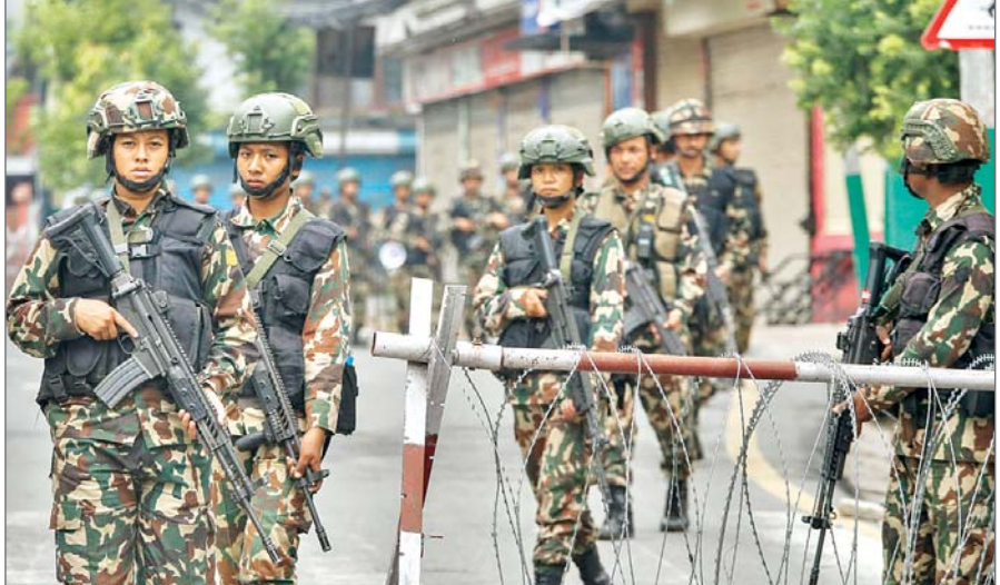
को घर पर ही रहने का आदेश दिया जिससे नेपाल की राजधानी काठमांडू में सन्नाटा पसर रहा। इससे एक दिन पहले प्रदर्शनकारियों ने संसद भवन, राष्ट्रपति कार्यालय, प्रधानमंत्री आवास, सरकारी भवनों, सुप्रीम कोर्ट, राजनीतिक दलों के कार्यालयों और वरिष्ठ नेताओं के घरों में आग लगा दी थी। सेना ने कहा कि प्रदर्शनों की आड़ में लूटपाट, आगजनी और अन्य विनाशकारी गतिविधियों की संभावित घटनाओं को रोकने के लिए ये कदम जरूरी हैं। सेना ने चेतावनी दी कि प्रतिबंधात्मक अवधि के दौरान किसी भी प्रकार के प्रदर्शन, तोड़फोड़, आगजनी या व्यक्तिगत और संपत्ति पर हमले को अपराधिक कृत्य माना जाएगा और उचित तरीके से उससे निपटा जाएगा।

एजेंसी काठमांडू। नेपाल की सेना ने सरकार विरोधी प्रदर्शनों के कारण के पीछे आली के प्रधानमंत्री पद से इस्तीफा देने के एक दिन बाद बुधवार को विरोध प्रदर्शनों की आड़ में संभावित हिंसा को रोकने के लिए देशव्यापी प्रतिबंधात्मक आदेश लागू कर दिए और कर्फ्यू लगा दिया है। वहीं नेपाल में जबरदस्त विरोध प्रदर्शनों के मद्देनजर राष्ट्रव्यापी प्रतिबंधात्मक आदेश और कर्फ्यू लगाए जाने के बीच भारत के कई राज्यों ने हिंसा प्रभावित देश में फंसे अपने निवासियों की सहायता के लिए विशेष प्रकोष्ठ गठित किए हैं और सीमा पर निगरानी बढ़ा दी गई है।