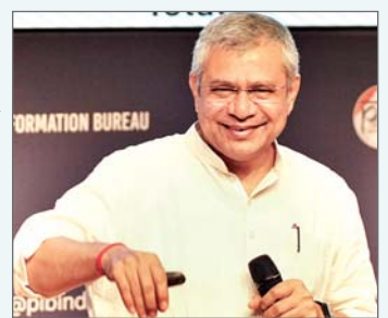
गोरेखपुर। मुख्यमंत्री योगी आदित्यनाथ ने बुधवार को कहा कि विकसित भारत के केवल राजनीतिक संकल्प नहीं है बल्कि यह भारत और भारतीयता का मंत्र है। वसुधैव कुटुम्बकम की दृष्टि से कभी भारत ने दुनिया को अपनी ताकत का एहसास कराया था। कोई आपस में लड़ें, न यह भारत की परंपरा है। ऐसा फिर से हो, इसके लिए विकसित और आत्मनिर्भर भारत की आवश्यकता है। इसलिए, हर भारतीय को विकसित भारत के संकल्प से जुड़ना होगा। जब संकल्प अंतःकरण से होता है तो वह अवश्य पूरा होता है। उन्होंने कहा कि अयोध्या में भव्य श्री राम मंदिर को देखकर गर्व महसूस नहीं करने वाले भारतवासी की

नयी दिल्ली। आर्थिक मामलों की मंत्रिमंडल समिति ने बुधवार को बिहार, झारखंड और पश्चिम बंगाल में 3,169 करोड़ रुपये की लागत से 177 किलोमीटर लंबे भागलपुर-दुमका-रामपुरहाट एकल रेलवे लाइन खंड के दोहरीकरण को मंजूरी दे दी। बिहार में इस साल के अंत में विधानसभा चुनाव होने हैं। इस समिति की अध्यक्षता प्रधानमंत्री नरेन्द्र मोदी ने की। वहीं एक अन्य निर्णय में केंद्र सरकार ने बिहार में बक्सर-भागलपुर उच्च गति गलियारे के चार लेन वाले मोकामा-मुंगेर खंड के निर्माण को मंजूरी दी जिस पर कुल 4,447.38 करोड़ रुपये की लागत आएगी। केंद्रीय मंत्रिमंडल की आर्थिक मामलों की समिति (सीसीईए) की बैठक में यह निर्णय लिया गया। बैठक की अध्यक्षता प्रधानमंत्री नरेन्द्र मोदी ने की। इस सड़क निर्माण परियोजना