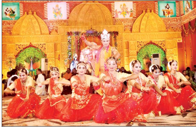
गणेश उत्सव में लोकनृत्य प्रस्तुत करते कलाकार