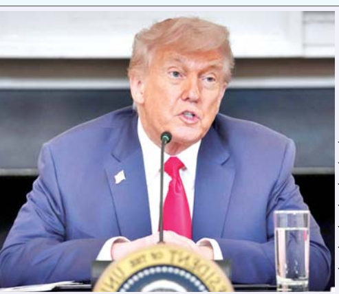
व्हाइट हाउस के व्यापार सलहकार पीटर नवरोस सहित ट्रंप प्रशासन के कई अधिकारियों ने भारत पर निशाना साधने के लिए आपत्तिजनक भाषा का इस्तेमाल किया है। हालांकि, सोमवार को एससीओ शिखर सम्मेलन का

अमेरिका के राष्ट्रपति ने ट्रंप सोशल पर लिखा लगाता है हमने भारत और रूस को चीन के हाथों खो दिया है। साथ में उनका भविष्य दीर्घकालिक और समृद्ध हो। ट्रंप द्वारा भारतीय वस्तुओं पर शुल्क को दोगुना करके 50 प्रतिशत कर दिए जाने के बाद नयी दिल्ली और वाशिंगटन के बीच संबंधों में खटास आ गई है, जिसमें रूसी कच्चे तेल की खरीद को लेकर भारत पर 25 प्रतिशत अतिरिक्त शुल्क भी शामिल है। अतिरिक्त शुल्क 27 अगस्त से लागू हो चुका है। भारत ने अमेरिकी कार्वाइ को अनूचित और अविश्वेकपूर्ण बताया है और ऐसे किये जाने को लेकर आश्चर्य जताया है। हैरानी की बात है कि अमेरिका ने रूसी कच्चे तेल के सबसे बड़े आयातक चीन पर कोई दंडात्मक कार्वाइ नहीं की है। पिछले कुछ दिनों में,