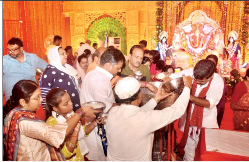
बप्पा की पूजा-अर्चना करते भक्तगण