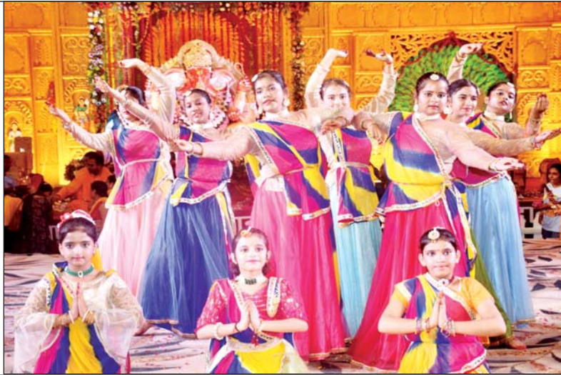
लोकनृत्य प्रस्तुत करती युवतियां