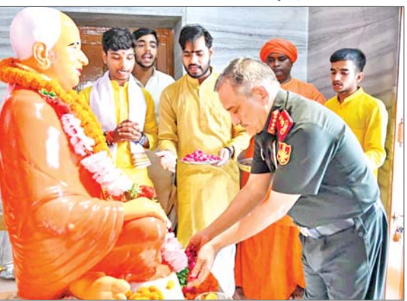
गया। भारतीय सेनाओं ने हर बार दुश्मन को सरप्राइज कर अपना टारगेट पूरा किया। उन्होंने कहा कि राष्ट्र की सुरक्षा के लिए भारतीय सेनाएं 365 दिन, 247 के फामूलों पर

जिला संवाददाता गोरखपुर। गोरक्षपीठ के ब्रह्मलीन महंत दिव्यजय नाथ और ब्रह्मलीन महंत अवेद्यनाथ की पुण्यतिथि पर आयोजित भारत के समक्ष राष्ट्रीय सुरक्षा की चुनौतियां विषयक संगोष्ठी के मुख्य अतिथि चीफ ऑफ डिफेंस स्टाफ (सीडीएस) अनिल चौहान ने कहा कि युद्ध में सफलता हासिल करने के लिए सरप्राइज (अचरज) एक महत्वपूर्ण फैक्टर होता है। उरी सर्जिकल स्ट्राइक में भारत ने जमीन के रास्ते जाकर आतंकी ठिकानों को बर्बाद किया, बालाकोट में एयर स्ट्राइक का सहारा लिया गया। जबकि पहलूगाम हमले के बाद लो एयर स्पेस, ड्रोन का इस्तेमाल किया