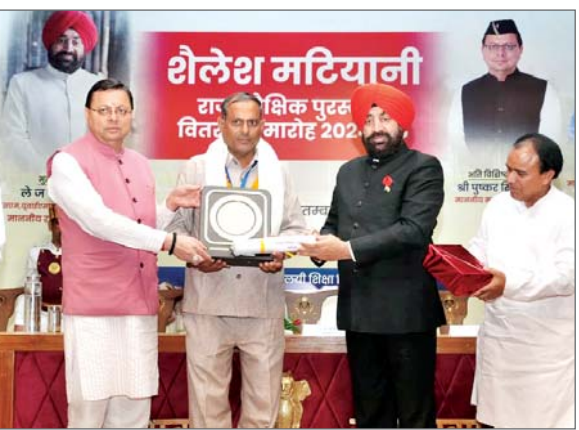
जीवन मूल्यों के निर्माता होते हैं। उन्होंने आह्वान किया कि शिक्षा को केवल रोजगार तक सीमित न रखकर छात्रों को जिम्मेदार, संस्कारवान और राष्ट्रनिष्ठ नागरिक बनाने की दिशा में