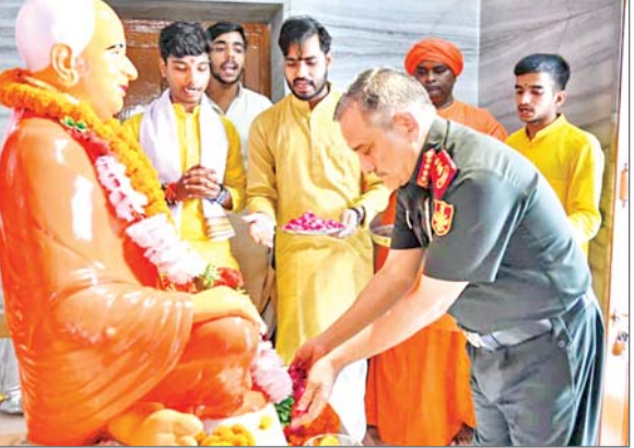
गया। भारतीय सेनाओं ने हर बार दुश्मन को सरप्राइज कर अपना टारगेट पूरा किया। उन्होंने कहा कि राष्ट्र की सुरक्षा के लिए भारतीय सेनाएं 365 दिन, 247 के फामूलों पर