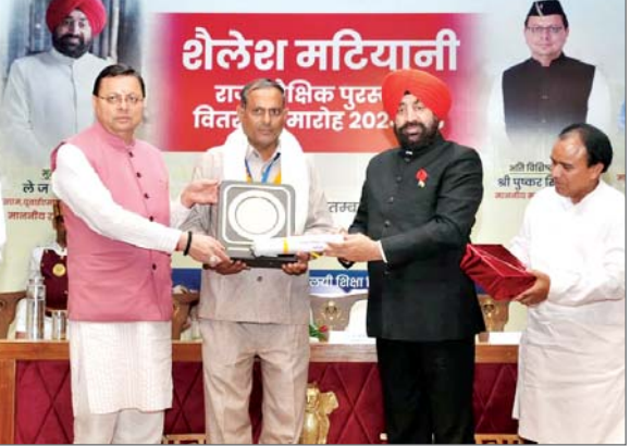
जीवन मूल्यों के निर्माता होते हैं। उन्होंने आह्वान किया कि शिक्षा को केवल रोजगार तक सीमित न रखकर छात्रों को जिम्मेदार, संस्कारवान और राष्ट्रनिष्ठ नागरिक बनाने की दिशा में