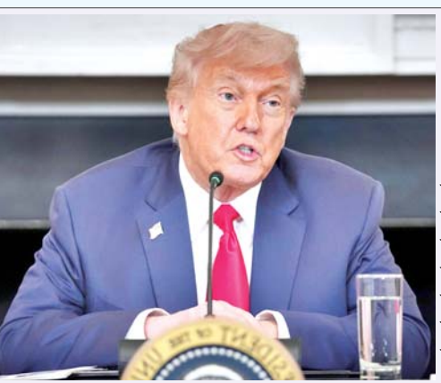
व्लाइट हाउस के व्यापार सलहकार पीटर नवरोस सहित ट्रंप प्रशासन के कई अधिकारियों ने भारत पर निशाना साधने के लिए आपत्तिजनक भाषा का इस्तेमाल किया है। हालांकि, सोमवार को एससीओ शिखर सम्मेलन का

अमेरिका के राष्ट्रपति ने ट्रंप सोशल पर लिखा लगाता है हमने भारत और रूस को चीन के हाथों खो दिया है। साथ में उनका भविष्य दीर्घकालिक और समृद्ध हो। ट्रंप द्वारा भारतीय वस्तुओं पर शुल्क को दोगुना करके 50 प्रतिशत कर दिए जाने के बाद नयी दिल्ली और वाशिंगटन के बीच संबंधों में खटास आ गई है, जिसमें रूसी कच्चे तेल की खरीद को लेकर भारत पर 25 प्रतिशत अतिरिक्त शुल्क भी शामिल है। अतिरिक्त शुल्क 27 अगस्त से लागू हो चुका है। भारत ने अमेरिकी कार्वाइ को अनुचित और अविश्वसनीय बताया है और ऐसे किये जाने को लेकर आश्चर्य जताया है। हैरानी की बात है कि अमेरिका ने रूसी कच्चे तेल के सबसे बड़े आयातक चीन पर कोई दंडात्मक कार्वाइ नहीं की है। पिछले कुछ दिनों में,