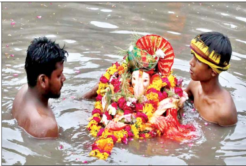
गोमती में मूर्ति का विसर्जन करते श्रद्धालु