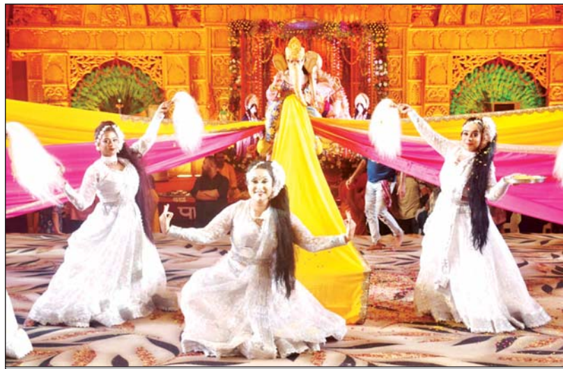
पूजा पंडाल में नृत्य नाटिका प्रस्तुत करते कलाकार