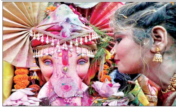
इस पत्र को अंतिम दिन गणेश भगवान के साथ ही विसर्जित कर दिया जाता है। चिड़्डी, पेन और बॉक्स लखनऊ के सबसे ऊंचे और महंगे