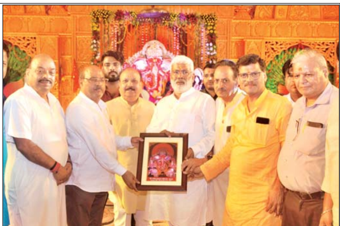
गणपति बप्पा मोरया अगले बरस तू जल्दी आ...