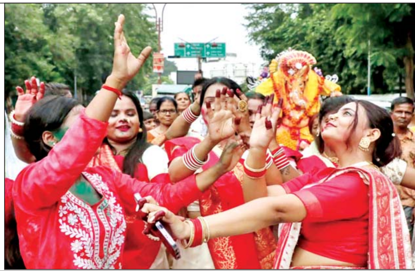
विसर्जन यात्रा में नृत्य करती महिलाएं