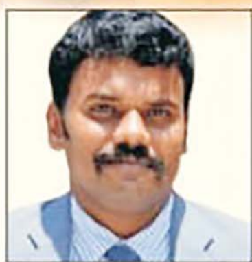
डा. राजा गणपति आर जिलाधिकारी

के शुभ अवसर पर नगरवासियों को हार्दिक शुभकामनाएं