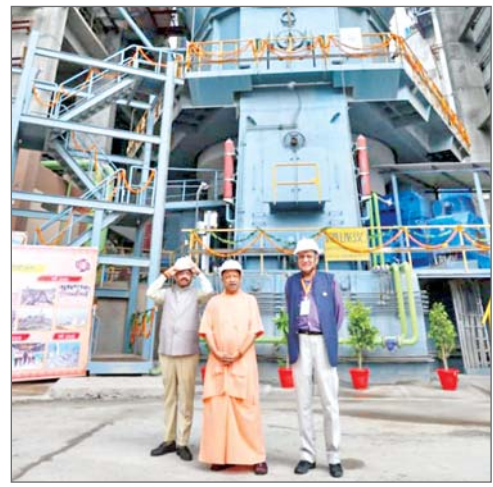
मुख्यमंत्री योगी आदित्यनाथ ने एटा में नये सीमेंट संयंत्र का किया उद्घाटन सबका विकास के दृष्टिकोण के अनुरूप नहीं रही है। इन दलों के संकीर्ण दृष्टिकोण के कारण ये लोग सिर्फ ...शेष पृष्ठ 14 पर

सिर्फ अपने परिवार का करते रहे विकास देश और प्रदेश के सामने पैदा कर दिया पहचान का संकट जिला संवाददाता एटा। मुख्यमंत्री योगी आदित्यनाथ ने बृहस्पतिवार को कांग्रेस और समाजवादी पार्टी पर निशाना साधते हुए कहा कि मुगलों और अंग्रेजों द्वारा देश को लूटे जाने के बाद जो कुछ बचा उसे इन दोनों दलों ने अपनी झोलियों में भर लिया। आदित्यनाथ ने एटा में एक नए सीमेंट संयंत्र का उद्घाटन करने के बाद अपने संबोधन में कहा कि 1947 में इस देश को आजादी मिली। वर्ष 1947 से 1960 तक भारत दुनिया की छठी अर्थव्यवस्था था। उससे पहले की बात करें तो 17वीं और 18वीं शताब्दी में यह देश दुनिया की नंबर एक अर्थव्यवस्था वाला देश था। मुख्यमंत्री ने कहा कि पहले मुगलों ने लूटा, फिर अंग्रेजों ने विनाश किया और मुगलों व अंग्रेजों के बाद जो कुछ बचा वह कांग्रेस और समाजवादी पार्टी ने लूट लिया। देश व प्रदेश के सामने पहचान का संकट पैदा कर दिया। मुख्यमंत्री ने केन्द्र और प्रदेश की पिछली सरकारों की आलोचना करते हुए कांग्रेस और सपा पर निशाना साधा और उन पर संकीर्ण मानसिकता रखने व अराजकता का माहौल बनाने का आरोप लगाया। योगी आदित्यनाथ ने कहा कि चाहे कांग्रेस हो या समाजवादी पार्टी, दोनों की मानसिकता प्रधानमंत्री नरेन्द्र मोदी के सबका साथ,