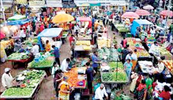
(डब्ल्यूपीओई) आधारित मुद्रास्फीति जून में शून्य से नीचे 0.13 प्रतिशत और

विशेषज्ञों ने हालांकि अनुमान लगाया है कि अगस्त में थोक मूल्य सूचकांक आधारित मुद्रास्फीति बढ़ सकती है क्योंकि आधार प्रभाव कम हो जाएगा और मौसमी मूल्य वृद्धि जारी रहेगी। थोक मूल्य सूचकांक