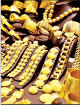
सोना टूटकर 101,020 रुपये प्रति 10 ग्राम पर

विदेशी बाजारों में हाजिर सोना न्यूयॉर्क में 10.79 डॉलर यानी 0.32 प्रतिशत बढ़कर 3,358.99 डॉलर प्रति औंस पर पहुंच गया। हाजिर सोना 3,350 डॉलर प्रति औंस के आसपास स्थिर रहा।मौद्रिक नीति के भविष्य के बारे में