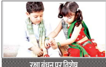
रक्षा बंधन पर विशेष

है, जहां बिना किसी कानूनी बाध्याता के प्रेम और कर्तव्य का बंधन होता है। रक्षाबंधन का त्योहार त्याग और समर्पण का भी प्रतीक है। रक्षाबंधन का धागा रिश्तों का इंद्रधनुष है। इसका हमारे वास्तविक जीवन