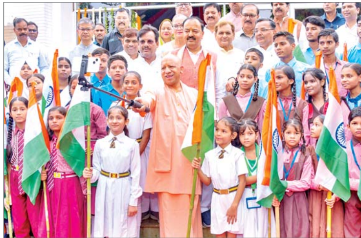
कि आजादी का यह संदेश हम सबको इस उद्देश्य के साथ आगे बढ़ाने के लिए प्रेरित कर रहा है। इस अवसर पर मुख्यमंत्री योगी आदित्यनाथ ने काकोरी ट्रेन एक्शन में शहीद हुए देश के सपूतों को नमन किया और उन्हें श्रद्धांजलि अर्पित की। उन्होंने कार्यक्रम स्थल

विशेष संवाददाता लखनऊ। मुख्यमंत्री योगी आदित्यनाथ ने शुक्रवार को काकोरी ट्रेन एक्शन शताब्दी समारोह के समापन पर देश की स्वतंत्रता के लिए बलिदान देने वाले क्रांतिकारियों को श्रद्धांजलि अर्पित किया। समारोह को सम्बोधित करते हुए उन्होंने लोगों से स्वदेशी चीजों का उपयोग करने की अपील की। उन्होंने कहा कि भले ही महंगी ही मिलें लेकिन आने वाले त्योहारों में स्वदेशी चीजें ही खरीदें (वर्तमान पीढ़ी से राष्ट्रभक्ति और स्वदेशी अपनाने का आह्वान किया। उन्होंने कहा कि स्वदेशी हमारे जीवन का ध्येय बने, स्वदेशी हमारे जीवन का मंत्र बने, हम जियेंगे स्वदेशी के लिए, हम मरेंगे अपने देश के लिए। अपनी राष्ट्रभक्ति की इस पराकाष्ठा के साथ जब भारत आगे बढ़ेगा तो दुनिया का कोई ताकत भारत का बाल भी बांका नहीं कर पाएगी। उन्होंने कहा