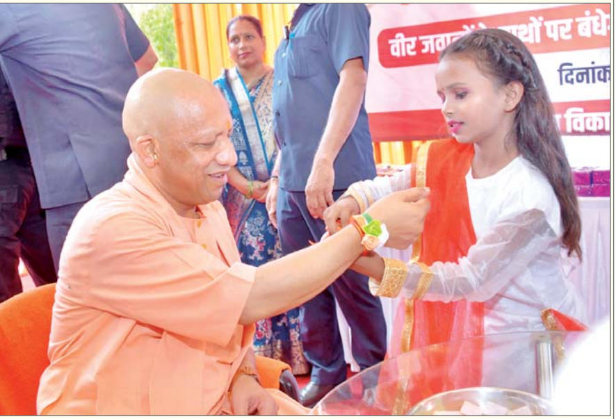
रक्षाबंधन के अवसर पर बच्ची से राखी बंधवाते मुख्यमंत्री योगी आदित्यनाथ