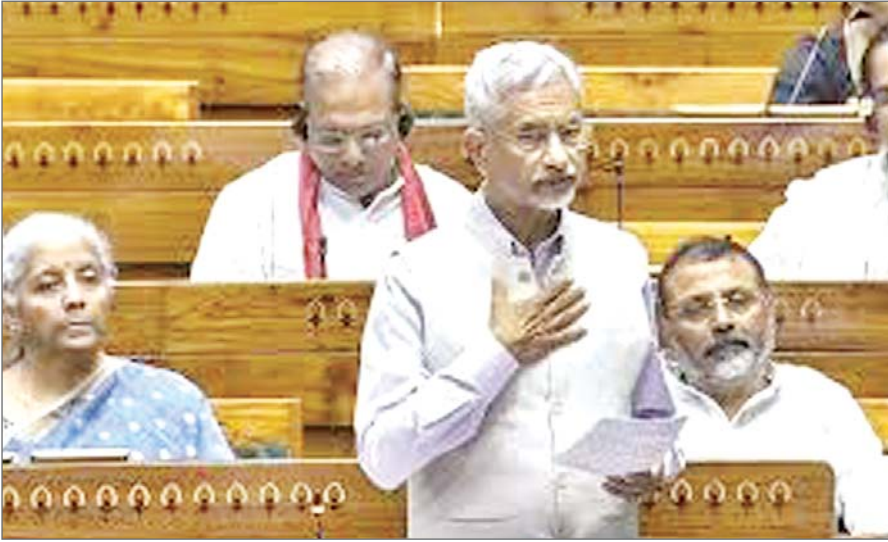
और ईरान से भारत के पेट्रोलियम आयात पर प्रतिबंधों के प्रभाव के बारे में अमेरिका जैसे देशों के साथ चिंता व्यक्त की है। पिछले हफ्ते अमेरिकी राष्ट्रपति डोनाल्ड ट्रंप ने भारत पर 25 प्रतिशत पारस्परिक

नयी दिल्ली। सरकार ने शुक्रवार को कहा कि वह ऊर्जा सुरक्षा को अपनी सर्वोच्च प्राथमिकताओं में से एक मानती है और लोगों को किफायती ऊर्जा उपलब्ध हो, इसके लिए उसने सभी आवश्यक कदम उठाए हैं। विदेश मंत्री एस जयशंकर ने लोकसभा में एक प्रश्न के लिखित उत्तर में कहा कि सरकार एक बहुआयामी रणनीति अपना रही है जिसमें आपूर्ति स्रोतों में विविधता लाना, तेल और गैस का घरेलू उत्पादन बढ़ाना, वैकल्पिक ऊर्जा स्रोतों को अपनाने का विस्तार करना और ऊर्जा परिवर्तन को आगे बढ़ाना शामिल है। उनसे वैश्विक तनाव के बीच देश के सामरिक और ऊर्जा हितों की रक्षा के लिए सरकार द्वारा उठाए गए कदमों का विवरण पूछा गया था, और यह प्रश्न भी किया गया कि क्या सरकार ने रूस