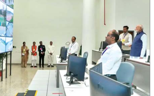
देशभर में बुनियादी ढांचे के पुनरुद्धार के लिए समय दृष्टिकोण के साथ काम कर रही है। उन्होंने इस बात पर जोर दिया कि भारत ने पिछले 11 वर्षों में एक ऐसा

प्रधानमंत्री नरेंद्र मोदी ने किया कर्तव्य भवन का उद्घाटन