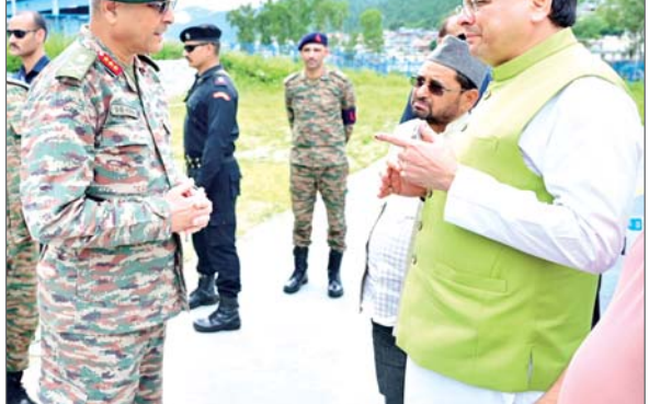
चुनौतियों के बावजूद ग्राउंड जीरो पर पहुंचकर आपदा प्रस्त क्षेत्र का दौरा कर पीड़ितों से मुलाकात की है। सीएम धामी रेस्क्यू ऑपरेशन की सीधी