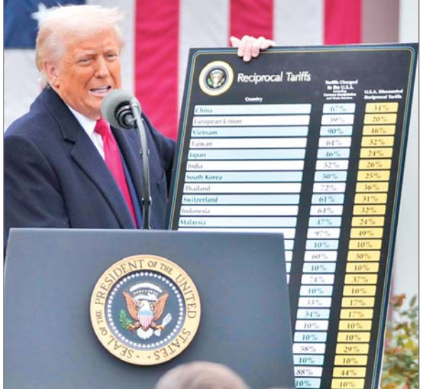
कि यूक्रेन के खिलाफ युद्ध में रूस इस तेल बिक्री से हासिल राशि का इस्तेमाल कर रहा है जबकि भारत सस्ता तेल पाने के लिए इस पहलू पर ध्यान नहीं दे रहा है। ट्रंप ने 30 जुलाई को भारतीय उत्पादों पर 25 प्रतिशत शुल्क की घोषणा करते समय भी कहा था कि वह रूस से तेल एवं गैस खरीदने की वजह से भारत पर अलग से जुर्माना लगाएंगे। अमेरिकी राष्ट्रपति डोनाल्ड ट्रंप ने भारत पर अब 50 फीसदी टैरिफ लगा दिया है। राष्ट्रपति ट्रंप ने भारत द्वारा

एजेंसी वाशिंगटन। अमेरिकी राष्ट्रपति डोनाल्ड ट्रंप ने रूस से तेल खरीद जारी रखने पर बुधवार को भारतीय वस्तुओं पर अतिरिक्त 25 प्रतिशत शुल्क लगाने के कार्यकारी आदेश पर हस्ताक्षर कर दिए। इसके साथ ही भारतीय उत्पादों पर अमेरिका में लगने वाला शुल्क अब बढ़कर 50 प्रतिशत हो गया है। ट्रंप ने पिछले सप्ताह ही 25 प्रतिशत शुल्क लगाने की घोषणा की थी। उन्होंने ने इस शुल्क के लागू होने से चंद घंटे पहले अतिरिक्त शुल्क लगाने वाले एक कार्यकारी आदेश पर हस्ताक्षर कर दिए। इस आदेश के बाद कुछ छूट प्राप्त वस्तुओं को छोड़कर, भारतीय वस्तुओं पर कुल शुल्क 50 प्रतिशत हो जाएगा। प्रारंभिक शुल्क सात अगस्त से प्रभावी होगा जबकि अतिरिक्त शुल्क 21 दिन बाद लागू होगा। ट्रंप ने मंगलवार को चेतावनी देते हुए कहा था कि वह रूस से तेल एवं गैस खरीदने के लिए भारत पर 24 घंटे में भारी शुल्क की घोषणा करेंगे। अमेरिकी राष्ट्रपति ने कहा था