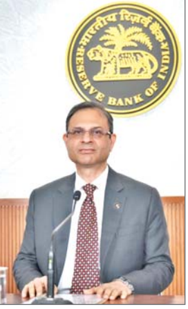
वहीं चालू वित्त वर्ष के लिए खुदरा मुद्रास्फीति के अनुमान को घटकर 3.1 प्रतिशत कर दिया गया है जबकि पहले

एजेंसी मुंबई। भारतीय रिजर्व बैंक (आरबीआई) के गवर्नर संजय महलोत्रा ने बुधवार को कहा कि वैश्विक अनिश्चितताओं, नीतिगत दरों में एकबारगी बड़ी कटौती और मुख्य मुद्रास्फीति में वृद्धि के कारण केंद्रीय बैंक ने द्विमासिक मौद्रिक नीति समीक्षा में यथास्थिति बनाए रखने का फैसला किया है। चालू वित्त वर्ष 2025-26 की तीसरी द्विमासिक मौद्रिक नीति समीक्षा पेश करने के बाद पत्रकारों के साथ बातचीत में महलोत्रा ने वृद्धि को समर्थन देने के लिए आरबीआई की प्रतिबद्धता की पुष्टि की और कहा कि सकल घरेलू उत्पाद (जीडीपी) की 6.5 प्रतिशत पर बरकरार रखा है।