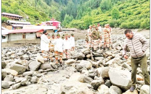
प्रमुख संवाददाता उत्तरकाशी (उत्तराखंड)। हार्षिल क्षेत्र के धराली में बादल फटने से हुई

मौसम की चुनौतियों के बावजूद सीएम पुष्कर सिंह धामी पहुंचे ग्राउंड जीरो पर