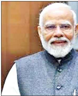
चीन की उनकी पहली यात्रा होगी।

नयी दिल्ली। प्रधानमंत्री नरेन्द्र मोदी 29 अगस्त से जापान और चीन की यात्रा पर जा सकते हैं। सूत्रों ने बुधवार को यह जानकारी दी। अपनी यात्रा के पहले चरण में, मोदी जापान के अपने समकक्ष के साथ वार्षिक शिखर वार्ता के लिए जापान जा सकते हैं। जापान से, मोदी के शंघाई सहयोग संगठन (एससीओ) के वार्षिक शिखर सम्मेलन में भाग लेने के लिए चीन जाने की संभावना है। अगर मोदी की चीन यात्रा होती है, तो पूर्वी लद्दाख में सीमा गतिरोध के बाद यह