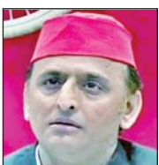
एसआईआर को लागू करने पर भाजपा सरकार को लिया आड़े हाथ

उन्होंने कहा कि पहाड़ी इलाकों में जिस तरह से आपदा आ रही है। घटनाएं हो रही हैं। बड़े पैमाने पर नुकसान हो रहा है। वह बहुत चिंता का विषय है। उन्होंने कहा कि डॉ. राम मनोहर लोहिया और समाजवादियों ने हिमालय बचाओ और नदियां बचाओ का नारा दिया था। हम सबको मिलकर उसी दिशा में काम करना पड़ेगा साथ ही अखिलेश यादव ने कहा है कि भाजपा एसआईआर को लागू करके किया जा रहा दुर्व्यवहार