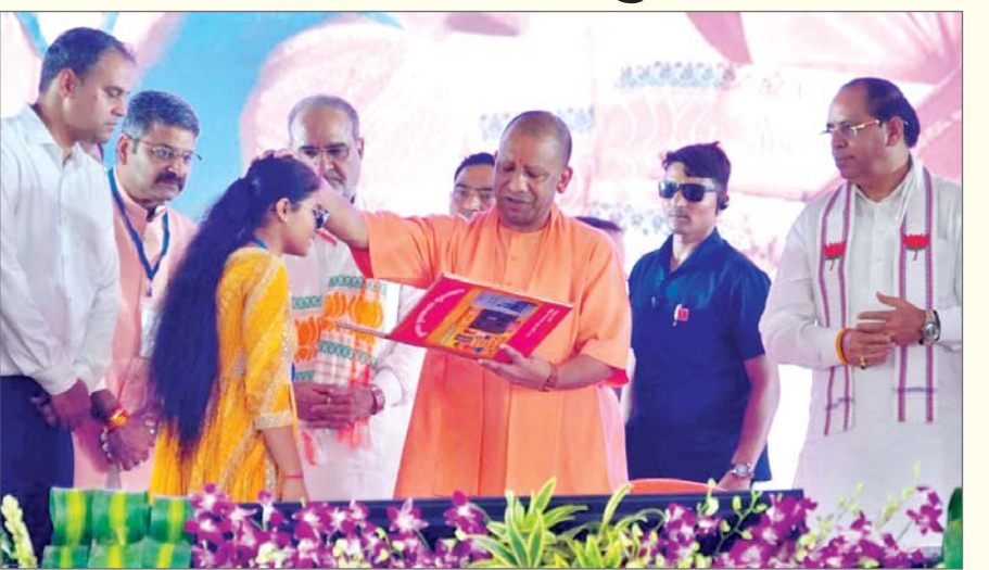
योजनाओं के लाभार्थियों को प्रमाण पत्र व टैबलेट प्रदान किए। सीएम योगी ने कांवड़ यात्रा की सफलता का उल्लेख करते हुए कहा कि लोगों की भावनाओं के वितरीत कांवड़ यात्रा को बदनाम करने का कुत्सित प्रयास किया गया, लेकिन आज कांवड़ यात्रा की सफलता जागरूक समाज और बेहतरीन कानून-व्यवस्था से उन ... शेष पृष्ठ 14 पर

बरेली। मुख्यमंत्री योगी आदित्यनाथ ने बुधवार को नाथ नगरी बरेली में 2264 करोड़ रुपये की लागत से जुड़ी 545 विकास परियोजनाओं का लोकार्पण और शिलान्यास किया। इस अवसर पर आयोजित जनसभा को संबोधित करते हुए मुख्यमंत्री ने विपक्षी दलों की तुष्टीकरण की राजनीति पर तीखा हमला बोला। उन्होंने कहा कि कुछ असमाजिक तत्व कांवड़ यात्रा को बदनाम करने की साजिश रचते हैं, लेकिन समाज की जागरूकता और प्रशासन की तत्परता से ऐसे तत्व विफल हो जाते हैं। यह यात्रा अब सामाजिक एकता का प्रतीक बन चुकी है। बरेली में लाखों श्रद्धालुओं ने नाथ गलियारे में जलाभिषेक कर अपनी आस्था प्रकट की, जो शहर की नई पहचान बन रही है। कार्यक्रम में मुख्यमंत्री ने रोजगार मेले के माध्यम से चयनित 6000 से अधिक युवाओं को नियुक्ति पत्र वितरित किए और विभिन्न