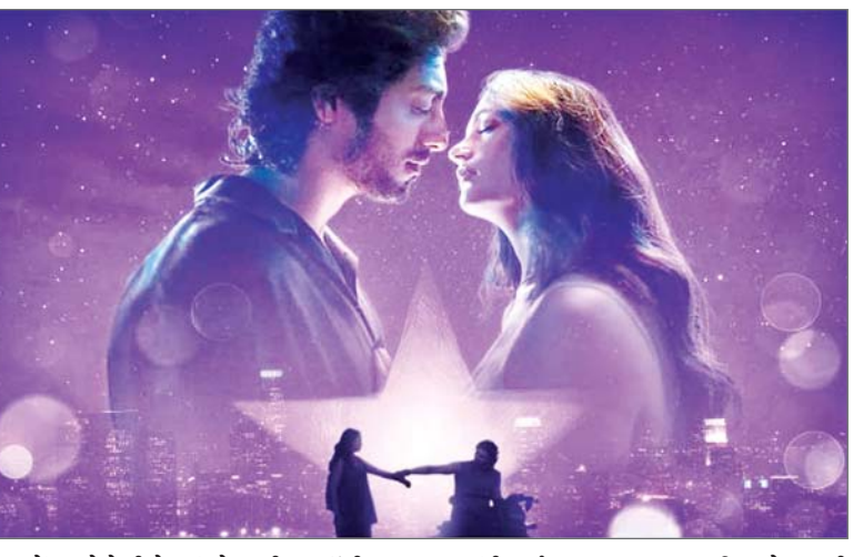
क्लब में सबसे तेजी से पहुंचने वाली 15 बॉलीवुड फिल्मों की लिस्ट में 'सैयारा' शामिल हो चुकी है। ऐसा करके 'सैयारा' ने सलमान खान की फिल्म 'बजरंगी भाईजान', 'सुलतान', ऋतिक रोशन की 'चोर', और दीपिका पादुकोण की 'पद्मावत' को पीछे छोड़ दिया है।

मुंबई। मोहित सूरी की फिल्म 'सैयारा' का बॉक्स ऑफिस पर धमाल जारी है। ये फिल्म लगातार नए रिकॉर्ड्स बना रही है। फिल्म ने घरेलू बॉक्स ऑफिस पर कमाई के मामले में 300 करोड़ रुपए का आंकड़ा छू लिया है। इस तरह ये मोहित सूरी की करियर की पहली 300 करोड़ वाली ब्लॉकबस्टर फिल्म है। वहीं, अहान पांडे और अनीत पट्टा अपनी डेब्यू फिल्म से 300 करोड़ क्लब में पहुंचने वाले पहले कलाकार बन गए हैं। इंडस्ट्री ट्रैकर सैकनलिक की रिपोर्ट के अनुसार, 'सैयारा' ने 17वें दिन बॉक्स