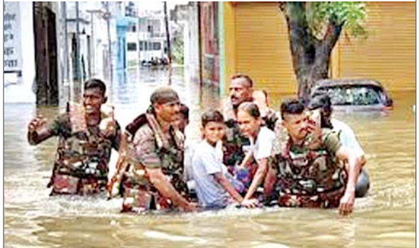
देहात, हमीरपुर, इटावा और फतेहपुर शामिल हैं। गोस्वामी के मुताबिक बाढ़ से अब तक 343 घरों को नुकसान पहुंचा है। इसके अलावा 4,015 हेक्टेयर से अधिक कृषि भूमि भी प्रभावित हुई है। बाढ़ से परेशान लोगों तक 493 नावों और मोटरबोटों के जरिए रहत सामग्री पहुंचाई जा रही है। उन्होंने बताया कि प्रभावित लोगों की मदद के लिए अब तक खाद्य पदार्थों के 76 हजार 632 पैकेट वितरित किए जा चुके हैं। इसके अलावा, प्रभावित लोगों को ताजा भोजन उपलब्ध कराने के लिए 29 सामुदायिक रसोइयां (लंगर) स्थापित की गयी हैं। गोस्वामी ने बताया कि वर्तमान में कुल 905 बाढ़ आश्रय स्थल बनाये गये हैं जिनमें 11 हजार 248 ...शेष पृष्ठ 14 पर

विशेष संवाददाता लखनऊ। उत्तर प्रदेश में 17 जिलों के 400 से ज्यादा गांव इस वक्त बाढ़ से प्रभावित हैं। रहत आयुक्त भानु चंद्र गोस्वामी ने रविवार को बताया कि राज्य के 17 जिलों में 37 तहसीलों के 402 गांव बाढ़ से प्रभावित हुए हैं और उनमें रहने वाले 84 हजार 392 लोगों की जिंदगी पर असर पड़ा है। राष्ट्रीय आपदा मोचन बल (एनडीआरएफ), राज्य आपदा मोचन बल (एसडीआरएफ) और प्रादेशिक सशस्त्र कांस्टेबलरी (पीसी) के कर्मियों द्वारा निरंतर गश्त के साथ रहत और बचाव कार्य जोरों पर चल रहा है। उन्होंने बताया कि बाढ़ से प्रभावित जिलों में कानपुर नगर, लखीमपुर खीरी, आगरा, औरैया, चित्रकूट, बलिया, बांदा, गाजीपुर, मिर्जापुर, प्रयागराज, वाराणसी, चंदौली, जालौन, कानपुर देहात, हमीरपुर, इटावा और फतेहपुर शामिल हैं। गोस्वामी के मुताबिक बाढ़ से अब तक 343 घरों को नुकसान पहुंचा है। इसके अलावा 4,015 हेक्टेयर से अधिक कृषि भूमि भी प्रभावित हुई है। बाढ़ से परेशान लोगों तक 493 नावों और मोटरबोटों के जरिए रहत सामग्री पहुंचाई जा रही है। उन्होंने बताया कि प्रभावित लोगों की मदद के लिए अब तक खाद्य पदार्थों के 76 हजार 632 पैकेट वितरित किए जा चुके हैं। इसके अलावा, प्रभावित लोगों को ताजा भोजन उपलब्ध कराने के लिए 29 सामुदायिक रसोइयां (लंगर) स्थापित की गयी हैं। गोस्वामी ने बताया कि वर्तमान में कुल 905 बाढ़ आश्रय स्थल बनाये गये हैं जिनमें 11 हजार 248 ...शेष पृष्ठ 14 पर