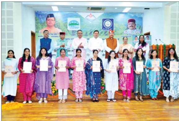
कर्मचारियों के आश्रितों को भी नियुक्तियों देने का काम किया है। बीते वर्ष 150 आश्रितों और आज शेष 43 पात्र आश्रितों को भी नियुक्ति पत्र प्रदान कर दिए गए हैं। उन्होंने बताया राज्य सरकार के प्रयासों से 2024 में निगम ने रिक्त 56 करोड़ रुपये से अधिक का लाभ अर्जित किया। मुख्यमंत्री ने कहा कि राज्य में भर्तियां पूर्ण पारदर्शिता और मेरिट के आधार पर सुनिश्चित की जा रही हैं, जिससे योग्य उम्मीदवारों को उनके कौशल और परिश्रम का पूरा लाभ मिल रहा है। उन्होंने बताया बीते साढ़े 3 वर्ष में प्रदेश के 23 हजार से अधिक युवा सरकारी नौकरी पाने में सफल रहे हैं। मुख्यमंत्री ने कहा राज्य सरकार ने भ्रष्टाचार के खिलाफ जीरो टॉलरेंस की नीति को अपनाया है। अब भ्रष्टाचार के मामलों में किसी को नहीं छोड़ा जाता है। उन्होंने कहा प्रधानमंत्री नरेन्द्र मोदी ने देशवासियों से स्वदेशी उत्पादों का उपयोग करने का आग्रह किया है। उन्होंने भी प्रदेशवासियों से स्वदेशी और लोकल उत्पादों का उपयोग करने का आग्रह किया। मुख्यमंत्री ने कहा आत्मनिर्भर भारत की दिशा में हमारा संकल्प और भी सशक्त होना चाहिए। उन्होंने कहा देवभूमि उत्तराखंड, प्रधानमंत्री के आत्मनिर्भर भारत के मंत्र को साकार करने के लिए ...शेष पृष्ठ 14 पर