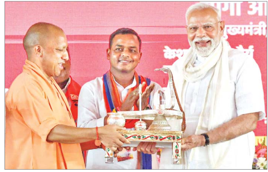
के लगभग ढाई करोड़ किसानों को इसका लाभ मिला है। यूपी के किसानों के खाते में 90 हजार करोड़ से अधिक रुपये भेजे गए हैं। अकेले काशी के किसानों को करीब 900 करोड़ रुपये मिले हैं। प्रधानमंत्री नरेन्द्र मोदी ने शनिवार को कहा कि ऑपरेशन सिंदूर के जरिये पहलगाय आतंकी हमले का बदला लेने का उनका वादा भगवान शिव के आशीर्वाद से पूरा हुआ। प्रधानमंत्री ने आतंकवाद के खिलाफ भारत की दृढ़

लखनऊ/वाराणसी। प्रधानमंत्री नरेन्द्र मोदी अपने संसदीय क्षेत्र काशी में शनिवार को 51वाँ बार पहुंचे। इस शुभ अंकों के साथ उन्होंने काशी से किसानों को बड़ी सौगात दी। श्रावण मास में देवाधिदेव महादेव की काशी से पीएम मोदी ने अन्नदाताओं को प्रधानमंत्री किसान सम्मान निधि की 20वीं किस्त जारी की। सिर्फ एक क्लिक में देश के 9.70 करोड़ से अधिक किसानों के पास सम्मान निधि के रूप में 'समृद्धि' पहुंची। सीएम योगी आदित्यनाथ की मौजूदगी में उत्तर प्रदेश के 2.29 करोड़ तथा काशी के 2.21 लाख किसानों के खाते में डीबीटी के माध्यम से किसान सम्मान निधि पहुंची। बिना ब्रेक जारी प्रधानमंत्री किसान सम्मान निधि से अब तक किसानों के खाते में पैसे चार लाख करोड़ रुपये भेजे जा चुके हैं। प्रधानमंत्री किसान सम्मान निधि के जरिए देश के किसानों के खाते में आज तक केंद्र सरकार द्वारा पैसे चार लाख करोड़ रुपये भेजे जा चुके हैं। वहीं यूपी