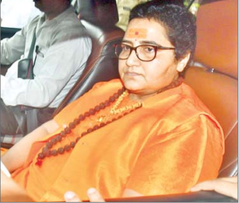
झूठ नहीं बोल्ना चाहती थी। ठाकुर ने दावा किया कि उन्होंने यह सब लिखित में दिया था। ठाकुर ने कहा उनका उद्देश्य मुझे प्रताड़ित करना था। उन्होंने कहा कि अगर मैंने नाम नहीं लिए, तो वे मुझे प्रताड़ित करेंगे। इन नामों में उत्तर प्रदेश के मुख्यमंत्री योगी आदित्यनाथ, सुदर्शन जी, इंद्रेश जी, राम जी माधव और कई अन्य शामिल हैं,