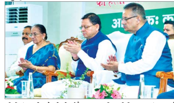
प्रति क्विंटल को बढ़ोत्तरी की गई है। मुख्यमंत्री पुष्कर सिंह धामी ने यह विचार प्रधानमंत्री नरेन्द्र मोदी द्वारा वाराणसी में प्रधानमंत्री किसान सम्मान निधि की 20वीं किस्त के तहत देश के 09 करोड़ 71 लाख से अधिक किसानों के खातों में कुल 20 हजार 500 करोड़ रुपये से अधिक की धनराशि का डिजिटल हस्तांतरण करने के अवसर पर देहरादून के गढ़ीकैंट में आयोजित समारोह को सम्बोधित करते हुए व्यक्त किए। इस अवसर पर उत्तराखण्ड के 08 लाख 28 हजार 787 लाभार्थी किसान परिवारों को 184.25 करोड़ रुपये की धनराशि हस्तांतरित ...शेष पृष्ठ 14 पर

देहरादून। राज्य सरकार प्रदेश के किसानों के उत्थान एवं समृद्धि के लिए निरंतर कार्य कर रही है। प्रदेश में किसानों को तीन लाख रुपये तक का ऋण बिना ब्याज के उपलब्ध कराया जा रहा है। कृषि उपकरण खरीदने के लिए फार्म मशीनरी बैंक योजना के माध्यम से 80 प्रतिशत तक की सब्सिडी भी प्रदान की जा रही है। किसानों के हित में नहरों से सिंचाई को पूरी तरह मुक्त किया गया है। किसानों की आय बढ़ाने के लिए पॉलीहाउस के निर्माण के लिए 200 करोड़ रुपये की राशि का प्रावधान भी किया गया है। गेहूं खरीद पर किसानों को 20 रुपये प्रति क्विंटल का बोनस प्रदान करने के साथ ही गन्ने के मूल्य में भी 20 रुपये