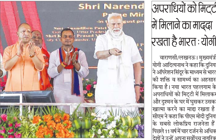
हिम्मत करेगा, उसे बख्शा नहीं जाएगा, यहां तक कि पाताल लोक में भी नहीं। मोदी ने अपने संसदीय क्षेत्र वाराणसी में एक जनसभा को संबोधित करते हुए कहा पहलगाय आतंकी हमले में जान गंवाने वाले 26 लोगों के लिए