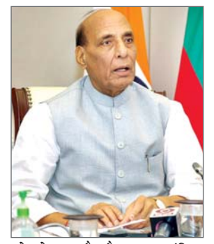
ओर ले जाता है और दूसरा (इंडिया गठबंधन के तहत) बिहार को अराजकता और जाति संघर्ष के पुराने दौर में वापस ले जाता है। भारतीय जनता पार्टी (भाजपा) के वरिष्ठ नेता सिंह ने कटाक्ष करते हुए कहा राहुल गांधी कहते हैं कि उनके पास एटम बम है। अगर ऐसा है, तो उन्हें तुरंत उसे फोड़

पटना। रक्षा मंत्री राजनाथ सिंह ने निर्वाचन आयोग पर बिहार में वोट चोरी का आरोप लगाने के लिए शनिवार को कांग्रेस नेता राहुल गांधी की आलोचना की। लोकसभा में नेता प्रतिपक्ष राहुल गांधी ने दावा किया है कि निर्वाचन आयोग बिहार में वोट चोरी में शामिल है और इस बारे में उनके पास ऐसा पुख्ता सबूत है, जो एटम बम की तरह है, जिसके फटने पर आयोग को कहीं छिपने की जगह नहीं मिलेगी। पटना में एक मीडिया संस्थान द्वारा आयोजित कार्यक्रम को संबोधित करते हुए सिंह ने आगामी विधानसभा चुनावों को तुलना एक चौराहे से की, जिसमें एक रास्ता (राष्ट्रीय जनतांत्रिक गठबंधन के तहत) आगे की प्रगति की