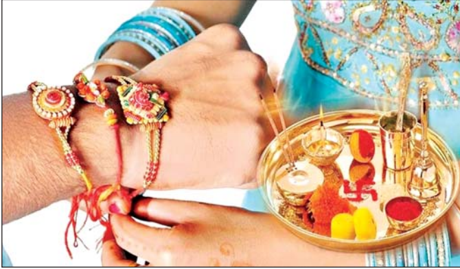
वरिष्ठ संवाददाता (vol)

लखनऊ। रक्षाबंधन में अब बस कुछ ही दिन बचे हैं। ऐसे में लखनऊ के सभी बाजार सजकर तैयार हो चुके हैं। अगर आप भी रक्षाबंधन की तैयारियां शुरू करने जा रहे हैं तो लखनऊ के कुछ मशहूर बाजार हैं, जहाँ से आप तैयारी कर सकते हैं। इन बाजारों में आपको कपड़ों से लेकर रक्षाबंधन के उपहार और राखियाँ तक सब कुछ बेहद कम कीमतों पर मिलेगा।