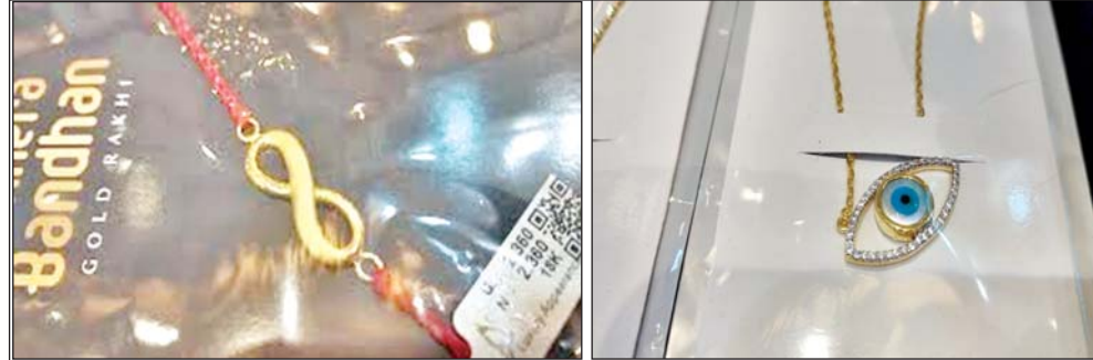
वरिष्ठ संवाददाता (vol)

लखनऊ। इस बार भाई बहनों का पर्व रक्षाबंधन 9 अगस्त को मनाया जाएगा। इसको लेकर अभी से ही लखनऊ शहर में तैयारियाँ करनी शुरू कर दी हैं। खासतौर पर भाइयों ने इस बार एक अनोखा तरीका अपनाया है। बता दें कि इस बार लखनऊ की ज्यादातर ज्वेलरी की दुकानों पर भाइयों ने अपनी बहनों को बुरी नजरों से बचाने के लिए आंख का लॉकेट बनवाया है, ताकि उनकी बहनों को किसी भी तरह की बुरी नजर न लगे। लखनऊ के सराफा बाजार में इस समय एक से बढ़कर एक खूबसूरत लॉकेट देखने के लिए मिल रहे हैं। यह आँडर