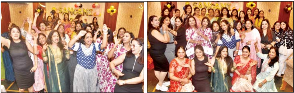
वरिष्ठ संवाददाता (vol)

लखनऊ। संगिनी 2.0 का आगाज मरावाड़ी युवा मंच श्रद्धा ने मित्रता और तीज को समर्पित कार्यक्रम से किया। जिसमें सभी जोड़ियों और बिना जोड़ी वालों ने रैंप वॉक कर प्रशनों के उत्तर और टैलेट राउंड में विजयी बनकर प्रथम,