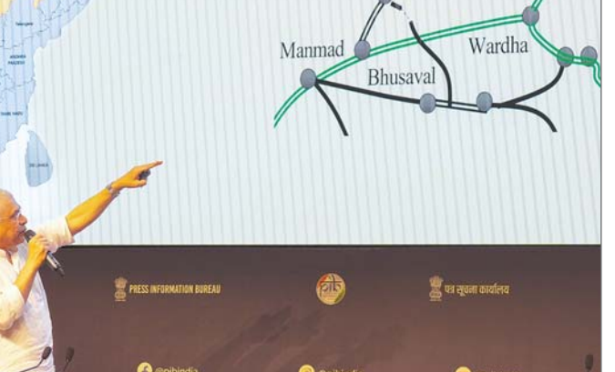
मामलों की मंत्रिमंडलीय समिति (सीसीईए) की बैठक में इस संबंध में निर्णय लिया गया। मंत्रिमंडल की बैठक के बाद सूचना एवं प्रसारण मंत्री अश्विनी वैष्णव ने बताया, पीएमकेएसवाई का परिव्यय बढ़ाकर 6,520 करोड़ रुपये कर दिया गया है। वहीं एक अन्य निर्णय में केंद्रीय मंत्रिमंडल ने बृहस्पतिवार को राष्ट्रीय सहकारी विकास निगम (एनसीडीसी) को चार साल के लिए 2,000

नयी दिल्ली। प्रधानमंत्री नरेन्द्र मोदी की अध्यक्षता वाली आर्थिक मामलों की मंत्रिमंडलीय समिति ने रेल मंत्रालय की लगभग 11,169 करोड़ रुपये की चार परियोजनाओं को मंजूरी दे दी है। एक आधिकारिक विज्ञापित में बृहस्पतिवार को यह जानकारी दी गई। केंद्रीय मंत्रिमंडल ने बृहस्पतिवार को खाद्य प्रसंस्करण क्षेत्र को बढ़ावा देने के लिए प्रधानमंत्री किसान संपदा योजना (पीएमकेएसवाई) के लिए बजटीय परिव्यय 1,920 करोड़ रुपये बढ़ाकर 6,520 करोड़ रुपये करने की मंजूरी दे दी। चालू वित्त वर्ष (2025-26) में प्रधान की जाने वाली बड़ी हुई धनराशि का उपयोग 50 बहु-उत्पाद खाद्य विकिरण इकाइयों और 100 खाद्य परीक्षण प्रयोगशालाओं के लिए किया जाएगा। प्रधानमंत्री नरेन्द्र मोदी की अध्यक्षता में हुई आर्थिक