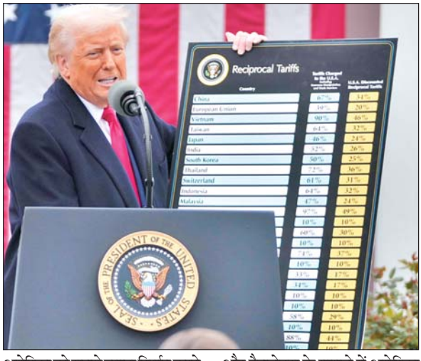
अमेरिका को सबसे ज्यादा निर्यात करने वाला सेक्टर है। बीते कुछ वर्षों में भारत स्मार्टफोन्स से लेकर लैपटॉप, सर्वर

और टैबलेट्स के मामले में अमेरिका का सबसे बड़ा निर्यातक बना है। ऐसे में 1 अगस्त से ...शेष पृष्ठ 14 पर