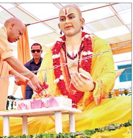
में समर्पित किया। आदित्यनाथ ने कहा कि जब देश के राजे-रजवाड़े विदेशी आक्रांता की अधीनता स्वीकार कर रहे थे, उस समय तुलसीदास जैसे संत भक्ति और शक्ति के अद्भुत संगम के रूप में जनचेतना को जागृत कर रहे थे। उन्होंने प्रतिकार का मार्ग तलवार नहीं, रामलीला और ...शेष पृष्ठ 14 पर

चित्रकूट। मुख्यमंत्री योगी आदित्यनाथ ने श्रीरामचरित मानस के रचयिता गोस्वामी तुलसीदास को दिव्य आत्मा बताते हुए बृहस्पतिवार को कहा कि उन्होंने प्रतिकार का मार्ग तलवार नहीं बल्कि रामलीला और रामचरितमानस के माध्यम से चुना। धार्मिक नगरी चित्रकूट में संत तुलसीदास के जयंती समारोह में मुख्यमंत्री ने कहा कि इस दिव्य आत्मा ने बाल्यावस्था में ही प्रभु श्रीराम के चरणों में स्वयं को समर्पित कर दिया। उस कालखंड में जब अकबर का साम्राज्य विस्तार पर था और दरबार में जगह पाने की होड़ थी तब तुलसीदास ने खुद को किसी दरबारी की सेवा में नहीं बल्कि केवल प्रभु श्रीराम की भक्ति