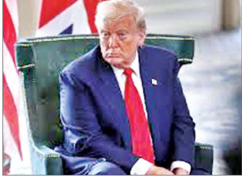
जapan, ब्रिटेन और यूरोपीय संघ (ईयू) जैसे प्रमुख साझेदारों के साथ अनुकूल व्यापार समझौते किए हैं। ट्रंप ने भारत की व्यापार नीतियों को सबसे कठिन और अप्रिय बताया है।

उन्होंने कहा कि मुझे परवाह नहीं है कि भारत, रूस के साथ क्या करता है। वे एक साथ अपनी मृत अर्थव्यवस्थाओं को गर्त में ले जा सकते हैं, मुझे कोई फर्क नहीं पड़ता है। अमेरिकी राष्ट्रपति ने कहा कि हमने भारत के साथ बहुत कम व्यापार किया है, उनके शुल्क बहुत अधिक हैं। ट्रंप ने एक अगस्त से भारत पर 25 प्रतिशत से अधिक शुल्क लगाने की बुधवार को घोषणा की थी। उन्होंने रूस से कच्चा तेल और सैन्य उपकरण खरीदने के लिए भी भारत पर जुमाना लगाने की घोषणा की। यह आश्चर्यजनक घोषणा ऐसे समय में की गई है जब इससे एक दिन पहले ही भारतीय अधिकारियों ने कहा था कि एक अमेरिकी व्यापार दल व्यापार समझौते पर बातचीत करने के लिए 25 अगस्त से भारत का दौरा करेगा। इस घोषणा को भारत पर अमेरिका की मांगों को मानने के लिए दबाव बनाने की रणनीति के रूप में देखा जा रहा है, जिसने हाल ही में