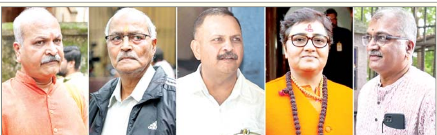
पुलिस ने दबाव में काम किया, कांग्रेस हिंदुओं से माफी मांगे : फडणवीस

मुंबई। भारतीय जनता पार्टी (भाजपा) की पूर्व सांसद प्रज्ञा सिंह ठाकुर और लेफ्टिनेंट कर्नल प्रसाद पुरोहित ने 2008 के मालेगांव विस्फोट मामले में उन्हें बरी करने के विशेष अदालत के आदेश की बृहस्पतिवार को सराहना की। इस विस्फोट में छह लोगों की मौत हो गई थी और 101 अन्य घायल हुए थे। पूर्व सांसद प्रज्ञा सिंह ठाकुर ने कहा कि बरी होना सिर्फ उनकी ही नहीं, बल्कि भगवा की जीत है।