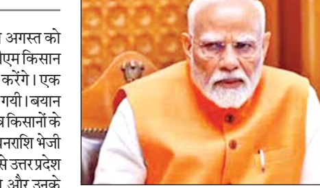
वाराणसी का दौरा करेंगे। संयुक्त कृषि निदेशक शैलेंद्र कुमार ने बताया कि पीएम किसान सम्मान निधि के तहत

वाराणसी। प्रधानमंत्री नरेन्द्र मोदी दो अगस्त को उत्तर प्रदेश के वाराणसी दौरे के दौरान पीएम किसान सम्मान निधि की 20वीं किस्त जारी करेंगे। एक आधिकारिक बयान में यह जानकारी दी गयी। बयान में बताया गया कि देश के 9.70 करोड़ पात्र किसानों के खाते में 20,500 करोड़ से अधिक की धनराशि भेजी जाएगी। बयान के मुताबिक, इस योजना से उत्तर प्रदेश के 2.30 करोड़ किसान लाभान्वित होंगे और उनके खाते में 4600 करोड़ रुपये की धनराशि भेजी जाएगी। प्रधानमंत्री मोदी दो अगस्त को अपने संसदीय क्षेत्र