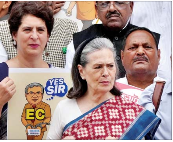
लिखा हुआ था। उन्होंने एसआईआर वापस ले के नारे लगाए। विपक्षी सांसदों की मांग है कि इस विषय पर संसद में चर्चा होनी चाहिए।

नयी दिल्ली। विपक्षी गठबंधन इंडियन नेशनल डेवलपमेंटल इन्क्लूसिव अलयंस (इंडिया) के कई घटक दलों के सांसदों ने बिहार में मतदाता सूची के विशेष गहन पुनरीक्षण (एसआईआर) का विरोध करते हुए बुधवार को संसद भवन परिसर में प्रदर्शन किया। संसद के मकर द्वार के निकट आयोजित इस विरोध प्रदर्शन में कांग्रेस संसदीय दल की प्रमुख सोनिया गांधी, कांग्रेस महासचिव प्रियंका गांधी वाद्रा, समाजवादी पार्टी, राष्ट्रीय जनता दल और कई अन्य दलों के सांसद शामिल हुए। विपक्षी सांसदों ने एक बड़ा बैनर भी ले रखा था, जिस पर एसआईआर- लोकतंत्र पर वार