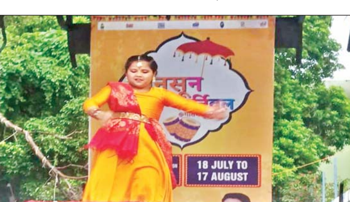
वरिष्ठ संवाददाता (vol)

लखनऊ। द मानसून कॉर्निवल 2025 प्रगति इवेंट इवेंट, लखनऊ विकास प्राधिकरण और जेटेक कंपनी द्वारा लखनऊ के गौतम बुद्ध पार्क में 18 जुलाई से 17 अगस्त 2025 आयोजित किया गया है। सांस्कृतिक मस्ती, खाने पीने के लिए फूड स्टॉल पार्क में वोटिंग सहित बच्चों के मनोरंजन और खेल के लिए बहुत कुछ साधन उपलब्ध है। गौतम बुद्ध पार्क में हमारे पारंपरिक खेल जैसे गिल्ली डंडा, कांचा, कबड्डी, खो-खो को कलाकृतियों के माध्यम से पुनः जीवित करने का