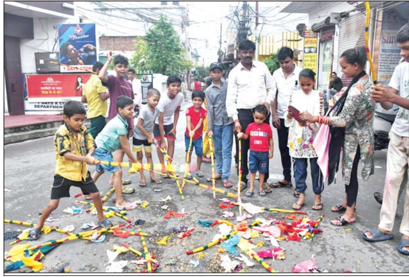
नागपंचमी पर गुड़िया पीटते बच्चे