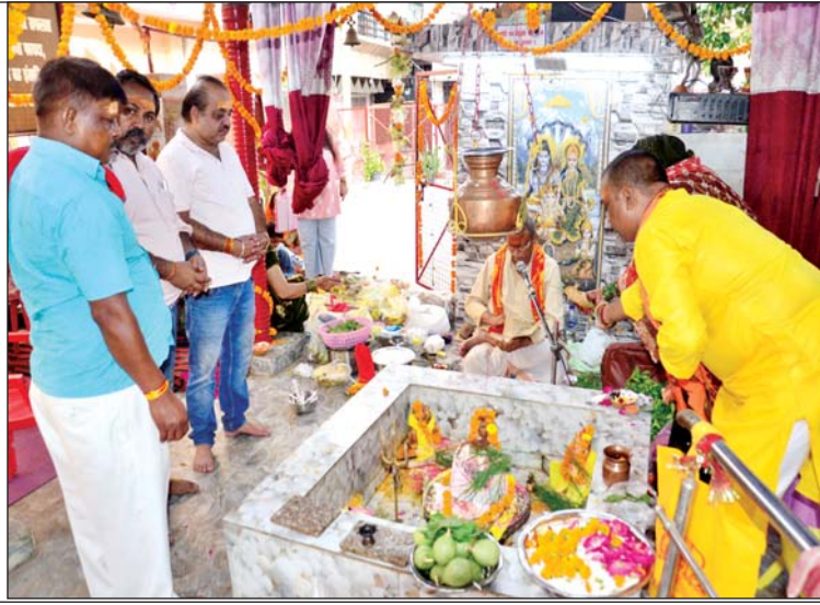
शिव मंदिर में रुद्राभिषेक करते भक्तगण