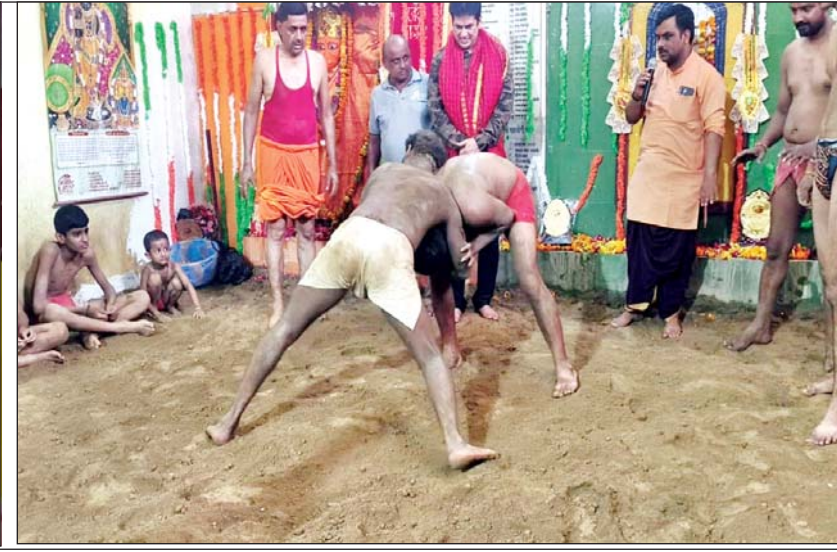
नागपंचमी पर दंगल में दांव दिखाते पहलवान