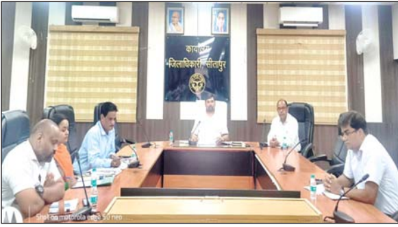
जिला संवाददाता (VOL)

सीतापुर। शासन द्वारा गठित जिला उद्योग बन्धु सिंगल विण्डों निवेश मित्र की बैठक कलेक्ट्रेट सभागार में जिलाधिकारी अभिषेक आनंद की अध्यक्षता में सम्मान हुई। बैठक में औद्योगिक आस्थानों के रख-रखाव, निवेश मित्र पोर्टल, निर्यात प्रोत्साहन योजना, ओडीओपी, प्रधानमंत्री रोजगार सृजन कार्यक्रम योजना, मुख्यमंत्री युवा कार्ययोजना योजना, प्रधानमंत्री मुद्रा योजना, जेम पोर्टल, क्लस्टर विकास योजना, एमओयू इत्यादि योजनाओं की समीक्षा की गई। समीक्षा के दौरान सम्बन्धित विभागों को निर्देशित किया गया कि