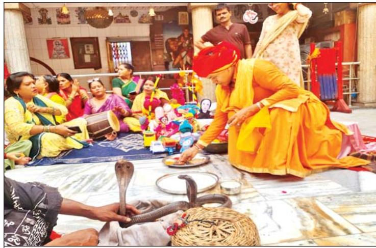
वरिष्ठ संवाददाता (vol)

लखनऊ। श्रावण मास की शुक्ल पंचमी को मनाया जाने वाला नागपंचमी पर्व मंगलवार को श्रद्धा के साथ मनाया गया। यह नागों की पूजा का पर्व है। श्रद्धालुओं ने सुबह शिवालयों में भोलेनाथ की आराधना की और नाग देवता का पूजन किया। पूजन के लिए डालीगंज के मनकामेश्वर मंदिर, चौक के कोनेश्वर मंदिर, ठाकुरगंज के कल्याण गिरी मंदिर, नादान महल रोड स्थित सिद्धनाथ मंदिर, चौपटिया के बड़ा शिवाला, छोटा शिवाला, सदर के द्वादश ज्योतिर्लिंग मंदिर समेत अन्य शिवालयों में जबरदस्त भीड़ रही। पूजन के बाद सभी ने घरों में बने व्यंजनों का आनंद उठाया। उदयगंज में चलने वाला पारंपरिक गुड़िया मेला आज से शुरू हुआ। तीन दिनों तक चलने वाला मेले में सैकड़ों दुकानों व झुले लगे हैं। जिसमें घर गृहस्थी से लेकर बच्चों के खिलौने तक मिल रहे हैं। इस मौके पर राधानाथी में कई इलाकों में मेले और भंडारे के आयोजन भी किए गए।