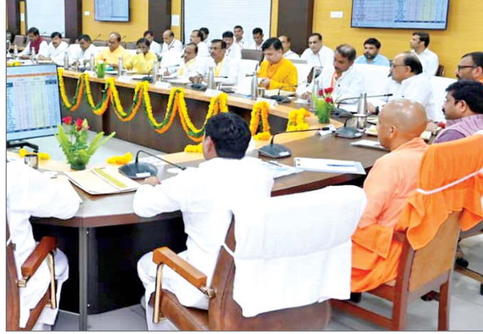
ने जनप्रतिनिधियों द्वारा लोक निर्माण विभाग को उपलब्ध कराए गए प्रस्तावों पर चर्चा करते हुए इन प्रस्तावों को प्राथमिकता के आधार पर शासन को उपलब्ध कराने के लिए कहा और लोक निर्माण विभाग तथा धर्मार्थ कार्य विभाग को इन प्रस्तावित कार्यों को प्राथमिकता पर लेते हुए कार्यों का

विशेष संवाददाता प्रयागराज। मुख्यमंत्री योगी आदित्यनाथ ने मंगलवार को यहां सर्किट हाउस में एक उच्च स्तरीय बैठक में प्रयागराज और विन्ध्याचल मंडल के सांसदों, विधायकों और विधान परिषद सदस्यों के साथ प्रस्ताव एवं कार्य योजना की समीक्षा की। राज्य सरकार द्वारा जारी एक बयान के मुताबिक, इस बैठक में मुख्यमंत्री ने सभी जनप्रतिनिधियों से उनके निर्वाचन क्षेत्रों की परिस्थितियों, जन अपेक्षाओं और विकास प्राथमिकताओं के विषय में व्यक्तिगत रूप से संवाद किया। मुख्यमंत्री ने कहा कि प्रयागराज और विन्ध्याचल क्षेत्र के विकास को सरकार प्राथमिकता दे रही है। यह दोनों ही मंडल उत्तर प्रदेश की ऐतिहासिक, सांस्कृतिक और आध्यात्मिक पहचान के केन्द्र हैं। इन क्षेत्रों का पुनरुत्थान और समेकित विकास प्रदेश के विकास की गति प्रदान करेगा। बैठक में योगी आदित्यनाथ