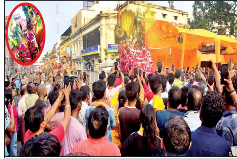
चौक स्थित कोतवालेश्वर मंदिर से नगर भ्रमण पर गाजे-बाजे के साथ निकले नगर कोतवाल