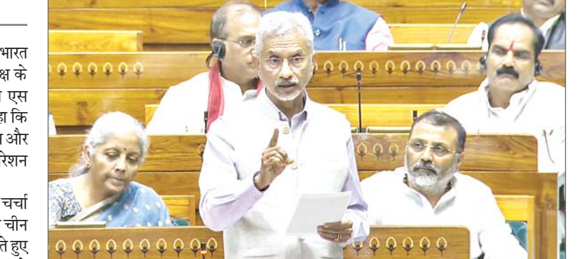
संधि को स्थगित करने और अटारी सीमा बंद करने जैसे कूटनीतिक निर्णयों का जिक्र करते हुए कहा कि इन शुरुआती कदमों के बाद भारत का जवाब रुका नहीं। उन्होंने कहा कि भारत ने वैश्विक विमर्श और कूटनीतिक माहौल बनाकर यह स्पष्ट संदेश दिया कि उसकी नीति है और वह अपने लोगों की रक्षा करेगा। जयशंकर ने कहा कि पाकिस्तान के संयुक्त राष्ट्र सुरक्षा परिषद (यूएनएससी) का सदस्य होने के नाते उस मंच पर इस संबंध में

एजेंसी नयी दिल्ली। पहलगाम हमले के बाद भारत को विदेश से समर्थन नहीं मिलने के विपक्ष के दावों को खारिज करते हुए विदेश मंत्री एस जयशंकर ने सोमवार को लोकसभा में कहा कि संयुक्त राष्ट्र के 193 सदस्यों में से पाकिस्तान और तीन अन्य देशों को छोड़कर सभी ने ऑपरेशन सिंदूर का समर्थन किया था। ऑपरेशन सिंदूर विषय पर लोकसभा में चर्चा में भाग लेते हुए जयशंकर ने पाकिस्तान को चीन के समर्थन पर विपक्ष के आक्षेपों को नकारते हुए कहा कि दोनों देशों की साझेदारी 60 साल से कांग्रेस के समय से चल रही है। विदेश मंत्री ने सदन में कहा पहलगाम हमले के बाद पाकिस्तान को स्पष्ट संदेश देना जरूरी था। हमारी सीमाएं लंबी हैं और यह संदेश देना जरूरी था कि परिणाम अच्छे नहीं होंगे। उन्होंने हमले के बाद सिंधु जल