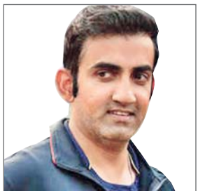
के बाद प्रेस कॉन्फ्रेंस में कहा, वे अपने देश के आम आदमी के लिए जुझना चाहते हैं। सबसे महत्वपूर्ण बात यह है कि इस टेस्ट मैच में कई लोगों ने हमारी

मैनचेस्टर। इंग्लैंड के खिलाफ चौथे टेस्ट मैच में भारत के संघर्षपूर्ण डॉन ने मुख्य कोच गौतम गंभीर के अंदर के जुझारू व्यक्तित्व को फिर से सामने ला दिया है जिन्होंने कप्तान शुभमन गिल के आलोचकों को लताड़ लगाते हुए कहा कि भारतीय टीम स्वदेश के आम आदमी के लिए खेलती है। गंभीर चाहते हैं कि उनके खिलाड़ी अतीत के नकशेकदम पर चलने के बजाय अपना इतिहास खुद बनाएं। उन्होंने कहा कि मैनचेस्टर टेस्ट में यादगार वापसी के बाद, वे इसी दिशा में आगे बढ़ रहे हैं। गंभीर ने रविवार को मैच