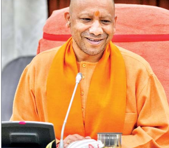
निर्णायक घड़ी में, योगी आदित्यनाथ ने केवल उत्तर प्रदेश के सबसे लंबे समय तक सेवा देने वाले मुख्यमंत्री बने हैं, बल्कि एक ऐसे

विशेष संवाददाता लखनऊ। मुख्यमंत्री योगी आदित्यनाथ ने एक ऐतिहासिक कीर्तिमान स्थापित करते हुए उत्तर प्रदेश के सबसे लंबे कार्यकाल वाले मुख्यमंत्री बनने का गौरव प्राप्त किया है। उन्होंने स्वतंत्र भारत के पहले मुख्यमंत्री पंडित गोविंद बल्लभ पंत का 8 वर्ष 127 दिन का रिकॉर्ड तोड़ते हुए अब तक 8 वर्ष 4 माह और 10 दिन का प्रभावी कार्यकाल पूरा कर लिया है। इससे पहले मुलायम सिंह यादव छह वर्ष 274 दिन, संपूनांद पंच वर्ष 345 दिन, अखिलेश यादव पांच वर्ष चार दिन और नारायण दत्त तिवारी तीन वर्ष 314 दिन मुख्यमंत्री पद पर आसीन रहे हैं। योगी आदित्यनाथ का यह कार्यकाल न सिर्फ राजनीतिक स्थिरता का प्रतीक है, बल्कि शासन के प्रत्येक क्षेत्र में सुधार, पारदर्शिता और दृढ़ इच्छाशक्ति के साथ विकास की गति को अभूतपूर्व ऊंचाईयों तक ले जाने वाला