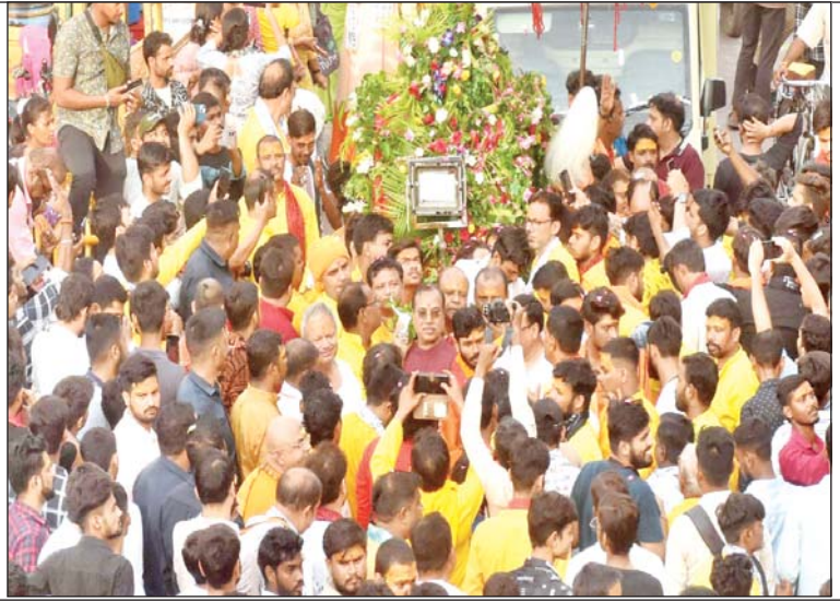
भक्तों को उमड़ा हुआ