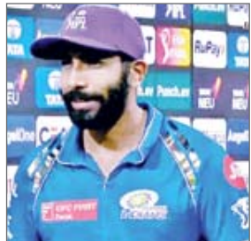
ओवर गेंदबाजी की है, जो लगभग 24 ओवर प्रति पाए है। उन्होंने अब तक 14 विकेट लिए हैं और इस तरह से अपने साथी तेज गेंदबाज मोहम्मद

शुरू होने वाले पांचवें और अंतिम टेस्ट मैच में जीत हासिल करनी होगी। गिल ने बीबीसी के टेस्ट मैच स्पेशल कार्यक्रम में कहा अगर उन्हें लगता है कि वह पूरी तरह से फिट हैं और हमारे लिए उपलब्ध हैं, तो मुझे लगता है कि यह हमारे लिए बहुत बड़ी बात होगी। उन्होंने कहा अगर वह नहीं खेल पाएंगे तो मुझे तब भी लगता है कि हमारे पास अच्छा गेंदबाजी आक्रमण है। बुमराह ने ओल्ड ट्रैफर्ड में चौथे टेस्ट में 33 ओवर गेंदबाजी की। उन्होंने अब तक तीन टेस्ट मैचों की पांच पारियों में 119.4