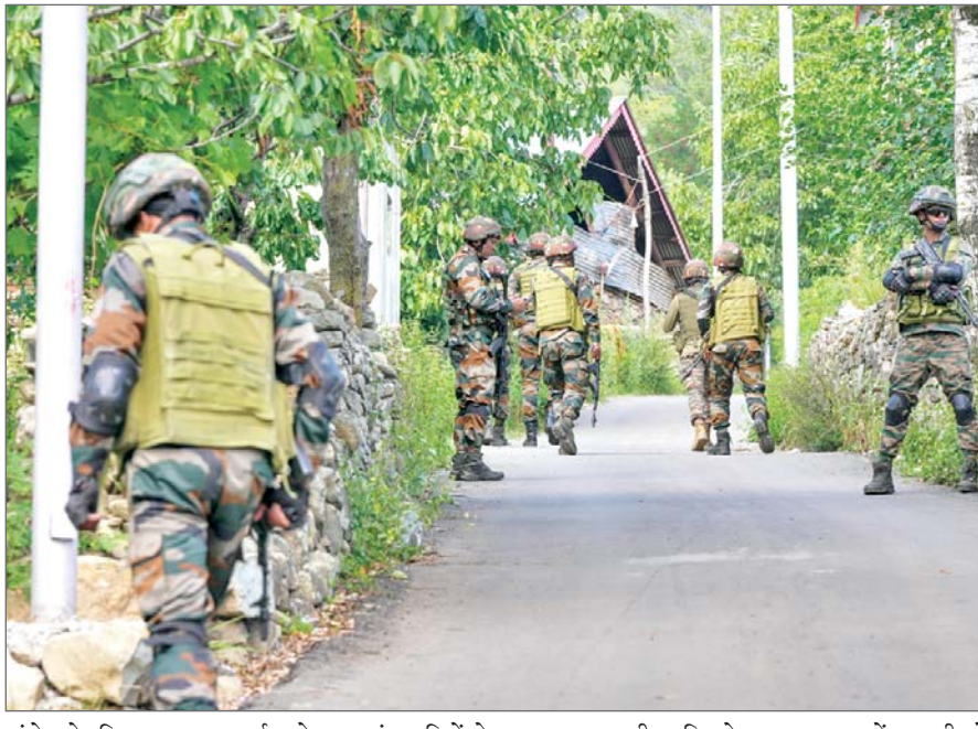
ढांचे के खिलाफ सात मई को ऑपरेशन सिंदूर शुरू किया था। अधिकारियों ने बताया कि खुफिया जानकारी के आधार पर क्षेत्र में आतंकवादियों के एक अन्य समूह की मौजूदगी की आशंका के चलते सेना और अन्य सुरक्षा बलों की अतिरिक्त टुकड़ियां वहां भेजी गई हैं। जबान