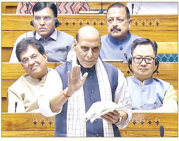
पर संपर्क कर आग्रह किया गया था कि अब कार्वाई रोक दी जाए। उन्होंने विपक्ष पर भी निशाना साधा और कहा कि उसे यह सवाल पूछने के

एजेंसी नयी दिल्ली। रक्षा मंत्री राजनाथ सिंह ने सोमवार को ऑपरेशन सिंदूर को तीनों सेनाओं के समन्वय का बेमिसाल उदाहरण बताते हुए कहा कि यह कहना गलत और निराधार है कि इस अभियान को किसी दबाव में आकर रोका गया था। साथ ही उन्होंने पाकिस्तान को स्पष्ट शब्दों में चेतावनी दी कि यदि उसकी कुछ गलतफहमी बची रह गयी है तो उसे भी दूर कर दिया जाएगा। सिंह ने लोकसभा में पहलगाम में आतंकवादी हमले के जवाब में भारत के मजबूत, सफल एवं निर्णायक ऑपरेशन सिंदूर पर विशेष चर्चा की शुरुआत करते हुए यह भी कहा कि पाकिस्तान की तरफ से सैन्य अभियान महानिदेशक (डीजीएमओ) के स्तर