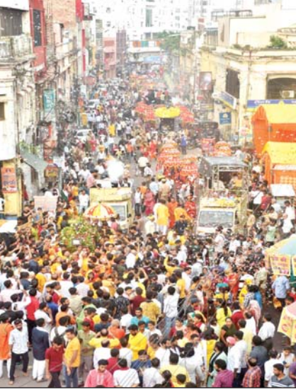
महाराष्ट्र से आए रंगोली कलाकार ने रंगोली बनाई गयी, प्रशासनिक घोड़े, लिल्ली घोड़ी, हाथी, ऊंट 10 रिकशे पर विभिन्न मूर्ति वाली

लखनऊ। सोमवार को चौक कोतवाली स्थित श्री कोतवालेश्वर मंदिर से श्री कोतवालेश्वर महादेव जी चांदी की पालकी में नगर भ्रमण यात्रा पर निकलें। श्री कोतवालेश्वर महादेव मंदिर से कोतवालेश्वर बाबा जी को चांदी पालकी में बैठाया गया। उसके पश्चात बाबा जी की आरती व गोंड ऑफ ऑनर प्रशासन द्वारा दिया गया। प्रशासन से आये होम गार्ड बैण्ड बजा कर बाबा को प्रस्थान कराया। नगर भ्रमण यात्रा श्री कोतवालेश्वर महादेव मंदिर से कोनेश्वर और चरक चौराहा होते हुए बंड बाजे के साथ मंदिर में पुनः वापसी आने पर भव्य आतिशबाजी की गयी। नगर भ्रमण यात्रा करते हुए श्री कोतवालेश्वर महादेव ने नगर का हाल-चाल जाना। इस नगर भ्रमण में काफी सांख्य में भक्तगण उपस्थित रहे। नगर भ्रमण यात्रा में