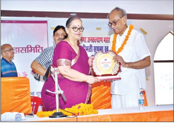
● बैठक में विस्तृत चर्चा के बाद कई प्रस्तावों को पारित किया गया

महासमिति ने सांसद व रक्षामंत्री राजनाथ सिंह की प्रति आभार व्यक्त किया कि उन्होंने लखनऊ को राज्य राजधानी क्षेत्र घोषित कराया। उन्होंने अन्तर्राष्ट्रीय स्तर का गोमती नगर