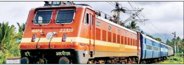
वरिष्ठ संवाददाता (vol)

लखनऊ। रेलवे प्रशासन द्वारा यात्री जनता को सुविधा हेतु पूर्व से चलाई जा रही 05062/05061 टनकपुर- अछनेरा-टनकपुर विशेष गाड़ी का अवधि विस्तार 04 अगस्त से 31 अक्टूबर तक किया जायेगा। अवधि विस्तार के फलस्वरूप यह गाड़ी टनकपुर एवं अछनेरा से 31 अक्टूबर तक प्रत्येक सोमवार, मंगलवार, बुधवार, शुकवार एवं शनिवार को (सप्ताह में पांच दिन) चलायी जायेगी। इस गाड़ी का मार्ग, ठहराव एवं कर संरचना पूर्ववत् रहेगा।