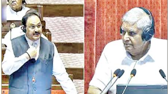
सिंह ने नड्डा, रीजीजू, गृह मंत्री अमित शाह, विदेश मंत्री एस जयशंकर, कृषि मंत्री शिवराज सिंह चौहान और कानून मंत्री अर्जुन राम मेघवाल सहित वरिष्ठ मंत्रियों के साथ बैठक की। इसके बाद नड्डा ने संवाददाताओं से बातचीत में यह बयान दिया। उपराष्ट्रपति धनखड़ ने सोमवार रात स्वास्थ्य कारणों का हवाला देते हुए इस्तीफा दे दिया। उन्होंने राष्ट्रपति द्रौपदी मुर्मु को अपना इस्तीफा भेजा और कहा कि वह तत्काल प्रभाव से पद छोड़ रहे हैं। कांग्रेस ने मंगलवार को दावा किया कि जगदीप धनखड़ को उपराष्ट्रपति पद से इस्तीफा देने के पीछे उनके द्वारा बताए गए स्वास्थ्य कारणों के अलावा कोई और अधिक गहरे कारण हैं। रमेश ने दावा किया कि नड्डा और रीजीजू के बीएसी की बैठक में शामिल न होने का धनखड़ को घुसा लगा।

नयी दिल्ली। केंद्रीय मंत्री जे.पी. नड्डा ने मंगलवार को कहा कि उपराष्ट्रपति कार्यालय को सूचित कर दिया गया था कि जगदीप धनखड़ द्वारा बुलाई गई कार्यमंत्रणा समिति (बीएसी) की बैठक में वह और संसदीय कार्य मंत्री किरेन रीजीजू शामिल नहीं हो पाएंगे। यह बैठक कुल शाम उपराष्ट्रपति के पद से इस्तीफा देने से कुछ समय पहले हुई थी। नड्डा की यह टिप्पणी कांग्रेस नेता जयराम रमेश द्वारा बीएसी बैठक में राज्यसभा में सदन के नेता और रीजीजू की अनुपस्थिति पर सवाल उठाए जाने के बाद आई है। रमेश के दावों के बारे में पूछे जाने पर केंद्रीय स्वास्थ्य मंत्री एवं भारतीय जनता पार्टी (भाजपा) के अध्यक्ष नड्डा ने कहा, उपराष्ट्रपति कार्यालय को बैठक में उपस्थित न हो पाने की हमारी असमर्थता के बारे में सूचित कर दिया गया था। रक्षा मंत्री राजनाथ