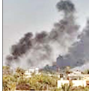
अमेरिका का डोनाल्ड ट्रंप प्रशासन इजराइल पर युद्ध समाप्त करने के लिए दबाव डाल रहा है और उसने अधीरता दिखायी है। सोमवार को, अमेरिकी राष्ट्रपति डोनाल्ड ट्रंप की प्रेस सचिव कैरोलिन लेविट ने कहा कि ट्रंप गाजा में एक कैथोलिक चर्च पर हाल ही में हुए इजराइली हमले से अर्चांभित थे। पिछले सप्ताह शीर्ष ईसाई पादरियों ने उस चर्च का दौरा किया और मंगलवार को यरुशलम में एक संवाददाता सम्मेलन में युद्ध समाप्त करने का आह्वान किया। स्वास्थ्य अधिकारियों का कहना

दीर अल-बलाह (गाजा पट्टी)। गाजा में इजराइली हमलों में कम से कम 20 लोग मारे गए हैं। यह जानकारी फलस्तीनी स्वास्थ्य अधिकारियों ने मंगलवार को दी। इजराइल ने उस क्षेत्र में नयी घुसपैठ की, जो 21 महीने के युद्ध के दौरान बड़े पैमाने पर लड़ाई से अछूता था। इजराइल के जमीनी आक्रमण का विस्तार ऐसे समय में हो रहा है जब इजराइल और हमस गाजा के लिए युद्ध विराम की शर्तों पर विचार कर रहे हैं, जिससे लड़ाई रुक जाएगी और कुछ बंधकों को रिहाई संभव हो सकेगी। वार्ता का नवीनतम दौर हफ्तों तक चला, लेकिन कोई सफलता के संकेत नहीं मिले, हालांकि वार्ताकारों ने उम्मीद जतायी है। इजराइल द्वारा गाजा के बड़े हिस्से पर अपना नियंत्रण बढ़ाने के साथ, सैनिकों की संभावित वापसी वार्ता में विवाद का एक प्रमुख मुद्दा है।