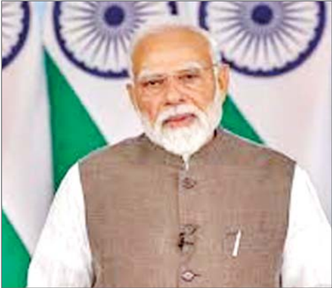
दोषरे को और विस्तृत करें, ताकि दोनों देशों को व्यापक विदेश नीति प्राथमिकताओं (जैसे अमेरिका और वैश्विक दक्षिण के साथ जुड़ाव) का बेहतर लाभ उठाया जा सके। भारत और ब्रिटेन ने छह मई को एक एफटीए पर सहमति व्यक्त की थी जिसका लक्ष्य 2030 तक दोनों अर्थव्यवस्थाओं के बीच व्यापार को दोगुना करके 120 अरब अमेरिकी डॉलर तक पहुंचाना है। इस समझौते के मसौदे की

लंदन। प्रधानमंत्री नरेन्द्र मोदी की बहुप्रतीक्षित ब्रिटेन यात्रा और मुक्त व्यापार समझौते (एफटीए) पर हस्ताक्षर से पहले, देश के प्रमुख थिंक टैंक ने मंगलवार को ब्रिटेन की हिंद प्रशांत रणनीति को नया स्वरूप देने का आह्वान किया। थिंक टैंक ने कहा कि यह रणनीति केवल व्यापार समझौते तक सीमित न रहकर भारत के साथ व्यापक साझेदारी को बढ़ावा देने वाली होनी चाहिए। रॉयल इंस्टीट्यूट ऑफ इंटरनेशनल अफेयर्स, जिसे आमतौर पर चैथम हाउस के नाम से जाना जाता है, ने ब्रिटेन के लिए हिंद-प्रशांत क्षेत्र को उच्च प्राथमिकता क्यों दी जानी चाहिए शीर्षक से एक शोध पत्र जारी किया है। इस शोध पत्र में चेतावनी दी है कि यदि रणनीति केवल द्विपक्षीय संबंधों पर केंद्रित रही और व्यापक दक्षिण एशियाई क्षेत्र की अनदेखी की गई, जो भारत जैसी आर्थिक विकास गति पर नहीं है, तो यह ब्रिटेन के क्षेत्रीय हितों के लिए सीमित प्रभाव वाली साबित हो सकती है। इसमें नयी दिल्ली के साथ ब्रिटेन के घनिष्ठ संबंधों को और मजबूत करने के लिए फ्रांस, ऑस्ट्रेलिया और अमेरिका जैसे अन्य देशों को शामिल करते हुए अधिक त्रिपक्षीय सहयोग का भी आह्वान किया गया है। लंदन स्थित इस थिंक टैंक के विश्लेषण में कहा गया है, दक्षिण एशिया में, भारत के साथ सीमित व्यापार समझौते को सफलतापूर्वक अंतिम रूप देने के बाद अब ब्रिटेन को चाहिए कि वह द्विपक्षीय सहयोग के