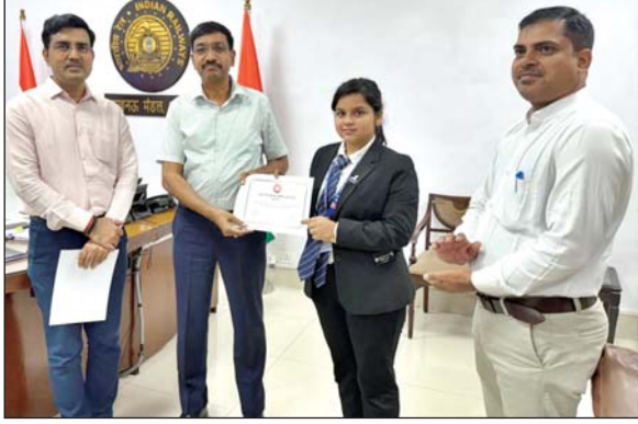
● बेहतर कार्य के लिए दिया गया नकद पुरस्कार