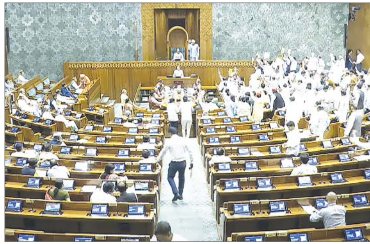
विधेयक 2025 विचार करने एवं पारित करने के लिए प्रस्ताव पेश करने को कहा। इसी बीच विपक्षी सदस्यों ने एसआईआर सहित विभिन्न मुद्दों पर चर्चा की मांग को लेकर हंगामा शुरू कर दिया और कुछ सदस्य आसन के समीप आ गए। उपसभापति ने सदस्यों से अपने स्थानों पर लौट जाने और सदन की कार्यवाही चलने देने की अपील की।