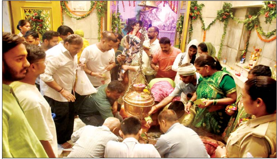
सावन के दूसरे सोमवार पर कोनेश्वर महादेव मंदिर में पूजा-अर्चना करते श्रद्धालु