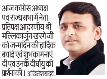
आज कांग्रेस अध्यक्ष एवं राज्यसभा में नेता प्रतिपक्ष आदर्शगोपी श्री मल्लिकार्जुन खरगे जी को जन्मदिन की हार्दिक बधाई एवं शुभकामनाएं दी एवं उनके दीर्घायु की प्रार्थना की। अखिलेश यादव