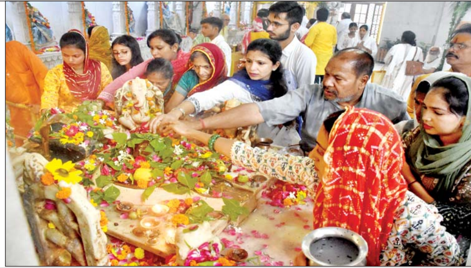
दूसरे सोमवार पर भगवान शिव की पूजा करते भक्तगण