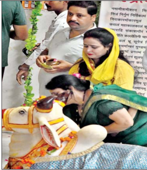
नंदी की पूजा करते भक्तगण