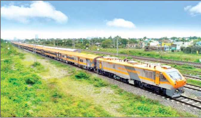
● 13435 मालदा टाउन-गोमती नगर अमृत भारत साप्ताहिक एक्सप्रेस 24 जुलाई से नियमित चनेगी