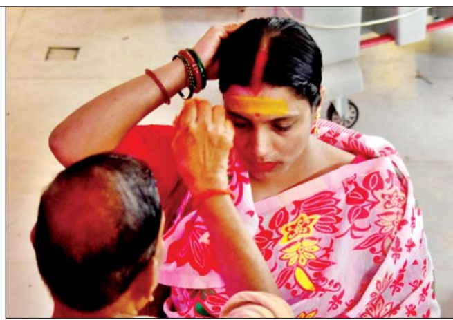
सावन का दूसरा मंगला गौरी व्रत आज