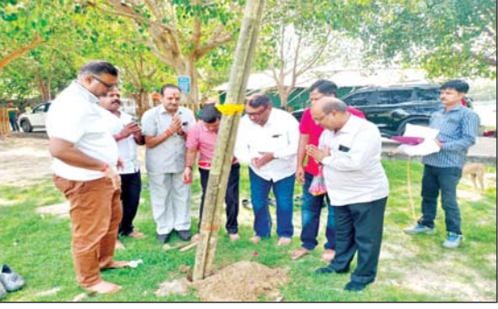
पंडाल बनाने के लिए कोलकाता से करीब 15 कारीगर आ चुके हैं जो गणेश उत्सव तक पंडाल को तैयार करेंगे।