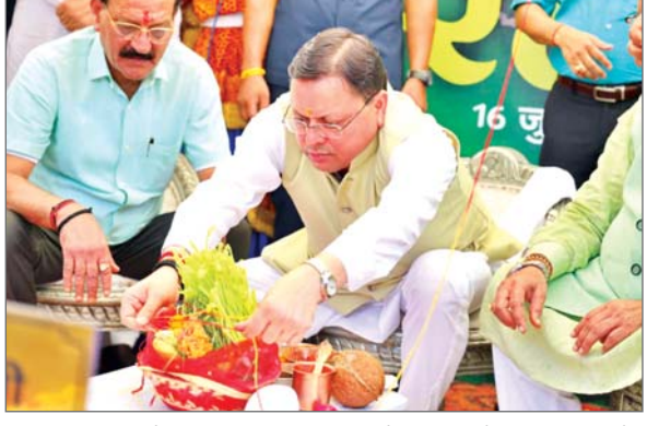
मुख्यमंत्री धामी ने कहा कि हरेला केवल एक उत्सव नहीं, बल्कि उत्तराखंड की संस्कृति और पर्यावरण चेतना का प्रतीक है।

धामी ने याद दिलाया पंचामृत संकल्प, हर अवसर पर लगायें एक पौधा प्रमुख संवाददाता देहरादून। उत्तराखंड के पारंपरिक पर्व हरेला के अवसर पर मुख्यमंत्री पुष्कर सिंह धामी ने गोरखा मिलिट्री इंटर कॉलेज परिसर में आयोजित राज्य स्तरीय पौधरोपण कार्यक्रम में हिस्सा लिया। इस दौरान उन्होंने रुद्राक्ष का पौधा रोपकर प्रदेशवासियों को हरेला पर्व की शुभकामनाएं दीं। कार्यक्रम की थीम थी हरेला मनाओ, धरती मां का ऋण चुकाओ। मुख्यमंत्री धामी ने कहा कि हरेला केवल एक उत्सव नहीं, बल्कि उत्तराखंड की संस्कृति और पर्यावरण चेतना का प्रतीक है। इस बार प्रदेशभर में लगभग पांच लाख पौधे रोपने का लक्ष्य रखा गया है। उन्होंने स्पष्ट किया कि यह अभियान केवल पौधरोपण तक सीमित नहीं रहेगा, बल्कि लगाए गए पौधों की नियमित देखभाल भी सुनिश्चित की जाएगी ताकि वे चूष बन सकें। उन्होंने बताया कि वन विभाग के हर डिवीजन में 50 प्रतिशत फलदार पौधे लगाए जा रहे हैं। इस अभियान में स्वयंसेवी संगठनों, छात्र-छात्राओं, महिला समूहों और पंचायतों की सहभागिता भी सुनिश्चित की जा रही है। उन्होंने प्रधानमंत्री नरेन्द्र मोदी के पंचामृत संकल्प, नेट जीरो इमिशन, लाइफस्टाइल ...शेष पृष्ठ 14 पर