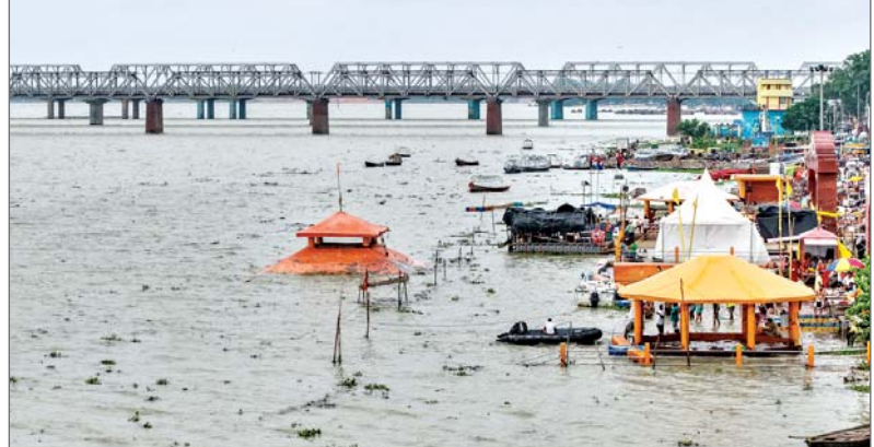
बांदा, चित्रकूट, कौशांबी, देहात, कानपुर नगर, रायबरेली, अमेठी, सहारनपुर, शामली, मुजफ्फरनगर, विजयनगर, अमरौहा, मुरादाबाद, रामपुर, बरेली, पीलीभीत, जालौन व आसपास के इलाकों में बाढ़ की चेतावनी जारी की गयी है।