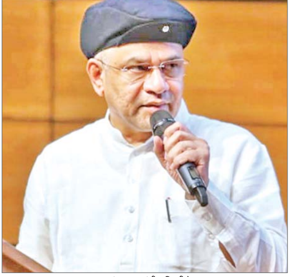
सूचना एवं प्रसारण मंत्री अश्विनी वैष्णव

एक प्रस्ताव पारित किया, जिसमें शुक्ला की अंतरिक्ष यात्रा को पूरे देश के लिए गर्व, गौरव और खुशी का क्षण बताया गया। इसमें कहा गया है कि इस यात्रा ने भारत की असीम आकांक्षाओं का प्रतिनिधित्व किया। सूचना एवं प्रसारण मंत्री अश्विनी वैष्णव ने बैठक में पारित संकल्प को पढ़ते हुए कहा, मंत्रिमंडल, अंतरराष्ट्रीय अंतरिक्ष स्टेशन पर अपने ऐतिहासिक 18 दिवसीय