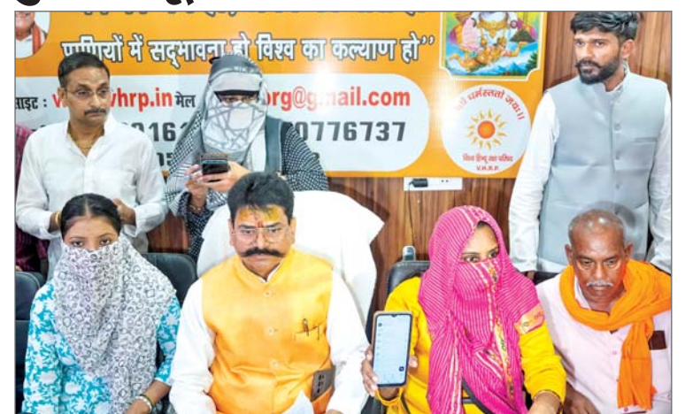
लिया गया है लेकिन उसके गिरोह के सक्रिय सदस्यों की गिरफ्तारी अभी बाकी है। उसने दावा किया कि हिंदू धर्म में वापसी के बाद उसे धमकियां मिल रही हैं। एक अन्य महिला ने आरोप लगाया कि उसे एक मुस्लिम व्यक्ति से शादी करने के लिए मजबूर किया गया ...शेष पृष्ठ 14 पर