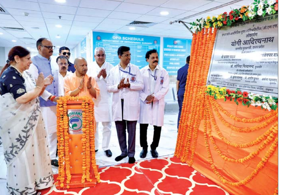
शुरूआत है। मुख्यमंत्री योगी आदित्यनाथ ने कहा कि जब कोविड-19 का प्रकोप प्रारंभ हुआ था, उस समय केजीएमयू प्रदेश का पहला संस्थान था, जहां कोविड जांच की सुविधा शुरू की गई। पहले 100 कोविड संदिग्ध मरीजों की जांच

विशेष संवाददाता लखनऊ। किंग जॉर्ज मेडिकल यूनिवर्सिटी (केजीएमयू) ने अपने 120 वर्षों की गौरवशाली यात्रा में एक और ऐतिहासिक अध्याय जोड़ते हुए चिकित्सा शिक्षा व स्वास्थ्य सेवाओं के क्षेत्र में नया क्रांतिमान स्थापित किया। मुख्यमंत्री योगी आदित्यनाथ ने सोमवार को केजीएमयू परिसर में 941 करोड़ की लागत से निर्मित 7 परियोजनाओं का लोकार्पण व शिलान्यास किया। इस अवसर पर उन्होंने वार्ड में जाकर न सिर्फ मरीजों का हालचाल लिया, बल्कि डॉक्टरों से संवाद करते हुए भावी स्वास्थ्य विस्तार की योजनाओं पर भी चर्चा की। कार्यक्रम को संबोधित करते हुए सीएम योगी ने कहा कि यह सिर्फ एक संस्थान नहीं, बल्कि एक युग की चिकित्सा परंपरा और राष्ट्र सेवा की प्रेरणा का प्रतीक है। 120 वर्ष की अपनी इस शानदार यात्रा में केजीएमयू ने अनेक मील के पथर गढ़े हैं। यह यात्रा सामान्य नहीं रही इसने पिछली सदी की महामारी से लेकर कोविड-19 जैसी वैश्विक त्रासदी का मुकाबला कर प्रदेश और देश का मार्गदर्शन किया।