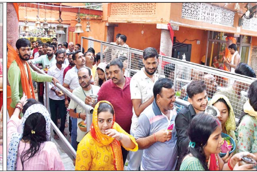
सावन के पहले सोमवार पर मनकामेश्वर मंदिर में लगी लंबी कतार