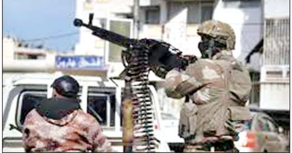
समूहों के साथ भी झड़प हुई। गृह मंत्रालय ने कहा है कि इस लड़ाई में 30

दमिश्क। इजराइल की सेना ने सोमवार को कहा कि उसने दक्षिणी सीरिया में सैन्य टैंकों पर हमला किया है, क्योंकि वहां सीरियाई सरकारी बलों और बेडौइन जनजातियों का झूज मिलिशिया के साथ संघर्ष हो रहा है। सीरिया के स्वीदा प्रांत में स्थानीय मिलिशिया और कबौलों के बीच लड़ाई में दर्जनों लोग मारे गए हैं। सोमवार को व्यवस्था बहाल करने के लिए भेजे गए सरकारी बलों की स्थानीय सशस्त्र