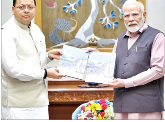
टेबल बुक, धारचूला का घी, पुरोला का लाल चावल, बासमती चावल, काला जीरा, गंध रैण, जम्बू और स्थानीय शहद शामिल थे। मुख्यमंत्री

प्रमुख संवाददाता नई दिल्ली/देहरादून। मुख्यमंत्री पुष्कर सिंह धामी ने नई दिल्ली में प्रधानमंत्री नरेंद्र मोदी से शिष्टाचार भेंट कर उत्तराखंड राज्य के समग्र विकास से जुड़े महत्वपूर्ण विषयों पर विचार-विमर्श किया। उन्होंने केंद्र सरकार के सतत सहयोग के लिए आभार प्रकट करते हुए कहा कि उत्तराखंड विकसित भारत 2047 के तहत संजीव भूमिका निभाने के लिए तत्पर है। मुख्यमंत्री ने प्रधानमंत्री को 27 देशों द्वारा प्रदान किए गए सर्वोच्च नागरिक सम्मानों के लिए बधाई दी और उन्हें उत्तराखंड की संस्कृति और परंपरा से जुड़े उपहार भेंट किये। इनमें कार्तिक स्वामी मंदिर का प्रतिरूप, आदि केलाश यात्रा पर आधारित कॉफी