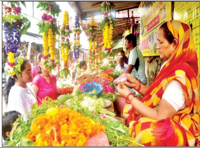
वरिष्ठ संवाददाता (vol)

लखनऊ। भगवान भोले का प्रिय श्रावण मास 11 जुलाई को शुरू हो चुका है, और 14 जुलाई को सावन का पहला सोमवार है, जो कि श्रावण मास की विशेष तिथि मानी जाती है। सावन के पहले सोमवार के लिए राजधानी के सभी शिवालय भोले बाबा का आराधना के लिए सजधज कर तैयार हैं। सोमवार भोर से ही शहर के सभी शिवालयों में बम-बम भोले की उदघोष से गूंज उठेंगे। शहर के सबसे प्राचीन शिव मंदिरों में से एक मनकामेश्वर में सुरक्षा के कड़े इंतजाम कर लिए हैं। इसी तरह कोनेश्वर मंदिर, चौपटिया स्थित छोटा शिवाला और बड़ा शिवाला भी भक्तों के लिए तैयार हैं।