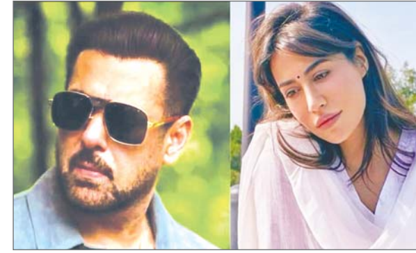
सलमान ने उनसे वादा किया था कि वह किसी अन्य फिल्म में उनके साथ काम जरूर करेंगे और अब अभिनेता ने अपना वादा निभा दिया है। चित्रांगदा ने इस भूमिका के लिए उन पर भरोसा किया। मुझे बैटल ऑफ गलवान जैसी महत्वपूर्ण और जबर्दस्त कहानी का हिस्सा बनने पर गर्व है। सलमान ने पिछले हफ्ते अपने सोशल मीडिया हैंडल पर एक पोस्ट के जरिये इस फिल्म को आधिकारिक घोषणा की थी।

मुंबई। अभिनेत्री चित्रांगदा सिंह ने शुक्रवार को कहा कि सलमान खान ने आगामी फिल्म बैटल ऑफ गलवान में उनके साथ काम करके अपना वादा निभाया है। शूटआउट एट लोखंडवाला से प्रसिद्धि पाने वाले अपूर्व लखिया द्वारा निर्देशित यह फिल्म भारत और चीन के सशस्त्र बलों के बीच 2020 के गलवान घाटी संघर्ष पर आधारित है। सलमान और चित्रांगदा फिल्म बैटल ऑफ गलवान में पहली बार साथ नजर आ रहे हैं। चित्रांगदा हजारां ख्वाहिर्से ऐसी, ये साली जिंदगी और देसी बॉयज जैसी फिल्मों के लिए जानी जाती हैं। एक बयान में अभिनेत्री ने कहा कि वह कई साल पहले सलमान खान के साथ एक मराठी प्रोजेक्ट में काम करने वाली थीं, लेकिन यह रद्द हो गया। चित्रांगदा ने कहा कि तब