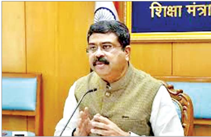
कोई वजुद ही नहीं है। ओडिशा के गरीबों, दलितों, आदिवासियों, किसानों और मजदूरों ने कांग्रेस को दशकों पहले नकार दिया था। उन्होंने कहा कि ऐसे में राहुल गांधी का ओडिशा के गरीबों के हित

प्रधान ने तंज कसा कि आज राहुल गांधी की स्थिति नाच न आवे आंगन टेढ़ा कहावत को चरितार्थ करती है। उन्होंने कहा कि यह संविधान बचाने के लिए नहीं है, बल्कि राहुल गांधी और कांग्रेस को बचाने के लिए है। प्रधान ने एक्स पर पोस्ट किया, राहुल गांधी और कांग्रेस अध्यक्ष मल्लिकार्जुन खरेगे जी द्वारा ओडिशा के भुवनेश्वर में आयोजित संविधान बचाओ रैली दरअसल कांग्रेस के शहजादे का एक और राजनीतिक पर्यटन था। यह संविधान बचाओ नहीं बल्कि राहुल गांधी और कांग्रेस बचाओ समावेश है। उन्होंने लिखा, ओडिशा में भाजपा की जनहितैषी सरकार के प्रति जनता का अडिग विश्वास कांग्रेस को परेशान कर रहा है। ओडिशा में कांग्रेस का