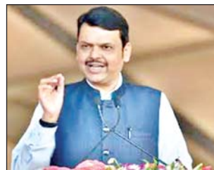
और पैसिव मिलिटेंसी पर केंद्रित वामपंथी उत्रावादी संगठनों की गैरकानूनी गतिविधियों को रोकने के उद्देश्य से लया गया यह विधेयक विधानसभा द्वारा पारित कर दिया गया है। इसके जल्द ही विधान परिषद में पेश किए जाने की उम्मीद है। पैसिव मिलिटेंसी, संघर्ष का एक तरीका है जिसमें लोग बिना हिंसा का सहारा लिए, सरकार या किसी अधिकार के खिलाफ अपनी असहमति व्यक्त करते हैं। फडणवीस महाराष्ट्र के गृहमंत्री भी हैं। उन्होंने चरमपंथी संगठनों से निपटने में इस विशेष विधेयक पर जोर दिया और गैरकानूनी गतिविधियों (रोकथाम) अधिनियम और महाराष्ट्र संगठित अपराध निवर्तन अधिनियम (मकोका) जैसे कड़े कानूनों की सीमाओं के बारे में बताया।

मुंबई। महाराष्ट्र के मुख्यमंत्री देवेंद्र फडणवीस ने शुक्रवार को वामपंथी संगठनों की गतिविधियों पर अंकुश लगाने संबंधी विधेयक को विधानसभा की मंजूरी मिलने की सराहना करते हुए कहा कि राज्य में सक्रिय लेकिन अन्य राज्यों में प्रतिबंधित ऐसे समूहों पर नकेल लगाने के लिए यह आवश्यक था। साथ ही मुख्यमंत्री ने इसके दुरुपयोग की आशंकाओं को दूर करने का प्रयास किया। फडणवीस ने बताया कि कम से कम छह ऐसे संगठन हैं जो अन्य राज्यों में प्रतिबंधित हैं, लेकिन महाराष्ट्र में अब भी सक्रिय हैं। उन्होंने कहा कि विशेष जन सुरक्षा विधेयक में पर्याप्त कानूनी सुरक्षा उपाय शामिल हैं। शहरी नक्सलवाद