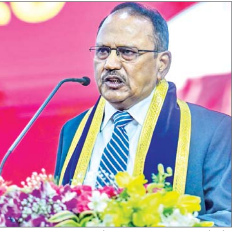
ने यह भी कहा कि तकनीक और युद्ध के बीच अहम संबंध है और देश को अपनी ज़रूरतों को पूरा करने के लिए स्वदेशी तकनीक विकसित करनी चाहिए। इससे पहले पद्म विभूषण से सम्मानित और

एजेंसी। चेन्नई। राष्ट्रीय सुरक्षा सलाहकार अजित डोभाल ने शुक्रवार को कहा कि भारत ने पाकिस्तान में नौ आतंकवादी ठिकानों पर सटीक हमला किया और उनमें से एक भी निशाना नहीं चुका। डोभाल ने सीमा पार के खतरों को बेअसर करने में भारत की क्षमता और तकनीकी कौशल पर गौरवान्वित महसूस किया। राष्ट्रीय सुरक्षा सलाहकार डोभाल ने कहा कि सटीकता इस स्तर की थी कि भारत को पता था कि कौन कहां है। उनके मुताबिक, पूरा ऑपरेशन सात मई को रात एक बजे के बाद शुरू हुआ और मुश्किल से 23 मिनट तक जारी रहा। आईआईटी मद्रास के 62वें दीक्षांत समारोह में डोभाल ने प्रश्नात्मक लहजे में कहा इसके बाद उन्होंने कहा कि पाकिस्तान ने ऐसा किया वगैरह वगैरह। क्या आप मुझे एक भी ऐसी तस्वीर दिखा सकते हैं जिसमें दिखाता हो कि भारत को इस दौरान कोई नुकसान हुआ है? पहल्याम में 22 अप्रैल को हुए आतंकवादी हमले के बाद भारत ने पाकिस्तान और पाकिस्तान के कब्जे वाले कश्मीर में आतंकवादी ठिकानों को निशाना बनाते हुए ऑपरेशन सिंदूर शुरू किया था। छात्रों को संबोधित करते हुए डोभाल