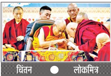
चिंतन • लोकमित्र

14वीं से 17वीं सदी तक इस परंपरा का प्रारंभिक काल था और उस जमाने के दलाई लामाओं का प्रभाव मुख्यतः धार्मिक हुआ करता था। राजनीतिक शक्ति उन दिनों तिब्बती राजा या मंगोल शासकों के पास होती थी। मगर 5वें दलाई लामा, जिन्से महान दलाई लामा