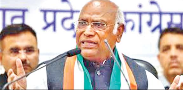
सरकार इस कानून को कमजोर करने की कोशिश कर रही है। उन्होंने दावा किया कि उद्योग के नाम पर भाजपा सरकार हर जगह जंगलों को नष्ट कर रही है... अगर दलित, आदिवासी और युवा अपने अधिकारों के लिए लड़ना नहीं सीखेंगे, तो वे उनका भी सफाया कर देंगे। खरेगे ने ओडिशा में भाजपा समर्थकों पर दलितों और सरकारी अधिकारियों पर हमला करने का भी आरोप

भुवनेश्वर। कांग्रेस अध्यक्ष मल्लिकार्जुन खरेगे ने शुक्रवार को आरोप लगाया कि भारतीय जनता पार्टी (भाजपा) नीत केंद्र सरकार संविधान से धर्मनिरपेक्षता और समाजवाद को हटाने का प्रयास कर रही है। खरेगे ने यहां पार्टी के संविधान बचाओ समावेश कार्यक्रम को संबोधित करते हुए यह भी कहा कि भाजपा के शासन में आदिवासी, दलित, महिलाएं और युवा सुरक्षित नहीं हैं। उन्होंने कहा कि भाजपा का मिशन संविधान को बदलना है... केंद्र की भाजपा सरकार हमारे संविधान से धर्मनिरपेक्षता और समाजवाद को हटाने का प्रयास कर रही है। खरेगे ने कहा कि कांग्रेस ने 2006 में गरीबों और आदिवासियों की रक्षा के लिए वन अधिकार अधिनियम पेश किया था। उन्होंने आरोप लगाया कि नरेन्द्र मोदी के नेतृत्व वाली