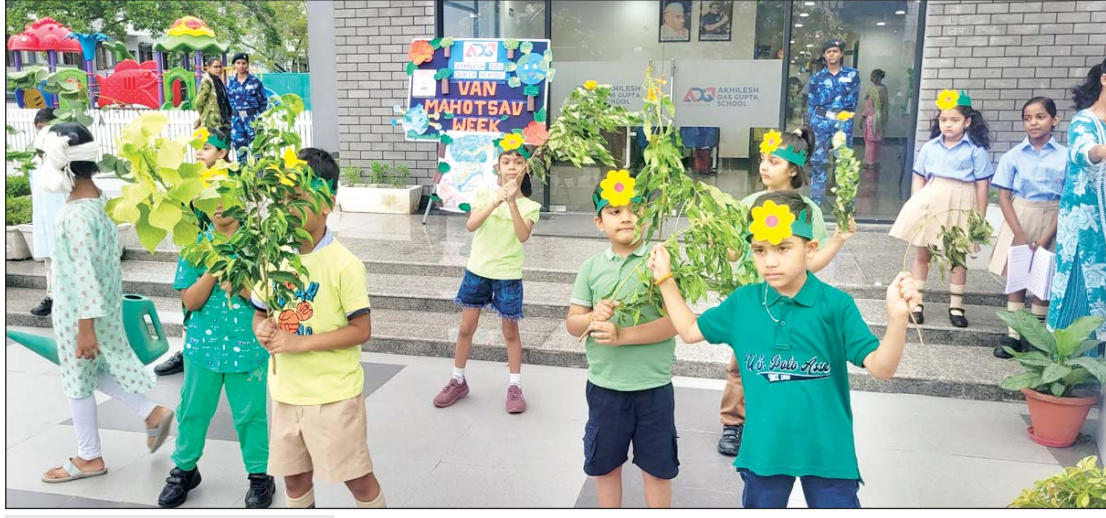
स्कूल में वन महोत्सव के तहत पांच दिवसीय कार्यशाला में छात्रों और शिक्षकों ने उत्साहपूर्वक लिया भाग