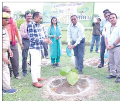
जिला संवाददाता (vol)

रायबरेली। वन महोत्सव जिसे पेड़ों का त्योहार के रूप में जाना जाता है। इसको आत्मसात करते हुए एनटीपीसी ऊंचाहार में प्रतिवर्ष की भांति इस वर्ष भी