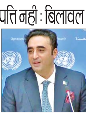
बिलावल भुट्टो ज़रदारी ने कहा है कि उनके देश को विश्वास बहाली के उपाय के रूप में जांच के दायरे में आए व्यक्तियों को भारत को प्रत्यर्पित करने में कोई आपत्ति नहीं है बशर्ते नवी दिल्ली इस प्रक्रिया में सहयोग करने की इच्छा दिखाए।

इस्लामाबाद। पाकिस्तान के पूर्व विदेश मंत्री बिलावल भुट्टो ज़रदारी ने कहा है कि उनके देश को विश्वास बहाली के उपाय के रूप में जांच के दायरे में आए व्यक्तियों को भारत को प्रत्यर्पित करने में कोई आपत्ति नहीं है बशर्ते नवी दिल्ली इस प्रक्रिया में सहयोग करने की इच्छा दिखाए। डॉन अखबार की खबर के अनुसार, पाकिस्तान पीपुल्स पार्टी के अध्यक्ष बिलावल ने शुक्रवार को अल जजीरा के साथ एक साक्षात्कार में यह टिप्पणी की। खबर में कहा गया कि लश्कर-ए-तैयबा (एलईटी) प्रमुख हाफिज सईद और जैश-ए-मोहम्मद (जेएम) प्रमुख मसूद अजहर को संभावित समझौते और सदभावनापूर्ण रुख के तहत भारत को प्रत्यर्पित करने के बारे में पूछे गए सवाल का जवाब देते हुए बिलावल ने यह टिप्पणी की। बिलावल ने कहा पाकिस्तान के साथ एक व्यापक वार्ता के हिस्से के रूप में, जहां आतंकवाद उन मुद्दों में से एक है जिन पर हम चर्चा करते हैं, मुझे यकीन है कि पाकिस्तान इनमें से किसी भी चीज का विरोध नहीं करेगा। राष्ट्रीय आतंकवाद निरोधक प्राधिकरण (नैक्टा) के अनुसार, लश्कर-ए-तैयबा और जैश-ए-मोहम्मद दोनों को पाकिस्तान ने प्रतिबंधित कर रखा है, जबकि 26/11 मुंबई आतंकी हमले का मुख्य षड्यंत्रकारी हाफिज सईद वर्तमान में