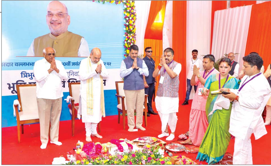
अमित शाह ने शनिवार को कहा कि गुजरात में सहकारी क्षेत्र के लिए बनने वाला देश का पहला राष्ट्रीय विश्वविद्यालय भाई-भतीजावाद को समाप्त करने का काम करेगा।

आणंद। केंद्रीय गृह एवं सहकारिता मंत्री अमित शाह ने शनिवार को कहा कि गुजरात में सहकारी क्षेत्र के लिए बनने वाला देश का पहला राष्ट्रीय विश्वविद्यालय भाई-भतीजावाद को समाप्त करने का काम करेगा क्योंकि भविष्य में इस क्षेत्र में केवल प्रशिक्षित व्यक्तियों को ही नौकरी मिलेगी। शाह आणंद कृषि विश्वविद्यालय के परिसर में जल एवं भूमि प्रबंधन संस्थान के परिसर में त्रिभुवन सहकारी विश्वविद्यालय (टीएसयू) की आधारशिला रखने के बाद एक सभा को संबोधित कर रहे थे। विश्वविद्यालय का नाम दिवंगत त्रिभुवनदास किशोर्भाई पटेल के नाम पर रखा गया है, जो भारत में सहकारी आंदोलन के प्रमुखों में से एक थे और जिन्होंने अमूल की नींव रखने में महत्वपूर्ण भूमिका निभाई थी।