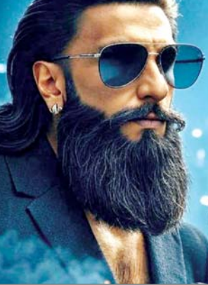
रणवीर सिंह का जन्मदिन खास बनाने की तैयारी में थे।

मुंबई। डायरेक्टर आदित्य धर इस साल रणवीर सिंह का जन्मदिन खास बनाने की तैयारी में थे। रणवीर सिंह का जन्मदिन 6 जुलाई को होता है और आदित्य धर का प्लान था कि जिओ स्टूडियोज और बी62 स्टूडियोज की अगली फिल्म 'धुरंधर' की एक खास यूनिट रणवीर को सरप्राइज गिफ्ट के तौर पर लांच की जाए। लेकिन यह खबर लीक हो गई और रणवीर तक पहुंच गई। रणवीर ने खुद आदित्य से पूछा कि क्या यह सच है। पहले आदित्य ने इस सवाल को टालने की कोशिश की, लेकिन रणवीर के बार-बार पूछने पर आदित्य ने मान लिया और उनसे कहा कि मुझे पर भरोसा करें और आधिकारिक फर्स्ट लुक के अनावरण तक इंतजार करें। प्रोडक्शन से जुड़े एक सूत्र के अनुसार, आदित्य इस सरप्राइज को लेकर बहुत उत्साहित थे। उन्होंने