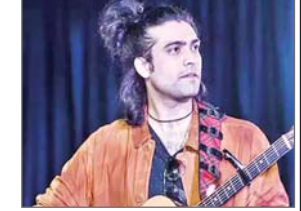
गायक जुबिन नौटियाल के मुताबिक अब वह दर्द भरे नठमों से हटकर उत्साहजनक और रोमांटिक संगीत की ओर रुख कर रहे हैं।

मुंबई। गायक जुबिन नौटियाल के मुताबिक अब वह दर्द भरे नठमों से हटकर उत्साहजनक और रोमांटिक संगीत की ओर रुख कर रहे हैं। नौटियाल को रातों रात लम्बियां, लूट गए हमनवा मेरे, तुझे कितने चाहने लगे हम और तुम ही आना जैसे लोकप्रिय गीतों के लिए जाना जाता है। नौटियाल ने को दिए साक्षात्कार में कहा पहले अलग-अलग संगीत विधाएं बहुत जटिल मानी जाती थीं। लेकिन पिछले 10 वर्षों में गीत-गाते में ये सब सीखा कि जब भी मैं कोई गाना रिकॉर्ड करता हूँ, तो बस यही सोचता हूँ कि क्या मैं इसे कर पाऊंगा। मैंने हर बार कोशिश की, चाहे वह सफल हो या असफल। उन्होंने कहा कि वह अब गायकी में नए आयाम तलाश रहे हैं।