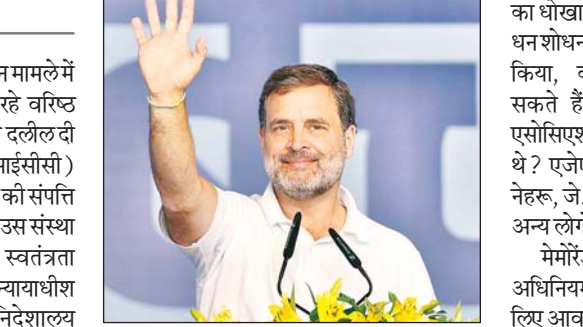
राहुल गांधी ने शनिवार को दलील दी कि अखिल भारतीय कांग्रेस कमेटी (एआईसीसी) एसोसिएटेड जर्नल्स लिमिटेड (एजेएल) की संपत्ति बेचने की कोशिश नहीं कर रही है, बल्कि उस संस्था को बचाने का प्रयास कर रही है, जो स्वतंत्रता आंदोलन का हिस्सा था।