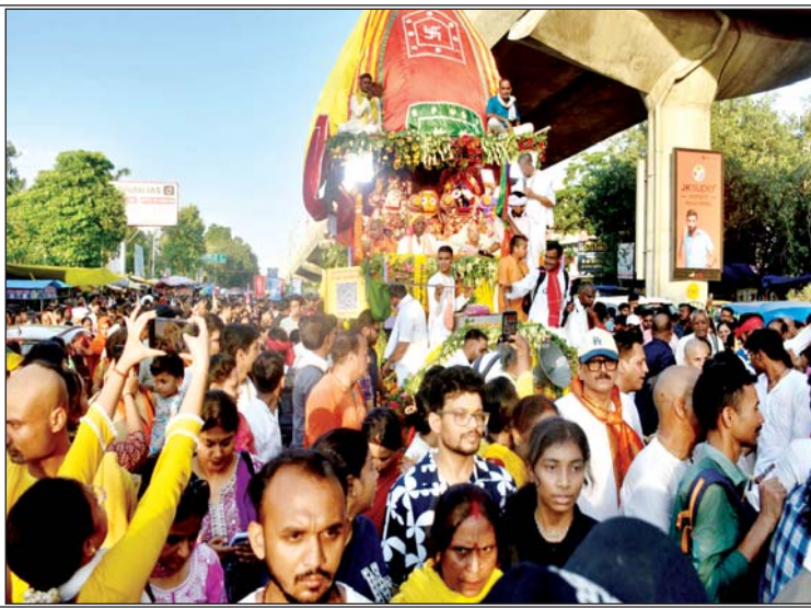
रवि-न्द्रालय चारबाग से निकली इस्कॉन मंदिर की रथयात्रा