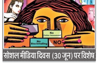
सोशल मीडिया दिवस (30 जून) पर विशेष

सोशल मीडिया के कुछ शिष्टाचार भी हैं, जो इस दिवस पर विशेषरूप से याद दिलाये जाते हैं- 1. ऑनलाइन बातचीत करते समय अपने वास्तविक रूप में रहें। 2. संबंध बनाने के लिए कंटेंट को लाइक करें, कमेंट करें और साझा करें। 3. ऑनलाइन बातचीत करते समय विनम्र और पेशेवर लहजे का प्रयोग करें।