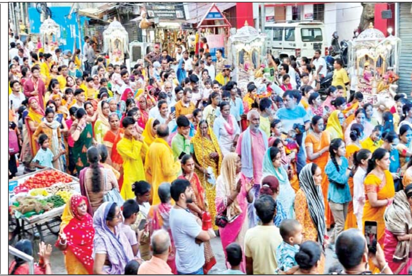
डॉलीगंज की रथयात्रा में उमड़ा भक्तों का हुआ