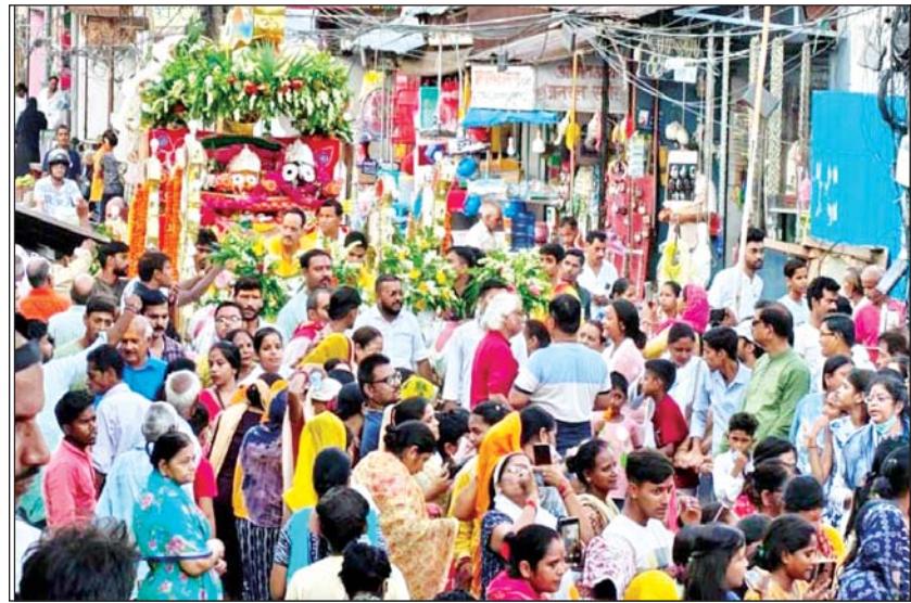
माधव मंदिर से निकली भगवान जगन्नाथ की रथयात्रा, उमड़ा हुआ