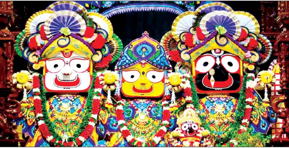
वरिष्ठ संवाददाता (vol)

लखनऊ। राजधानी में भगवान जगन्नाथ रथयात्रा की तैयारियां शुरू हो गई हैं। शहर में अभी नाबाद, मोतीनगर, अलीगंज व डालीगंज से भगवान की रथ यात्राएं निकाली जाती हैं। चौपटिया, रानी कटरा स्थित चारों धाम मंदिर की रथ यात्रा लगभग 123 वर्ष पुरानी है। रथयात्रा उत्सव 27 जुलाई को मनाया जाएगा। हिन्दी कैलेण्डर के अनुसार आषाढ़ मास की शुक्ल पक्ष की द्वितीया तिथि को यह यात्रा निकाली जाती है।