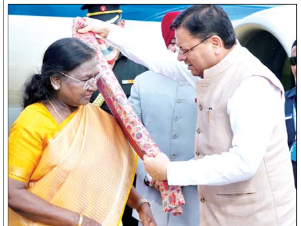
राष्ट्रपति द्रौपदी मुर्मू के उतराखंड आगमन पर स्वागत करते हुए मुख्यमंत्री पुष्कर सिंह धामी

का वर्ष घोषित किया गया है। इसी क्रम में उप्र में अखिल भारतीय कांग्रेस कमेटी के महासचिव, प्रभारी उत्तर प्रदेश अविनाश पाण्डेय और प्रदेश कांग्रेस अध्यक्ष अजय राय द्वारा प्रदेश में संगठन निर्माण के लिए एक चरणबद्ध तरीके से कार्यक्रम घोषित किया गया था। प्रदेश में संगठन निर्माण की कार्य प्रगति एवं उसकी समयबद्धता का आकलन करने के उद्देश्य से अखिल भारतीय कांग्रेस कमेटी के महासचिव, प्रभारी उत्तर प्रदेश अविनाश पाण्डेय एवं प्रदेश कांग्रेस अध्यक्ष अजय राय द्वारा 14 जून से लेकर 25 जून तक प्रदेश के सभी (पश्चिम, ब्रज, बुंदेलखंड, पूर्वांचल, अवध एवं प्रयाग) जोन के जिलों की जनपदवार जिला/शहर अध्यक्षों एवं कोऑर्डिनेटरों की समीक्षा बैठक ली। समीक्षा में पाया गया कि पार्टी के सभी पदाधिकारियों ने कार्यकर्ताओं ने निर्धारित समय सीमा में संगठन सुजन से जुड़े कार्यों को पूर्ण करने का प्रयास किया है।