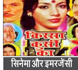
सिनेमा और इमरजेंसी