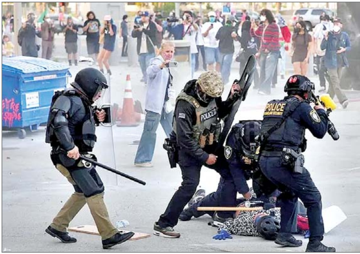
जारी कर ट्रंप प्रशासन के इस कदम का विरोध किया। लॉस एंजलिस के दक्षिण में लातिन मूल के वचन वाले पैरामाउंट शहर में होम डिपो से सं

विस्फोटक एवं प्रभावित करने वाले गोले छोड़े जबकि जवानों में प्रदर्शनकारियों ने भी सीमा गश्ती वाहनों पर पत्थरबाजी की और सड़कों पर कूड़ा जला कर अवरोध पैदा किया। आब्रजन अधिकारियों द्वारा शुक्रवार को की गई छापेमारी के बाद से इलाके में तनाव बढ़ गया है। अधिकारियों ने लॉस एंजलिस के फैंशन जिले और होम डिपो में छापेमारी भी शामिल थी। शहर में एक सप्ताह के दौरान गिरफ्तार किए गए अप्रवासियों की संख्या 100 से अधिक हो गई है। एक प्रमुख यूनिन नेता को विरोध प्रदर्शन करते समय गिरफ्तार कर लिया गया तथा उन पर कानून प्रवर्तन में बाधा डालने का आरोप लगाया गया। व्हाइट हाउस ने घोषणा की कि ट्रंप गार्ड को उस अराजकता से निपटने के लिए तैनात करेंगे जिसे पारंपरिक सुरक्षा बल नहीं संभाल पाएंगे। डेमोक्रेट गवर्नर न्यूसम ने सोशल मीडिया मंच एक्स पर एक पोस्ट में कहा कि यह जानबूझकर उठाया गया भड़काऊकदम है और इससे केवल तनाव बढ़ेगा।