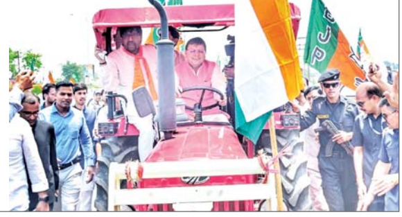
जिसका शुभारंभ मुख्यमंत्री पुष्कर सिंह धामी ने स्वयं ट्रैक्टर चलाकर किया। रैली स्थल पर आमजन का भारी सैलाब उमड़ा और रैली में हेलीकॉप्टर से पुष्पवर्षा की गई। इस अवसर पर मुख्यमंत्री धामी ने कहा कि प्रदेश में समान नागरिक संहिता कानून लागू कर संविधान निमार्ता डॉ. भीमराव अंबेडकर का सपना साकार किया गया है। यह कानून सभी धर्मों और वर्गों के लिए समान अधिकार और न्याय सुनिश्चित करता है। उन्होंने कहा कि यह रैली मेरा नहीं, बल्कि सवा करोड़ उत्तराखंडवासियों का सम्मान है। मुख्यमंत्री ने कहा कि प्रधानमंत्री नरेन्द्र मोदी के नेतृत्व में देश अभूतपूर्व प्रगति कर रहा है। किसानों के लिए अनेक ऐतिहासिक...शेष पृष्ठ 14 पर

प्रमुख संवाददाता हरिद्वार। प्रदेश में समान नागरिक संहिता कानून लागू कर संविधान निमार्ता डॉ. भीमराव अंबेडकर का सपना साकार किया गया है। यह कानून सभी धर्मों और वर्गों के लिए समान अधिकार और न्याय सुनिश्चित करता है। उन्होंने कहा कि यह रैली मेरा नहीं, बल्कि सवा करोड़ उत्तराखंडवासियों का सम्मान है। यह उद्गार मुख्यमंत्री पुष्कर सिंह धामी ने हरिद्वार के मंगलौर में आयोजित धन्यवाद रैली को संबोधित करते हुए व्यक्त किए। उत्तराखंड में समान नागरिक संहिता कानून लागू किए जाने के उपलक्ष्य में हरिद्वार के मंगलौर विधानसभा क्षेत्र में एक भव्य धन्यवाद रैली का आयोजन किया गया,