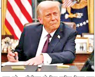
टीपीएस के लिए नामित किया गया था, यह निर्णय विनाशकारी भूकंप के बाद लिया गया था, जिसके परिणामस्वरूप वहां जीवन स्तर में काफी, लेकिन अस्थायी रूप से व्यवधान उत्पन्न हुआ था। अमेरिका के गृह मंत्रालय ने 26 अक्टूबर 2016 को इस दर्जे को और 18 महीने के लिए बढ़ाया और इसके बाद इस अवधि में कई बार विस्तार किया गया। इसके अनुसार, लगभग 12,700 नेपाली नागरिकों को यह दर्जा प्राप्त है, जिनमें से 5,500 से अधिक लोग अमेरिका के कानूनन स्थायी निवासी बन गए हैं। हालांकि, यह दर्जा समाप्त होने पर 7,000 से अधिक नेपालियों को स्वदेश लौटना पड़ेगा।

एजेंसी काठमांडू। ट्रम्प सरकार ने 2015 के विनाशकारी भूकंप के बाद नेपाल को दिया गया अस्थायी संरक्षित दर्जा (टीपीएस) समाप्त कर दिया है। अमेरिका के गृह मंत्रालय द्वारा शनिवार को जारी अधिसूचना में कहा गया कि इस वर्ष 24 जून को टीपीएस की मियाद समाप्त होने के बाद इसे नेपाल के लिए नहीं बढ़ाया जाएगा। हिमालयन टाइम्स में छपी खबर के मुताबिक, अमेरिका की गृह मंत्री क्रिस्टी नोएम ने कहा कि लाभाधिकार को मियाद समाप्त होने के बाद, पांच अगस्त तक 60 दिन का समय दिया जाएगा। टीपीएस, बिना किसी अन्य कानूनी दर्जे के निर्दिष्ट देशों से आने वाले आप्रवासियों को 18 महीने तक अमेरिका में रहने की अनुमति देता है तथा सामाजिक परिस्थितियों के कारण सुरक्षित वापसी में बाधा उत्पन्न होने पर कानूनी तौर पर काम करने की सुविधा भी देता है। नेपाल को सबसे पहले 24 जून 2015 को 18 महीने की अवधि के लिए टीपीएस के लिए नामित किया गया था, यह निर्णय विनाशकारी भूकंप के बाद लिया गया था, जिसके परिणामस्वरूप वहां जीवन स्तर में काफी, लेकिन अस्थायी रूप से व्यवधान उत्पन्न हुआ था। अमेरिका के गृह मंत्रालय ने 26 अक्टूबर 2016 को इस दर्जे को और 18 महीने के लिए बढ़ाया और इसके बाद इस अवधि में कई बार विस्तार किया गया। इसके अनुसार, लगभग 12,700 नेपाली नागरिकों को यह दर्जा प्राप्त है, जिनमें से 5,500 से अधिक लोग अमेरिका के कानूनन स्थायी निवासी बन गए हैं। हालांकि, यह दर्जा समाप्त होने पर 7,000 से अधिक नेपालियों को स्वदेश लौटना पड़ेगा।