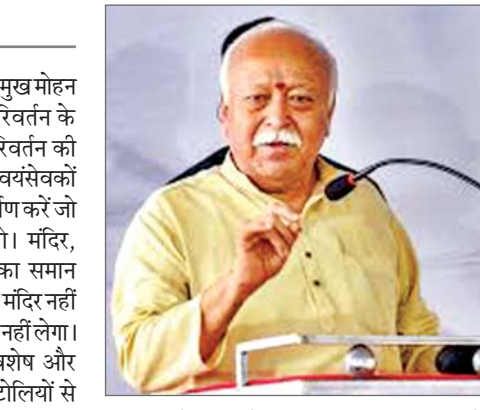
रविवार को सुबह से शाम तक संघ पदाधिकारियों के साथ भागवत की चार बैठकें हुईं। संघ शिक्षा वर्ग में शिक्षार्थियों से बातचीत के दौरान उन्होंने शिक्षार्थियों के कार्य क्षेत्र में संचालित हो रहे संघ कार्य, शाखाओं और सेवा कार्य की जानकारी भी ली। भागवत ने कहा कि शिक्षार्थी परिवार या समाज की ऐसी कड़ी होता है

जिला संवाददाता कानपुर। राष्ट्रीय स्वयंसेवक संघ के प्रमुख मोहन भागवत ने रविवार को कहा कि पंच परिवर्तन के आधार पर संपूर्ण समाज में एक बड़े परिवर्तन की ओर जाने का प्रयास हो रहा है। संघ और स्वयंसेवकों का दायित्व है कि वह ऐसे समाज का निर्माण करें जो जातिवाद की विषमताओं से मुक्त हो। मंदिर, जलाशय, श्मशान पर संपूर्ण समाज का समान अधिकार हो। ऐसा न हो कि अमुक व्यक्ति मंदिर नहीं जाएगा तो अमुक व्यक्ति जलाशय से पानी नहीं लेगा। बौद्धिक के दौरान संघ प्रमुख ने विशेष और सामान्य वर्ग के स्वयंसेवकों की चार टोलियों से अलग-अलग बात की। वह तीन दिवसीय कानपुर प्रवास पर हैं। आजदनगर स्थित दीनदयाल विद्यालय में भागवत ने कहा कि ऐसा समाज बनाए जो राष्ट्र के प्रति अपने दायित्व के लिए जागरूक हो। ऐसा समाज जो पर्यावरण के अनुकूल अपनी जीवनशैली का निर्माण करें। यह पंच परिवर्तन का मूल सार भी है।