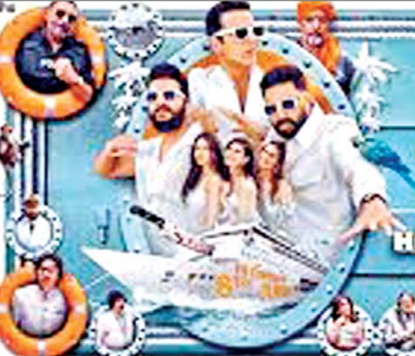
एक हॉरर फिल्म में नजर आ सकते हैं, जो लोक कथाओं पर आधारित होगी। मिड डे की रिपोर्ट के अनुसार, अक्षय को इस फिल्म की स्क्रिप्ट कुछ महीनों पहले मिल चुकी है। उन्होंने स्क्रिप्ट भी पसंद आ गई है। हालांकि, अभी उन्होंने फिल्म को आधिकारिक तौर पर साइन नहीं किया है। रिपोर्ट में आगे बताया गया है कि सिद्धार्थ आनंद की यह हॉरर फिल्म बाप-बेटी की कहानी पर आधारित होगी, जिसमें वीएफएक्स का बड़े पैमाने पर इस्तेमाल किया जाएगा। इसी के चलते इन दिनों अक्षय कुमार 'ओपमजी 3', 'जंगल' और 'मैड डॉक' की हॉरर यूनिवर्स से जुड़ी एक फिल्म की तैयारी में भी जुटे हुए हैं। अक्षय कुमार, अभिषेक बच्चन और रितेश देशमुख के अलावा करीब एक दर्जन स्टार्स से सजी फिल्म 'हाउसफुल 5' आज रिलीज हो चुकी है। इस फिल्म की लेंथ 2 घंटा 45 मिनट है।

मुंबई। अक्षय कुमार की फिल्म 'हाउसफुल 5' ने रिलीज के दो दिनों में अब तक भारतीय बॉक्स ऑफिस पर 56 करोड़ रुपए का कलेक्शन कर लिया है। मेकर्स की ओर से शेयर की गई जानकारी के मुताबिक, मास्क लगाकर रिव्यू लेने पहुंचे अक्षय कुमार, एक्शन-कॉमेडी के बाद हॉरर फिल्म में नजर आएंगे एक्टर?