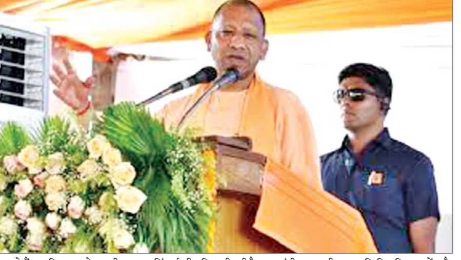
करीब 85 हजार करोड़ रुपए भेजे गए हैं। मुख्यमंत्री ने कहा, वर्ष 2017 में हमने सबसे पहले 86 लाख किसानों का 36000 करोड़ रुपये का कर्ज माफ किया। इसके अलावा अब तक 23 लाख हेक्टेयर भूमि को अतिरिक्त सिंचाई की सुविधा दी गयी है। मुख्यमंत्री ने मक्का के लिये खरीद केन्द्र स्थापित करने का ऐलान करते हुए कहा, हम औरैया के किसानों को इस बात के लिए आश्चस्त करेंगे कि बहुत जल्द हम इसके लिए कय केंद्र स्थापित करके न्यूनतम समर्थन मूल्य की भी घोषणा करने वाले हैं। उन्होंने कहा कि केंद्र और राज्य की डबल इंजन की सरकार ने

एजेंसी औरैया। उत्तर प्रदेश के मुख्यमंत्री योगी आदित्यनाथ ने रविवार को दावा किया कि वर्ष 2014 में नरेन्द्र मोदी के प्रधानमंत्री बनने के बाद पहली बार किसान सरकार के राजनीतिक एजेंडा का हिस्सा बने और उनके लिये विभिन्न नवोन्मेषी योजनाएं लागू की गयीं। मुख्यमंत्री ने विकसित कृषि संकल्प अभियान के तहत औरैया में आयोजित कार्यक्रम को संबोधित करते हुए कहा कि अन्नदाता किसान भी किसी सरकार के राजनीतिक एजेंडा का हिस्सा बन सकता है, यह आपको पहली बार वर्ष 2014 में देखने को मिला होगा, जब प्रधानमंत्री नरेन्द्र मोदी ने साइल हेल्थ कार्ड की व्यवस्था शुरू की थी। उन्होंने कहा कि पहले कृषि वैज्ञानिकों के अलावा और कोई भी साइल हेल्थ कार्ड के बारे में जानता ही नहीं था। उसके बाद प्रधानमंत्री कृषि सिंचाई की योजना और फिर प्रधानमंत्री कृषि बीमा योजना शुरू की गयी। आज प्रधानमंत्री किसान सम्मान निधि का लाभ देश के 12 करोड़ किसान प्राप्त