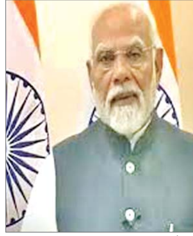
प्रधानमंत्री पहले की ही तरह मजबूत स्थिति में और पूरे आत्मविश्वास के साथ नेतृत्व करते नजर आ रहे हैं। वही, उनके दो प्रमुख सहयोगी (नायडू और कुमार), जिन्हें विपक्ष बैसाखा बत रहा था, न केवल भरोसेमंद साबित हुए हैं, बल्कि जमकर मोदी के नेतृत्व की सरहना

एजेंसी नयी दिल्ली। प्रधानमंत्री नरेन्द्र मोदी ने नौ जून 2024 को जब तीसरे कार्यकाल के लिए शपथ ली थी, तो उस वकत राहुल गांधी बेहद उत्साहित नजर आये थे क्योंकि लोकसभा चुनाव में भाजपा अपने दम पर बहुमत हासिल करने से चूक गई थी, जबकि चुनाव प्रचार अभियान के दौरान उसने 543 सदस्यीय निचले सदन में 400 से अधिक सीट जीतने का दावा किया था। लोकसभा चुनाव परिणाम के बाद आलोचकों ने भारतीय जनता पार्टी (भाजपा) सरकार की तेदेपा प्रमुख चंद्रबाबू नायडू और जदयू नेता नीतीश कुमार पर निर्भरता को रेखांकित किया था। आलोचकों ने कहा था कि नायडू और कुमार का गठबंधन बदलने का इतिहास रहा है और उत्तर प्रदेश तथा महाराष्ट्र जैसे बड़े राज्यों में लोकसभा चुनाव में इसका (भाजपा) प्रदर्शन उम्मीद से कम रहा है, जिससे भविष्य में राजनीतिक उथल-पुथल की संभावना है। कांग्रेस के एक नेता ने कहा था, हमने मोदी को मनोवैज्ञानिक रूप से खत्म कर दिया है। उनकी सरकार को जल्द ही सत्ता से हटा दिया जायेगा। सोमवार को मोदी सरकार अपने तीसरे कार्यकाल की पहली वर्षगांठ तथा कुल मिलाकर 11वीं वर्षगांठ मनायेगी और