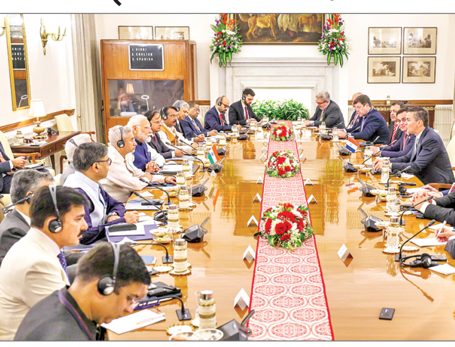
पूर्ण सत्र को संबोधित करते हुए कहा कि 2014 में भारत में 96 एमआरओ सुविधाएं थीं, जो अब बढ़कर 154 हो गई हैं। इसके अलावा स्वतः मंजूर मार्ग के तहत 100 प्रतिशत प्रत्यक्ष विदेशी निवेश (एफडीआई), माल एवं सेवा कर (जीएसटी) में

प्रधानमंत्री ने उभरते क्षेत्र रखरखाव और मरम्मत (एमआरओ) का जिक्र करते हुए कहा कि भारत विमान रखरखाव के लिए वैश्विक केंद्र बनने के प्रयासों में तेजी ला रहा है। उन्होंने अंतरराष्ट्रीय हवाई परिवहन संघ (आईएटीए) की 81वीं वार्षिक आम बैठक और विश्व हवाई परिवहन शिखर सम्मेलन (डब्ल्यूएटीएस) के