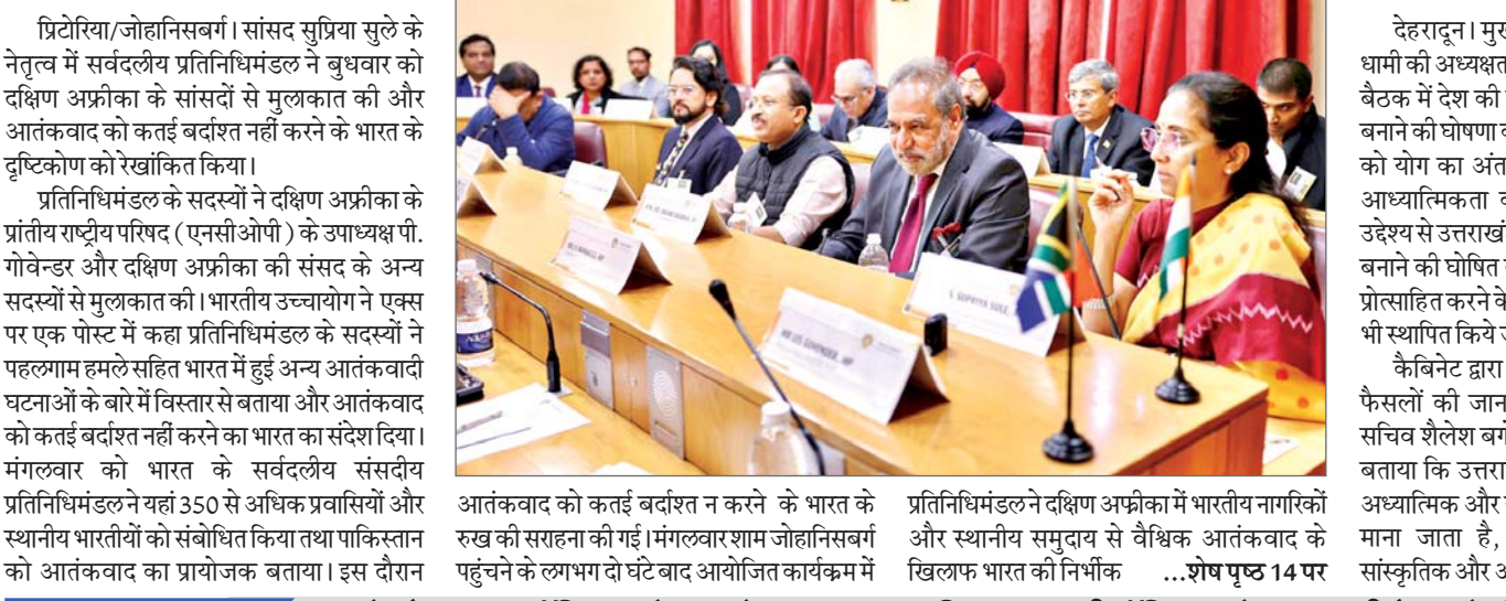
आतंकवाद को कतई बर्दाश्त न करने के भारत के रुख की सराहना की गई। मंगलवार शाम जोहानिसबर्ग में भारतीय प्रतिनिधिमंडल ने दक्षिण अफ्रीका में भारतीय नागरिकों और स्थानीय समुदाय से वैश्विक आतंकवाद के खिलफ भारत की निर्भीक ...शेष पृष्ठ 14 पर

भारतीय प्रतिनिधिमंडल ने 350 से अधिक प्रवासियों व अन्य को किया संबोधित