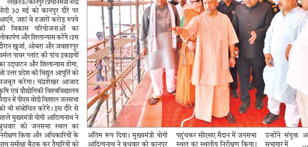
अंतिम रूप दिया। मुख्यमंत्री योगी आदित्यनाथ ने बुधवार को कानपुर पहुंचकर सीएसए मैदान में जनसभा स्थल का स्थलीय निरीक्षण किया। उन्होंने संयुक्त आयुक्त उद्योग के सभागार में ...शेष पृष्ठ 14 पर

मुख्यमंत्री ने अधिकारियों के साथ समीक्षा बैठक में दिए सुरक्षा और स्वच्छता के कड़े निर्देश