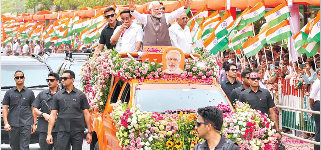
उन्होंने कहा इससे साबित होता है कि ये आतंकवादी गतिविधियां सिर्फ परोक्ष युद्ध नहीं हैं, बल्कि उनकी ओर से सोची-समझी युद्ध रणनीति है। अगर वे युद्ध में शामिल होते हैं, तो जवाब भी उसी के अनुसार होगा। पहलगाम में आतंकवादी हमले के जवाब में पाकिस्तान में आतंकवादी टिकानों पर हमल करने के लिए भारतीय सशस्त्र बलों द्वारा ऑपरेशन सिंदूर चलाए जाने के बाद मोदी अपनी पहली यात्रा पर गुजरात पहुंचे थे। मोदी ने कहा कि वडोदरा, दाहोद, भुज, अहमदाबाद और गांधीनगर की यात्रा के दौरान उन्हें ऑपरेशन सिंदूर की सफलता की गर्जना के साथ देशभक्ति का जोश महसूस हुआ, तथा यह भावना पूरे देश में देखी जा सकती है। प्रधानमंत्री ने कहा कि एक कांट लगातार दर्द दे सकता है, भले ही शरीर कितना भी मजबूत क्यों न हो। उन्होंने कहा कि भारत ने आतंकवाद के कांटे को निकालने का मन बना लिया और इसे पूरी दृढ़ता के साथ किया। उन्होंने आजादी के तुरंत बाद कश्मीर में हुई चुस्पैट का जिक्र करते हुए कहा, हमें 1947 में कश्मीर में

एजेंसी गांधीनगर। प्रधानमंत्री नरेंद्र मोदी ने मंगलवार को कहा कि पाकिस्तान द्वारा पोषित आतंकवाद कोई परोक्ष युद्ध नहीं, बल्कि एक सोची-समझी युद्ध रणनीति है और भारत उसी के अनुसार जवाब देगा। यहां गुजरात सरकार के एक कार्यक्रम को संबोधित करते हुए उन्होंने देश की अर्थव्यवस्था को बढ़ावा देने के लिए भारतीय उत्पादों की खरीद की वकालत की। पाकिस्तान में गैर-सरकारी और सरकारी तत्वों के बीच कोई अंतर नहीं करने का जिक्र करते हुए मोदी ने कहा कि पड़ोसी देश आतंकवाद को समर्थन जारी रखते हुए युद्ध में संलग्न हैं। मोदी ने यहां गुजरात सरकार के शहरी विकास कार्यक्रम में कहा वसुधैव कुटुम्बकम् हमारा संस्कार है, हम अपने पड़ोसियों के लिए भी खुशी चाहते हैं, लेकिन यदि आप हमारी ताकत को चुनौती देंगे तो भारत भी वीरों की भूमि है। प्रधानमंत्री ने कहा हम इसे परोक्ष युद्ध नहीं कह सकते, क्योंकि छह मई की रात (पाकिस्तान में आतंकी टिकानों पर भारतीय हमलों में) मारे गए लोगों को पाकिस्तान में राजकीय सम्मान दिया गया। उनके ताबूतों पर पाकिस्तानी झंडे लपेटे गए और सेना ने उन्हें सलामी दी।