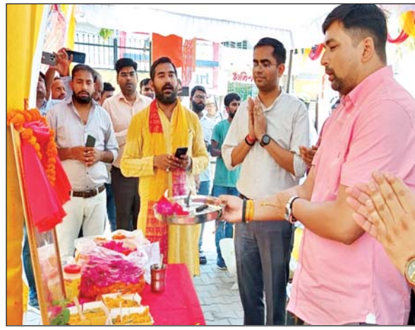
जिला संवाददाता (VOL)

सीतापुर। बड़े मंगलवार को पूरे जिला राम और हनुमान धुन में लयलीन रहा है। पूरे शहर में जगह जगह भण्डारे का आयोजन किया गया। सुबह से लेकर देररात में मंदिरों में भीड़ उमड़ी रही। हरदोई चुगी, कैचिपुल, मन्नी चौराहा, श्यामनाथ पुलिस लाइन, लालबाग, जेलरोड, ट्रांसपोर्ट, लोहारबाग, आवास विकास कांशीराम कालोनी सहित जगह जगह स्टाल लगाकर भण्डारे