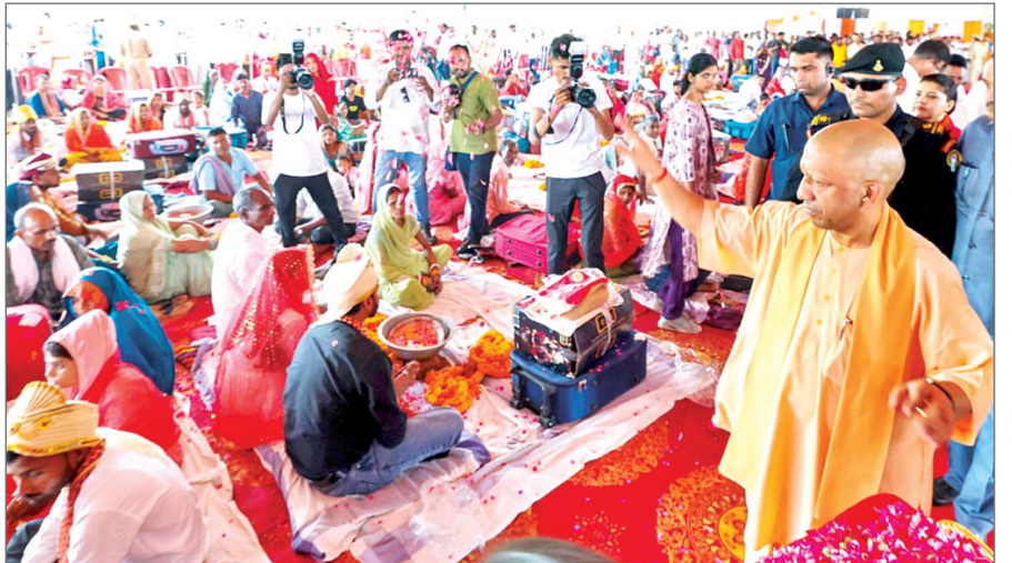
कर रहे थे। योगी सरकार ने सामूहिक विवाह योजना में प्रति जोड़ा खर्च 51 हजार रुपये से बढ़ाकर एक लाख रुपये कर दिया है और बढ़ी हुई धनराशि के साथ आज यह पहला आयोजन था। कार्यक्रम में मुख्यमंत्री

जिला संवाददाता, गोरखपुर। मुख्यमंत्री योगी आदित्यनाथ ने कहा कि जब अच्छी सरकार होती है तो वह विकास और गरीब कल्याण के कार्यक्रमों को तेजी से आगे बढ़ाते हुए समृद्धि का मार्ग प्रशस्त करती है। सुरक्षा के बेहतर माहौल में हरेक व्यक्ति के जीवन में सकारात्मक, विकासपरक और कल्याणकारी परिवर्तन लाती है। प्रधानमंत्री नरेंद्र मोदी के मार्गदर्शन में विगत 11 साल से देश में और आठ साल से प्रदेश में यही परिवर्तन देखने को मिल रहा है।