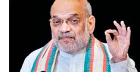
नवी दिल्ली। केंद्रीय गृहमंत्री अमित शाह ने शुक्रवार को सभी भूमिगत नक्सलियों से यथाशीघ्र आत्मसमर्पण करने और मुख्यधारा में शामिल होने का आह्वान करते हुए कहा कि सरकार 31 मार्च 2026 से पहले देश को नक्सलवाद के अभिशाप से मुक्त करने के लिए प्रतिबद्ध है।

कुख्यात नक्सलियों को गिरफ्तार किया है उन्होंने कहा कि सुकमा के बड़े सेट्टी पंचायत में 11 नक्सलियों ने आत्मसमर्पण किया है, जिससे यह पंचायत पूरी तरह नक्सल-मुक्त हो गई है। शाह ने सोशल मीडिया मंच पर एक पोस्ट में कहा, छिपे हुए नक्सलियों से मेरी अपील है कि मोदी सरकार को आत्मसमर्पण नीति को अपनाकर यथाशीघ्र हथियार डालें और मुख्यधारा में शामिल हों। इकतीस मार्च 2026 से पहले हम देश को नक्सलवाद के देश से मुक्त करने के लिए संकल्पित हैं। गृहमंत्री ने मध्य प्रदेश के नीचम में बुधस्वतिवार को केंद्रीय रिजर्व पुलिस बल (सीआरपीएफ) के स्थापना दिवस समारोह को संबोधित करते हुए कहा कि नक्सलवाद अब भारत के सिर्फ चार जिलों तक सीमित रह गया है। नक्सलवाद भारत के सिर्फ चार जिलों तक सीमित रह गया है। प्रधानमंत्री नरेंद्र मोदी ने कहा है कि 31 मार्च 2026 तक देश से यह समस्या समाप्त हो जाएगी। सीआरपीएफ (केंद्रीय सशस्त्र पुलिस बल) और सीआरपीएफ, विशेषकर इसके कोबा बटालियन देश से नक्सलवाद को खत्म करने में प्रमुख भूमिका निभा रही है।