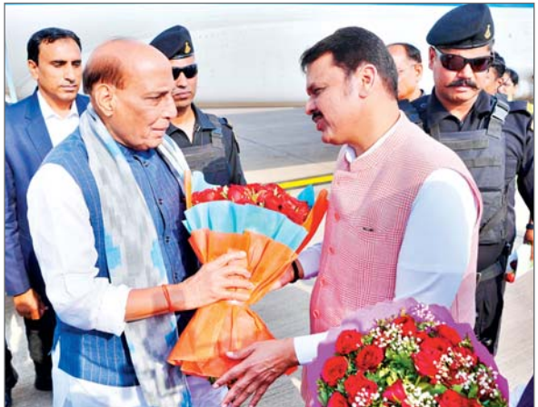
रक्षा मंत्री राजनाथ सिंह ने शुक्रवार को कहा कि सरकार देश को रक्षा क्षेत्र में आत्मनिर्भर बनाने के लिए प्रतिबद्ध है और इस दिशा में पहले ही कई कदम उठाए जा चुके हैं। सिंह ने यहां उद्योग प्रतिनिधियों को संबोधित करते हुए कहा कि रक्षा निर्यात 2014 के 600 करोड़ रुपये से बढ़कर 24,000 करोड़ रुपये हो गया है। उन्होंने कहा, हमारा लक्ष्य 2029-30 तक 50,000 करोड़ रुपये का निर्यात हासिल करना है। उन्होंने कहा कि भारतीय जनता पार्टी (भाजपा) के नेतृत्व वाली सरकार ने आत्मनिर्भरता हासिल करने के लिए कई बड़े कदम उठाए हैं और ऐसी चीजों की घोषणा की है, जो देश में ही निर्मित होंगी और जिनका आयात नहीं किया जाएगा। रक्षा मंत्री ने कहा कि वर्तमान में रक्षा उत्पादन 1.60 लाख करोड़ रुपये है और इसे बढ़ाकर तीन लाख करोड़ रुपये करने का लक्ष्य है। सिंह ने कहा उन्हें छत्रपति संभाजीनगर में उत्पादन केंद्र के रूप में अच्छी संभावनाएं ...शेष पृष्ठ 10 पर

एजेंसी छत्रपति संभाजीनगर (महाराष्ट्र)। रक्षा मंत्री राजनाथ सिंह ने शुक्रवार को कहा कि सरकार देश को रक्षा क्षेत्र में आत्मनिर्भर बनाने के लिए प्रतिबद्ध है और इस दिशा में पहले ही कई कदम उठाए जा चुके हैं। सिंह ने यहां उद्योग प्रतिनिधियों को संबोधित करते हुए कहा कि रक्षा निर्यात 2014 के 600 करोड़ रुपये से बढ़कर 24,000 करोड़ रुपये हो गया है। उन्होंने कहा, हमारा लक्ष्य 2029-30 तक 50,000 करोड़ रुपये का निर्यात हासिल करना है। उन्होंने कहा कि भारतीय जनता पार्टी (भाजपा) के नेतृत्व वाली सरकार ने आत्मनिर्भरता हासिल करने के लिए कई बड़े कदम उठाए हैं और ऐसी चीजों की घोषणा की है, जो देश में ही निर्मित होंगी और जिनका आयात नहीं किया जाएगा। रक्षा मंत्री ने कहा कि वर्तमान में रक्षा उत्पादन 1.60 लाख करोड़ रुपये है और इसे बढ़ाकर तीन लाख करोड़ रुपये करने का लक्ष्य है। सिंह ने कहा उन्हें छत्रपति संभाजीनगर में उत्पादन केंद्र के रूप में अच्छी संभावनाएं ...शेष पृष्ठ 10 पर