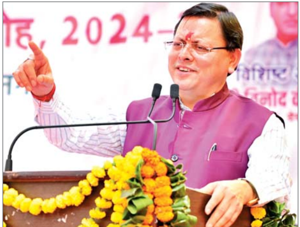
मुख्यमंत्री पुष्कर सिंह धामी ने एचएनबी गढ़वाल विश्वविद्यालय छात्रसंघ समारोह का किया शुभारंभ

मुख्यमंत्री ने एचएनबी गढ़वाल विश्वविद्यालय छात्रसंघ समारोह का किया शुभारंभ प्रमुख संवाददाता देहरादून। मुख्यमंत्री पुष्कर सिंह धामी ने सख्त नकल विरोधी कानून को लागू करने के निर्णय को ऐतिहासिक बताते हुए कहा कि इससे मेहनती और प्रतिभाशाली छात्रों को उनका हक मिलने लगा है। यह विचार मुख्यमंत्री पुष्कर सिंह धामी ने हेमवती नंदन बहुगुणा गढ़वाल केंद्रीय विश्वविद्यालय परिसर, श्रीनगर में आयोजित छात्रसंघ शुभारंभ समारोह को संबोधित करते हुए व्यक्त किए। मुख्यमंत्री ने कहा कि सरकार वर्तमान में मांडल कॉलेज, महिला छात्रावास, आईटी लैब, परीक्षा भवन, एस्ट्रो पार्क और साइंस सिटी जैसी महत्वपूर्ण परियोजनाओं पर कार्य कर रही है। इसके अतिरिक्त, राज्य में स्टार्टअप के ...शेष पृष्ठ 10 पर