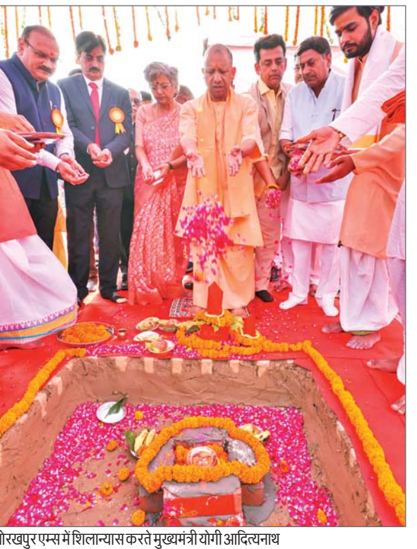
गोरखपुर एम्स में शिलान्यास करते मुख्यमंत्री योगी आदित्यनाथ