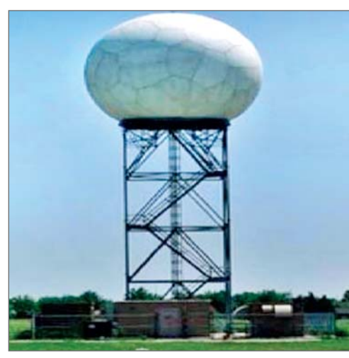
पूर्वानुमान के लिए मौसम केंद्र लखनऊ में एस-बैंड आधारित डॉप्लर रडार है। पश्चिमी भाग का पूर्वानुमान दिल्ली के और पूर्वी