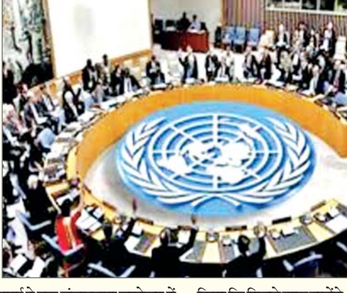
संयुक्त राष्ट्र सुरक्षा परिषद में सुधार पर अंतरसरकारी वार्ता (आईजीएन) के अध्यक्ष ने बुधस्वतिवार को कहा कि यदि विश्व निकाय के सुरक्षा परिषद के विस्तार पर निर्णय लिया जाता है तो निश्चित रूप से भारत इसका एक प्रमुख दावेदार होगा।