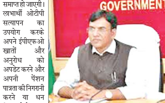
मनसुख मांडविया ने साक्षात्कार में कहा कि आने वाले दिनों में ईपीएफओ लाभार्थी नए संस्करण 3.0 पर दावों के तेजी से निपटन के कारण एटीएम से राशि निकाल सकेंगे। उन्होंने कहा कि ईपीएफओ जल्द ही एक मजबूत आईटी मंच का संस्करण 3.0 लागू करेगा, जिससे स्वतः दावा निपटन, डिजिटल सुधार और एटीएम आधारित धन निकासी सहित निर्बाध और सरलकृत सेवाएं प्रदान की जा सकेंगी। इस बदलाव का उद्देश्य ईपीएफओ को सुलभ और कुशल बनाना है। मांडविया के अनुसार, नए संस्करण में जटिल और लंबी, आवेदन भरने की प्रक्रिया या दावों और सुधारों के लिए कार्यालय में जाने की जरूरत समाप्त हो जाएगी।

रांची। केंद्रीय श्रम एवं रोजगार मंत्री मनसुख मांडविया ने शुक्रवार को कहा कि कर्मचारी भविष्य निधि संगठन (ईपीएफओ) नौ करोड़ से अधिक लाभार्थियों के वास्ते सेवाएं व्यापक करने के लिए बड़े डिजिटल बदलाव की तैयारी कर रहा है और इसका संस्करण 3.0 मई या जून तक शुरू किया जाएगा। मांडविया ने साक्षात्कार में कहा कि आने वाले दिनों में ईपीएफओ लाभार्थी नए संस्करण 3.0 पर दावों के तेजी से निपटन के कारण एटीएम से राशि निकाल सकेंगे। उन्होंने कहा कि ईपीएफओ जल्द ही एक मजबूत आईटी मंच का संस्करण 3.0 लागू करेगा, जिससे स्वतः दावा निपटन, डिजिटल सुधार और एटीएम आधारित धन निकासी सहित निर्बाध और सरलकृत सेवाएं प्रदान की जा सकेंगी। इस बदलाव का उद्देश्य ईपीएफओ को सुलभ और कुशल बनाना है। मांडविया के अनुसार, नए संस्करण में जटिल और लंबी, आवेदन भरने की प्रक्रिया या दावों और सुधारों के लिए कार्यालय में जाने की जरूरत समाप्त हो जाएगी।